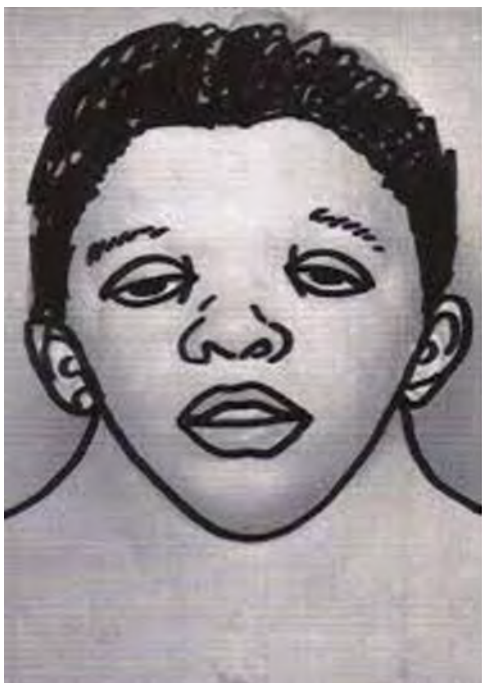
Figura 1 Ilustración esquemática del aspecto facial típico en el síndrome de Noonan.

diagnóstico prenatal es infrecuente. Se describe un amplio espectro de alteraciones siendo la más común la estenosis pulmonar frecuentemente con válvulas displásicas (50-60%), la miocardiopatía hipertrófica (20%) 4 , usualmente presente en etapas tempranas de la vida 5 , defectos del septum atrial (6-10%) y ventricular, estenosis de la rama de la arteria pulmonar, anomalías de la válvula mitral, arterias coronarias, coartación de la aorta y, menos frecuente, la tetralogía de Fallot o ductus arterioso permeable.