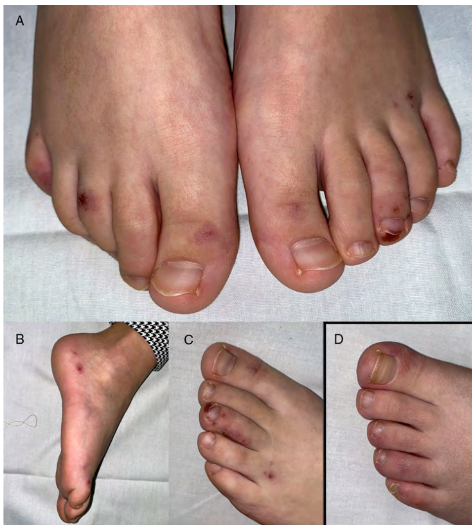
Figura 1 Lesiones acrales perniosiformes tipo purpúricas en la paciente 1. A y B) Pápulas purpúricas de aspecto hemorrágico, redondeadas y distribuidas simétricamente en falanges distales de dedos y talones de ambos pies. C) Detalle de la lesión de aspecto isquémico-hemorrágico en región subungueal del tercer dedo del pie izquierdo. D) Lesiones acrales en la madre de la paciente 1, el mismo día de la consulta, de similares características clínicas, pero con menor componente hemorrágico.