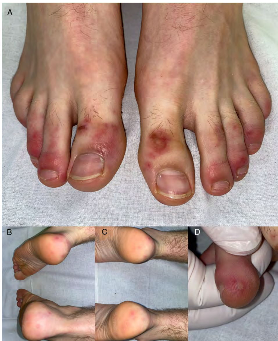
Figura 2 Lesiones acrales perniosisiformes tipo eritema multiforme en el paciente 2. A-C) Pápulas eritemato-violáceas edematosas, redondeadas y distribuidas simétricamente en falanges distales de dedos, talones y plantas de ambos pies. D) Detalle de la lesión en la que se aprecia tendencia a la formación de ampollas sobre algunas de las pápulas.