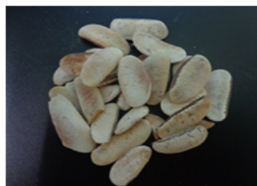
c. Biji mahoni