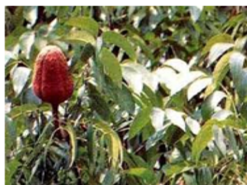
a. Pohon mahoni

Kandungan total fenol dalam ekstrak diukur menggunakan metode reagen Folin - Ciocalteu. 1 mL ekstrak (0.01 g/ml) ditambahkan dengan 5 ml reagen Folin - Ciocalteu (diencerkan sepuluh kali lipat) dan disimpan selama 4 menit pada suhu kamar. Kemudian, campuran tersebut