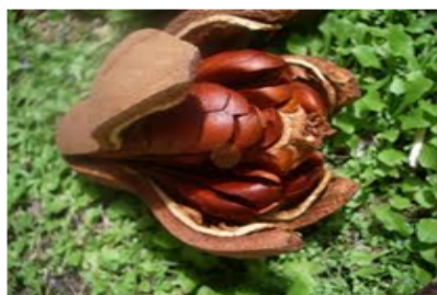
b. Buah mahoni