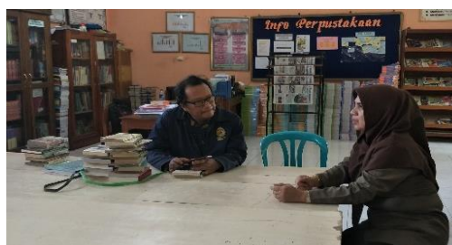
Gambar 1. Wawancara TIM PKM dengan Mitra

Pembangunan Perpustakaan Sekolah merupakan masalah yang kompleks, karena menyangkut berbagai aspek dan dimensi serta melibatkan berbagai pihak dengan permasalahan yang saling terkait dan luas. Perlu disadari pula bahwa Perpustakaan Sekolah merupakan bagian integral dari suatu sistem pendidikan. Sejalan dengan desentralisasi pendidikan, maka pembangunan Perpustakaan Sekolah di kabupaten Demak diupayakan dapat dilaksanakan secara bertahap, terencana, sistematis dan terkoordinasi. Sesuai dengan Undang-Undang Nomor 20 Tahun 2003 tentang Sistem Pendidikan Nasional, maka pembangunan Pendidikan di Kabupaten Demak harus mampu meningkatkan akses masyarakat terhadap pendidikan yang berkualitas dan dapat meningkatkan pemerataan pelayanan pendidikan, kualitas dan relevansi pendidikan serta meningkatkan efisiensi dan efektivitas pelayanan pendidikan (FATIMAH et al., 2019).