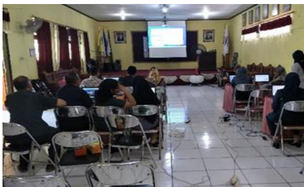
Gambar 2. Suasana Pelatihan SLIM di SMP N 3 Mranggen Kabupaten Demak

Pelatihan di laksanakan dalam 7 tahap yaitu : Pelatihan Pengelolaan Sirkulasi Buku, Pelatihan pembuatan pengkodean menggunakan Barcode , Pelatihan menginstal hardware perangkat keras berupa scanner infrared dan menggunakan software