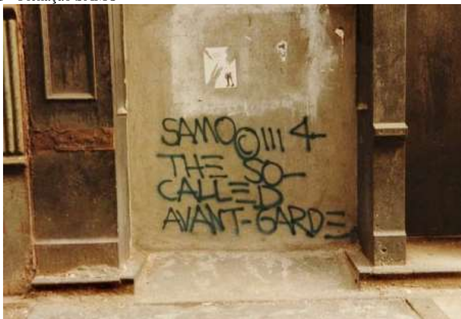
Figura 3 - Pichação SAMO

Durante a sua adolescência, Basquiat era, juntamente com seu amigo de escola Al Diaz, SAMO ( same old shit ), um codinome usado em pichações sarcásticas e provocantes, como: “SAMO as an alternative to God”. Aqui, vê-se novamente a noção de se proteger da cidade e de seus reflexos com humor e sarcasmo a partir de uma expressão artística. De acordo com Diaz ( apud TRAYNOR, 2017), eles queriam mudar a ideia de pichação que estava em voga na época, a qual visava apenas à marcação de território. Assim, buscavam locais estratégicos para chamar a atenção daqueles que passavam, como na porta de galerias de arte e estações de metrô, e apenas no sul de Manhattan, por ser lá onde acontecia o mundo da arte da cidade. Algumas dessas frases podem ainda ser encontradas pelas ruas de Nova York, outras já foram levadas por novas pinturas, pôsteres ou pichações.