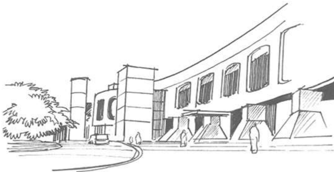
Figura 1 - Desenho do CCBB