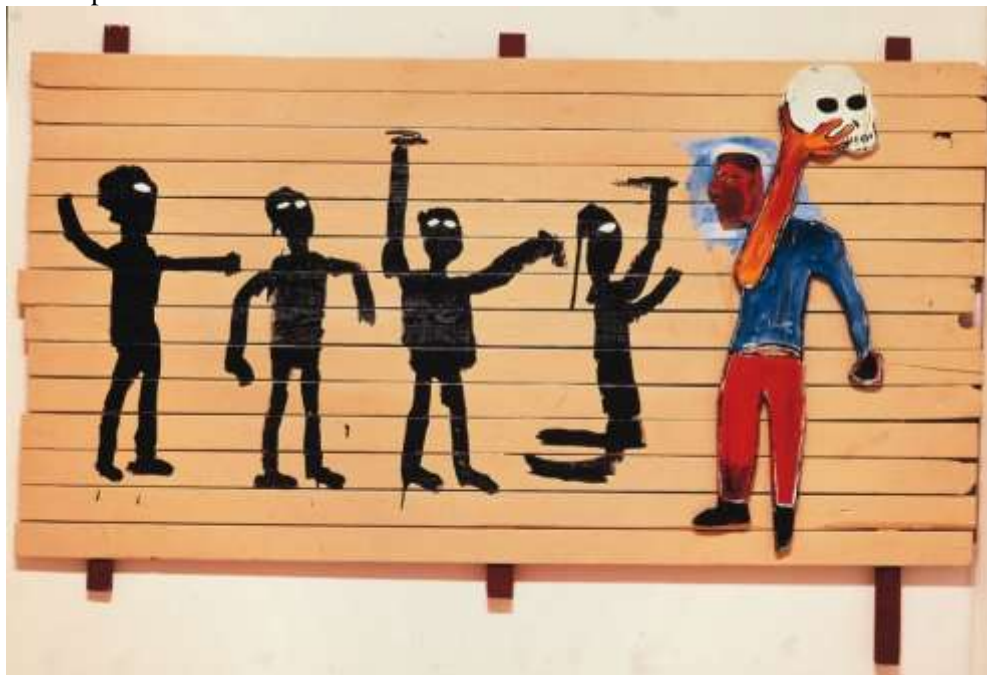
Figura 10 - “A procissão”