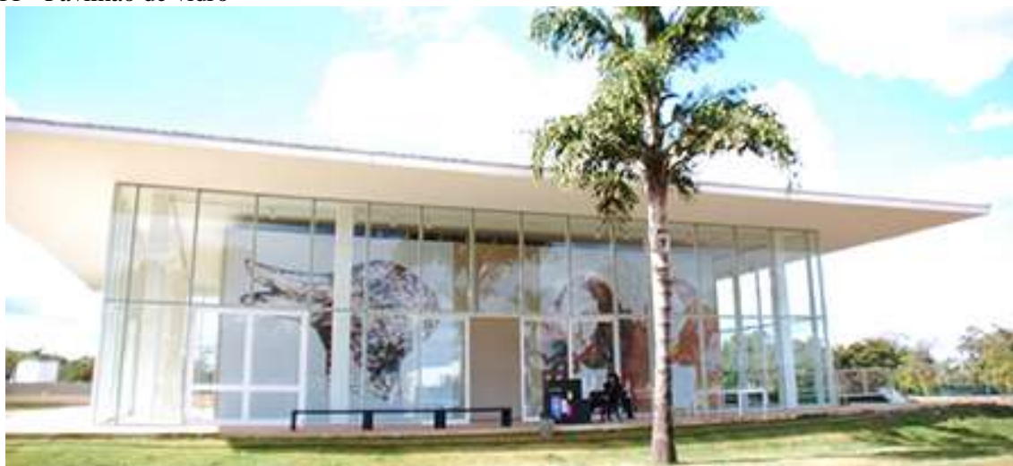
Figura 11 - Pavilhão de vidro