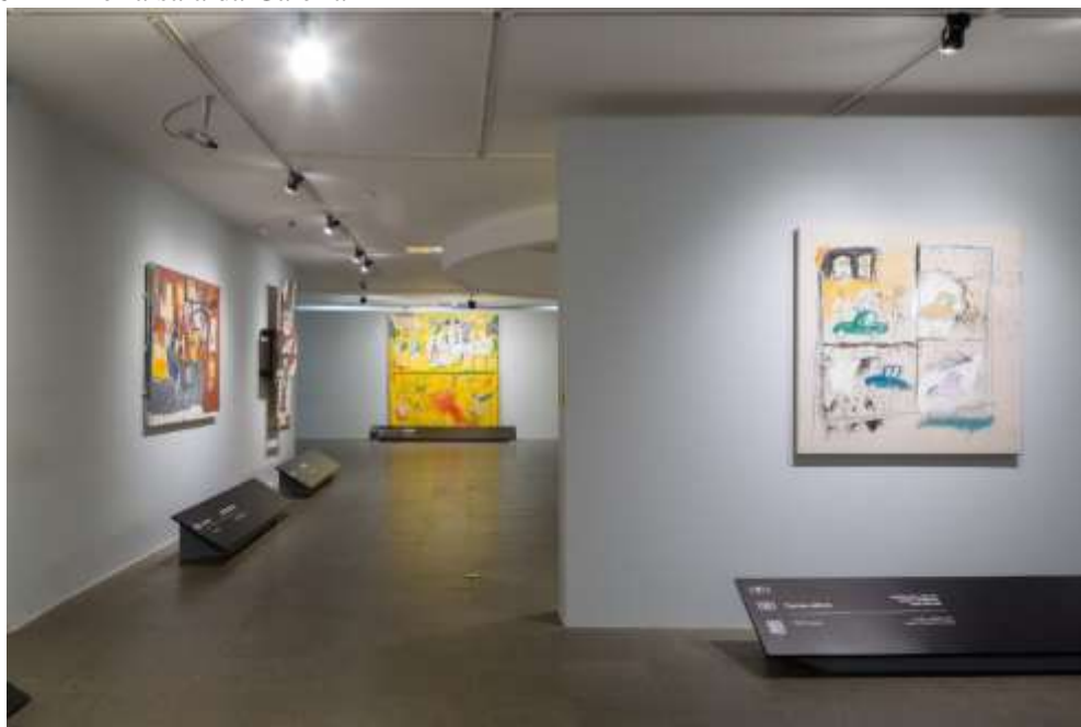
Figura 6 - Primeira sala da Galeria 1

O motivo para isso foi explicado pelo curador durante a visita guiada. As obras expostas são muito frágeis, tanto pela quantidade de materiais utilizados quanto por seu tempo, por isso, deve-se impossibilitar o contato do público. Além disso, Tjabbes evidenciou que a escolha dessas formas de proteção foi também específica ao público brasileiro. Ele disse que, nesse país, o fato de não se gostar das obras pode ser uma legitimação para o toque.