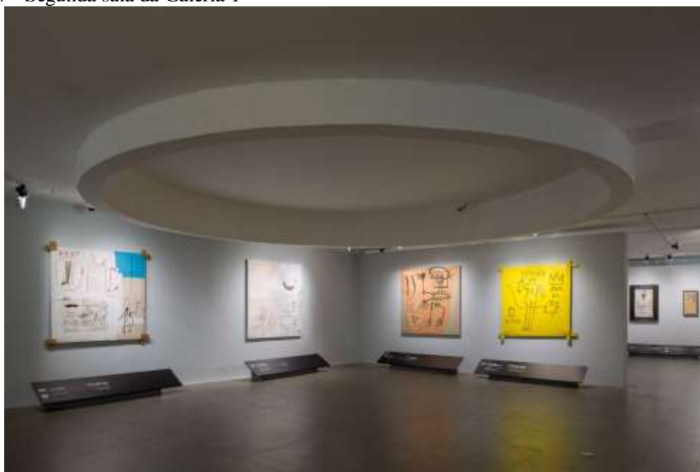
Figura 7 - Segunda sala da Galeria 1

A partir da disposição das primeiras telas mostra-se, como menciona Tjabbes, “uma bagunça de que também fazemos parte”, ou seja, um artista versátil e contrastante quando se colocou lado a lado a tal porta e um quadro a óleo de quase dois metros de altura e largura. Basquiat era um artista que prezava cores sólidas, jogos de palavras e diferentes relevos e materiais. Trouxe novamente a figuração e a expressão em tela, tudo o que se pode ver na primeira galeria. Isso, voltando à “bagunça” referida pelo curador, significa o caos urbano em que rotineiramente vivemos.