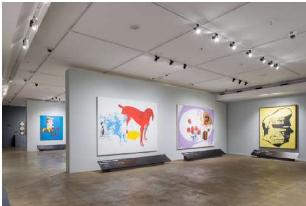
Figura 9 - Galeria 2