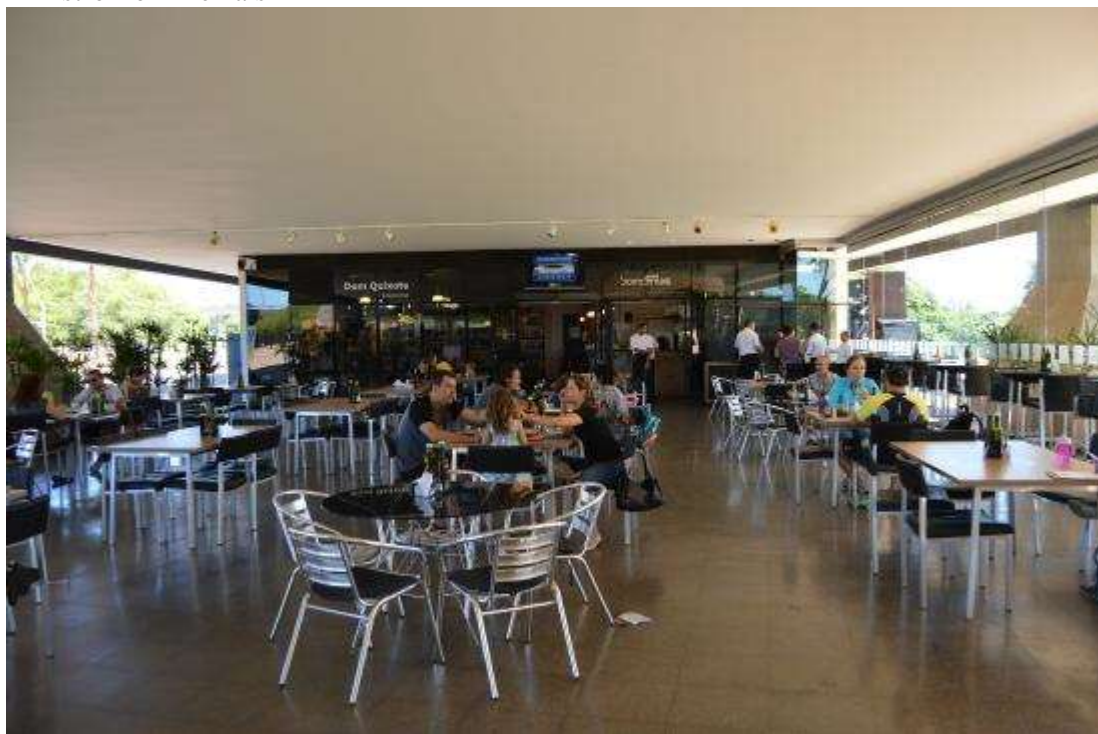
Figura 2 - Bistrô Bom Demais

maior do que no horário de almoço, em que se registra um maior número de mulheres, a maioria com idade em torno dos 40 anos.