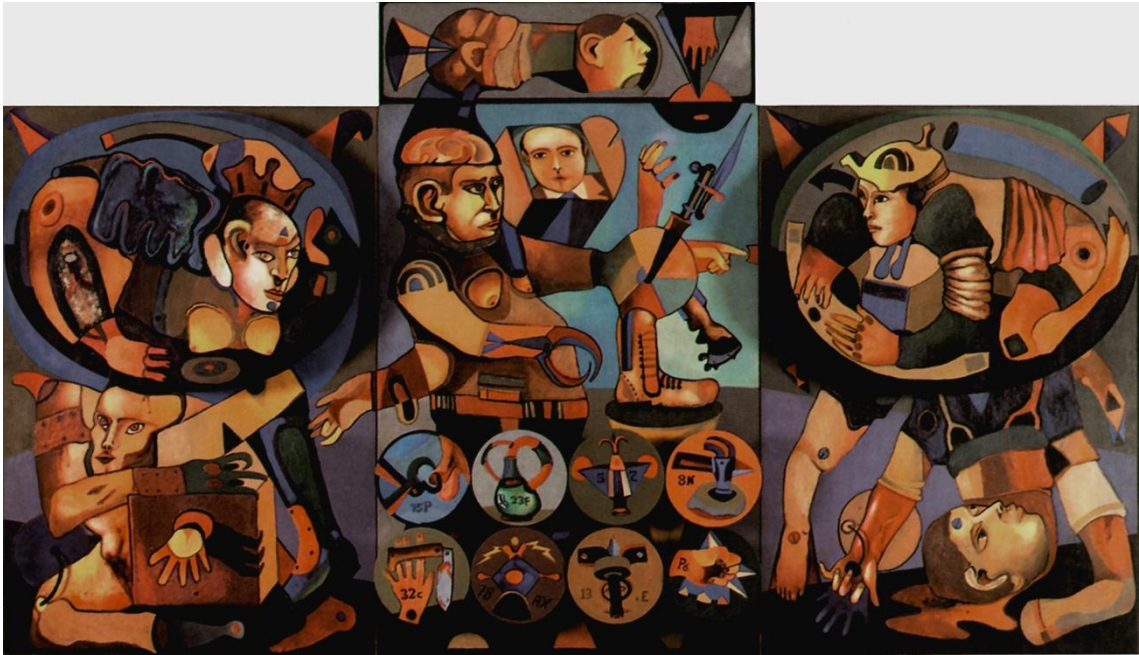
Fig. 4 – João Câmara, Exposição e motivos da violência , 1967

59 obras que criticam a ditadura militar brasileira; o tríptico em tinta óleo sobre madeira de João Câmara, intitulado “Exposição de Motivos de Violência”, que foi vencedor do 4º Grande Prêmio do Salão de Arte do Distrito Federal ocorrido em 1967 – na ocasião, o evento foi fechado e as obras confiscadas –; e, a frase de Mario Pedrosa “Em tempos de crise melhor ficar do lado dos artistas”.