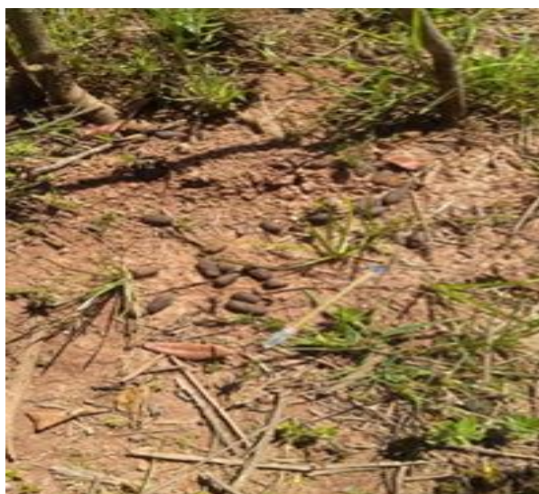
Figura 4: Presença de fezes de capivara avistada na margem direita da barragem do Ribeirão do Gama na Fazenda Água Limpa.

O início de ocorrência de fauna tem extrema importância no papel da dispersão de sementes e contribui largamente no processo de regeneração de um local (Figura 4). Espera-se que através de endozoocoria, com a passagem dos frutos e sementes pelo trato digestivo das capivaras e de outros animais, que as sementes ainda consigam germinar e dar origem a novas plântulas (SILVA, 2013)