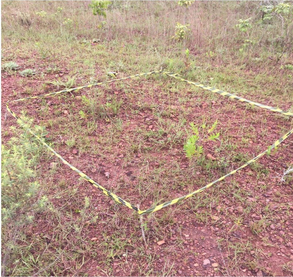
Figura 2: Parcela de 2 x 2 m na Área B, destacando o hábito herbáceo dos indivíduos encontrados.