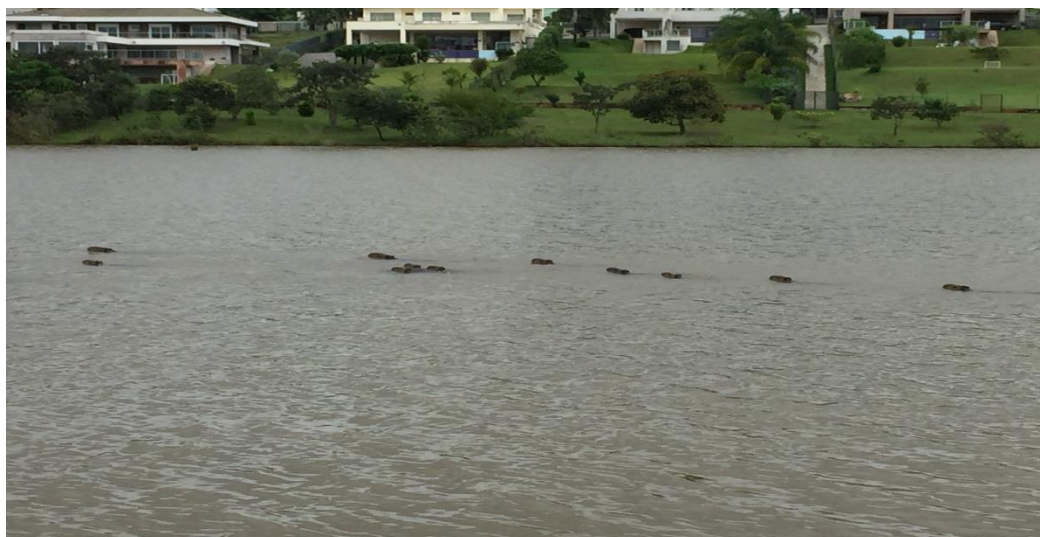
Figura 3: Presença de capivaras avistadas na margem da barragem do Ribeirão do Gama na Fazenda Água Limpa.

O percentual de recobrimento do solo é também um importante indicador biológico, pois, a exposição direta aos raios solares e o impacto das gotas da chuva estimulam a desestruturação e a desagregação do solo, que resulta em erosão. Daí tem-se a grande importância da cobertura vegetal, que mantém a umidade do solo e auxilia na decomposição da parte aérea e sistema radicular, promovendo o reforço de matéria orgânica e nutrientes no solo. (MORAES, 2006).