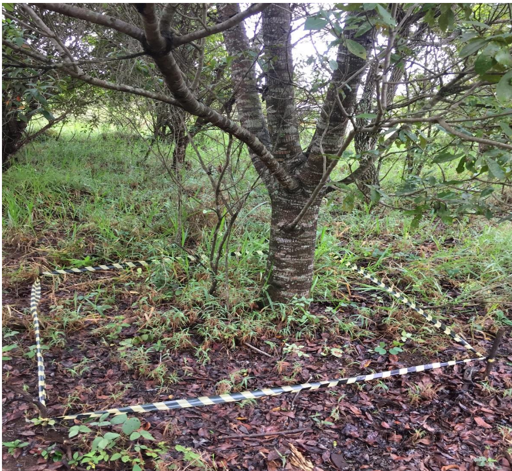
Figura 1: Parcela de 2 x 2 m na Área A, destacando o hábito dos indivíduos encontrados.

Cada parcela contém 4 metros quadrados e a repetição no número se deve a presença de mais de um indivíduo na amostra. Observa-se, no Quadro 1, que na Área A, a maior incidência foi de espécies arbóreas (59%), seguido de espécies herbáceas (30%) e subarbusivas (11%). Não foram encontradas espécies com flor ou frutos; provavelmente por estas espécies investirem na reprodução sexuada no segundo semestre.