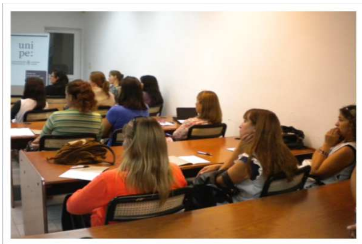
Ateneo con directivos en UNIFE, sede Del Viso, provincia de Buenos Aires.