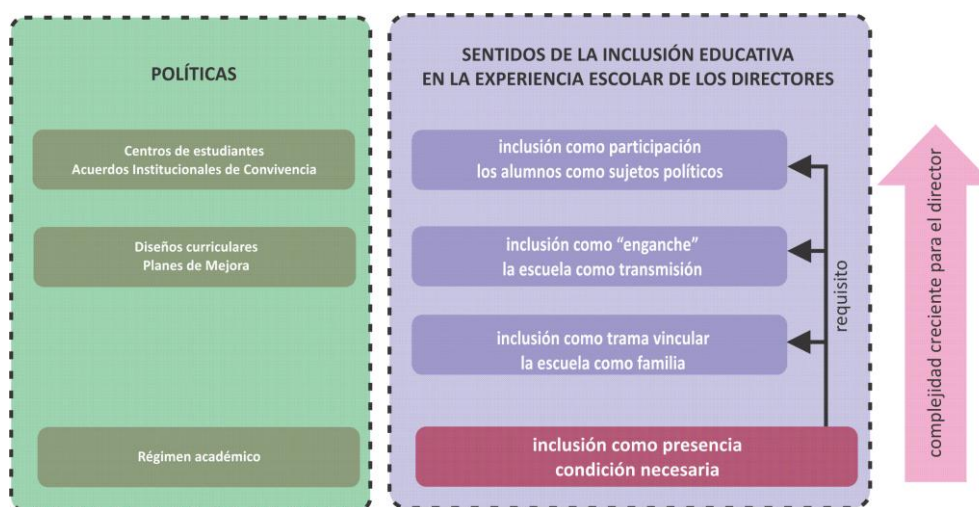
Gráfico 2: Sentidos de la inclusión educativa en la experiencia escolar de los directores

Las expresiones de los directores en las entrevistas conducen a identificar estas lógicas como las que organizan los sentidos producidos sobre el mundo escolar. A su vez, estos sentidos conducen al lugar y los límites que tiene la inclusión educativa para los directores.