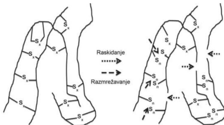
Slika 2. Prikaz strukturalnih izmena u postupcima recikliranja elastomera umreženih sumporom.