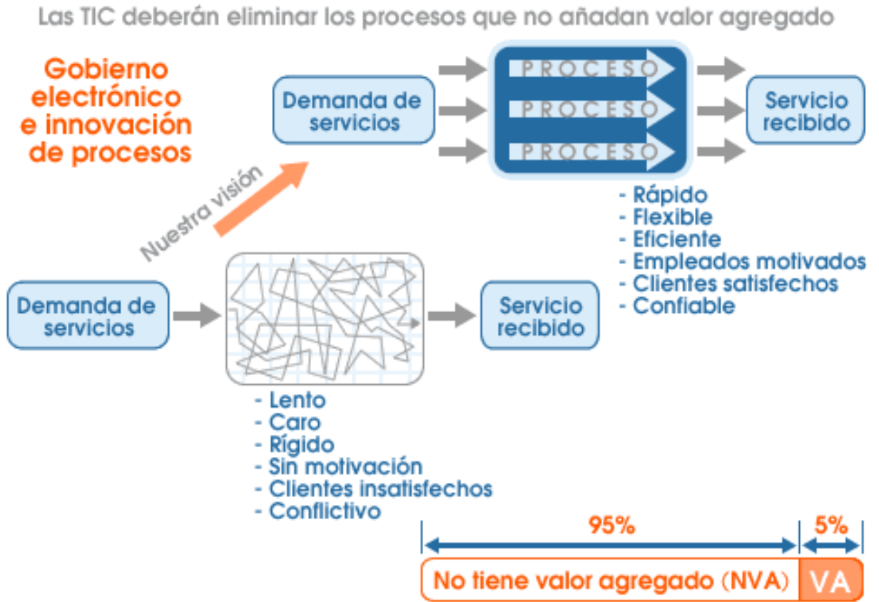
Lustración 2: Modelo estratégico de Innovación.

Anexo 3 El siguiente esquema se visualiza las fases del gobierno electrónico en México y los procesos de innovación.