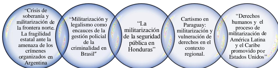
Figura 3.- Selección de investigaciones para la primera búsqueda.

Se dispuso a establecer como estudios pertinentes a la investigación, los que a continuación serán debidamente se detallan.