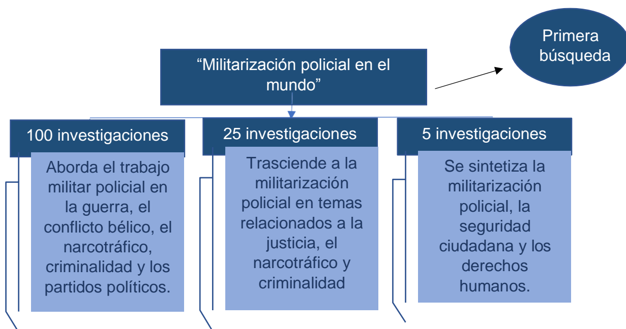
Figura 2: Esquema de criterios importantes en la primera búsqueda de investigaciones “Militarización policial en el mundo”.

Con un intervalo de años entre (2015 – 2020) se realizó la primera búsqueda: con el título “Militarización policial en el mundo”, donde se puede observar 6, 566 resultados en idioma español, de los cuales se determinó considerar de manera inicial cien investigaciones, seguidamente se optó por veinticinco de ellas y finalmente se establece que cinco investigaciones se encuentran direccionadas al tema en estudio.