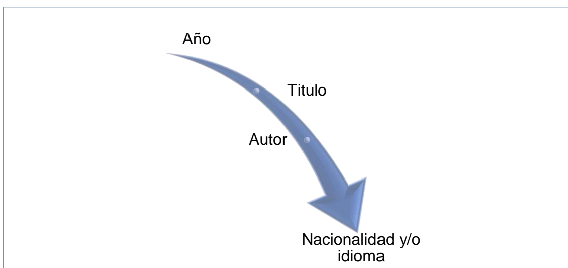
Figura 1: Esquema de criterios seleccionados para la búsqueda de información

Utilizando la ayuda de “Google académico” y la herramienta “Zotero” para la búsqueda, inserté los siguientes criterios necesarios para lograr incidir en la información con mayor alcance al tema en estudio.