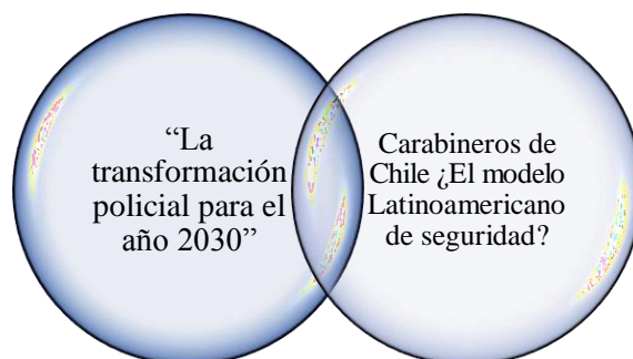
Figura 7.- Selección de investigaciones para la tercera búsqueda

Se dispuso a establecer como estudios pertinentes a la investigación, los que a continuación serán debidamente se detallan.