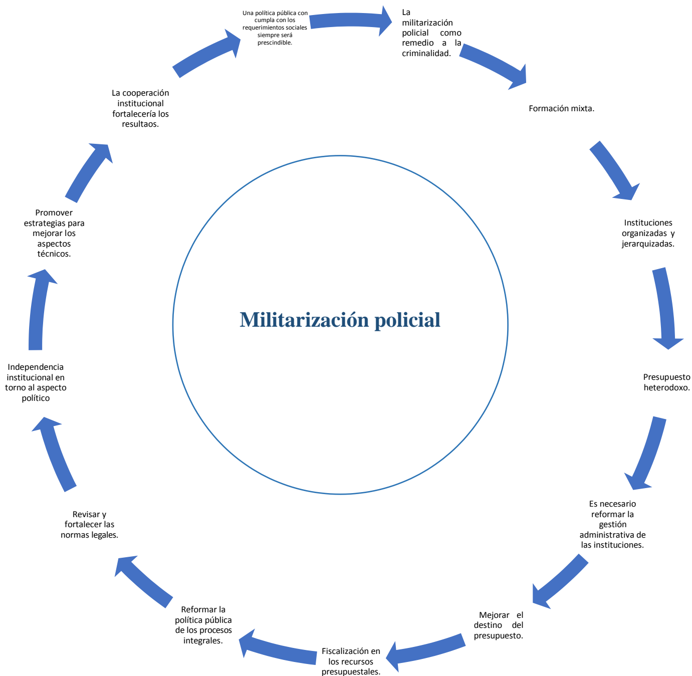
Figura 8.- Resumen de las entrevistas

A través de la entrevista realizada a dos profesionales inmersos en el estudio realizado en base a trece interrogantes, abordando tres dimensiones de la matriz de operacionalización de las variables se obtuvo información relevante a la investigación que a continuación se detalla.