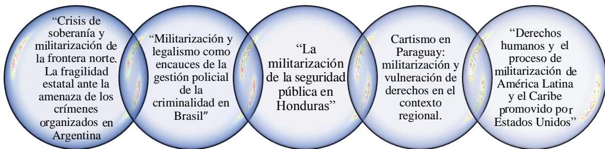
Figura 3.- Selección de investigaciones para la primera búsqueda.

Se dispuso a establecer como estudios pertinentes a la investigación, los que a continuación serán debidamente se detallan.