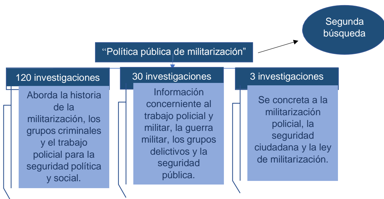
Figura 4: Esquema de criterios importantes en la segunda búsqueda de investigaciones “Política pública de militarización policial”.

Con un intervalo entre los años (2019 – 2020) se realizó la segunda búsqueda, con el título: “Política pública de militarización policial”, donde se puede observar 1.760 resultados en idioma español, de los cuales se escogió de manera inicial ciento veinte investigaciones, seguidamente se optó por treinta de ellas y finalmente se establece que tres investigaciones se encuentran direccionadas al tema en estudio.