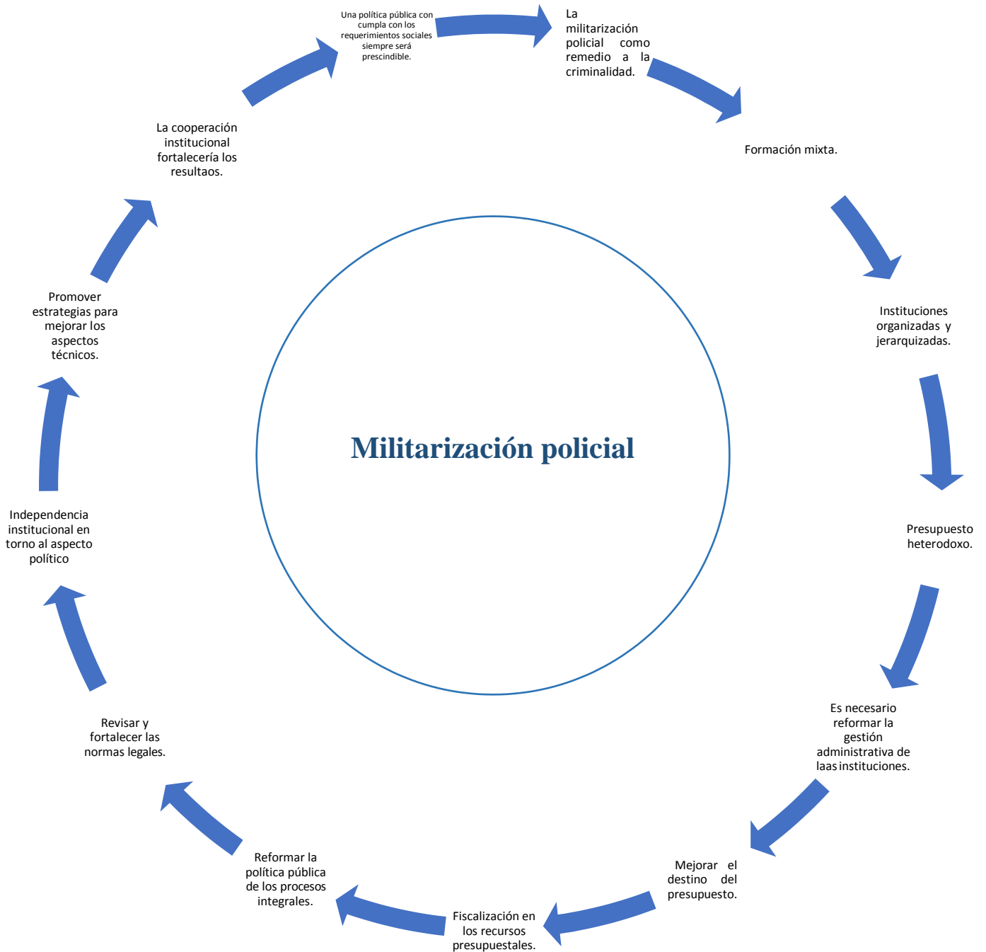
Figura 8.- Resumen de las entrevistas

A través de la entrevista realizada a dos profesionales inmersos en el estudio realizado en base a trece interrogantes, abordando tres dimensiones de la matriz de operacionalización de las variables se obtuvo información relevante a la investigación que a continuación se detalla.