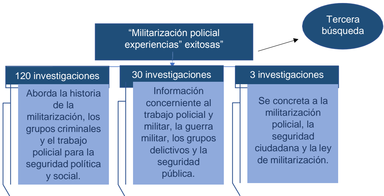
Figura 6: Esquema de criterios importantes en la tercera búsqueda de investigaciones: “Militarización policial experiencias exitosas”

Considerando como intervalo los años (2019 – 2020) se realizó la tercera búsqueda, con el título: “Militarización policial experiencias exitosas”, donde se puede observar 672 resultados en idioma español, de los cuales se escogió de manera inicial ciento cincuenta investigaciones, seguidamente se optó por cincuenta de ellas y finalmente se determinaron cinco investigaciones que se encuentran direccionadas al tema en estudio.