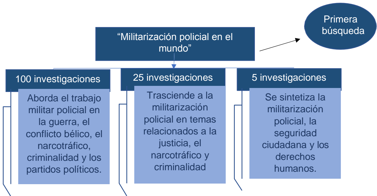
Figura 2: Esquema de criterios importantes en la primera búsqueda de investigaciones "Militarización policial en el mundo".

Se dispuso a establecer como estudios pertinentes a la investigación, los que a continuación serán debidamente se detallan.