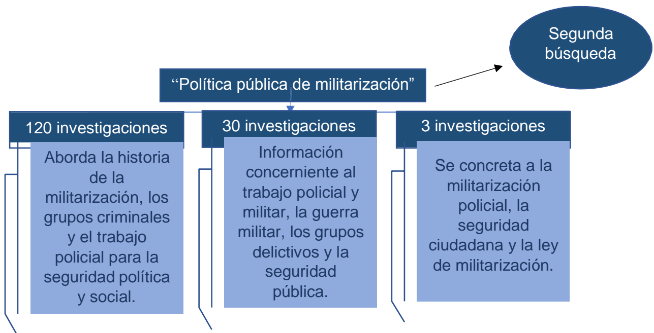
Figura 4: Esquema de criterios importantes en la segunda búsqueda de investigaciones “Política pública de militarización policial”.

Con un intervalo entre los años (2019 – 2020) se realizó la segunda búsqueda, con el título: “Política pública de militarización policial”, donde se puede observar 1.760 resultados en idioma español, de los cuales se escogió de manera inicial ciento veinte investigaciones, seguidamente se optó por treinta de ellas y finalmente se establece que tres investigaciones se encuentran direccionadas al tema en estudio.