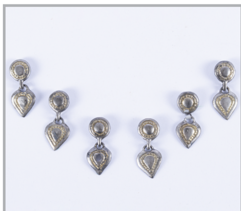
67. kép Csüngőtagos ingnyakveretek Ószentivánról