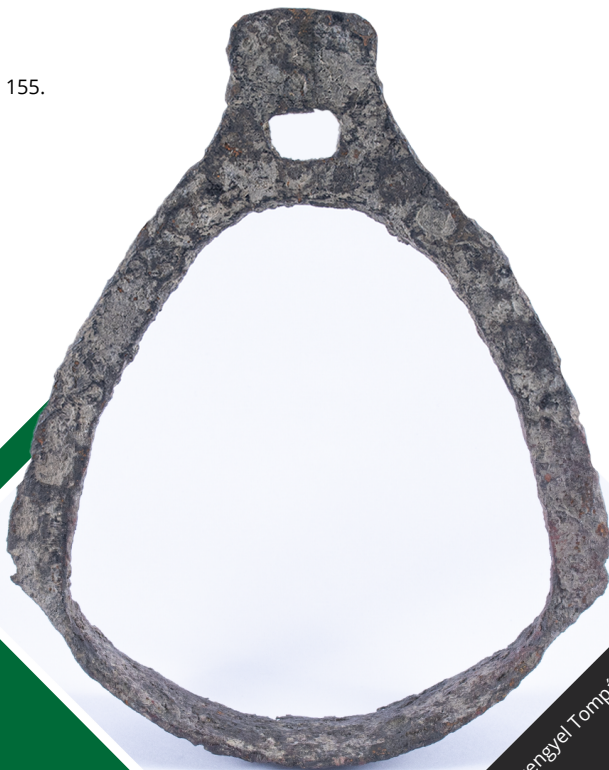
72. kép Körte alakú vaskengyel Tompáról