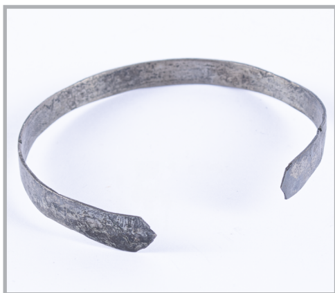
70. kép Kiszélesedő lemezkarperec Bánkútról