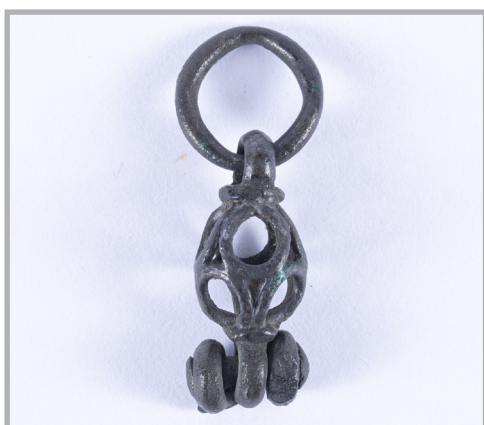
71. kép Áttört kosaras csüngő Bánkútról