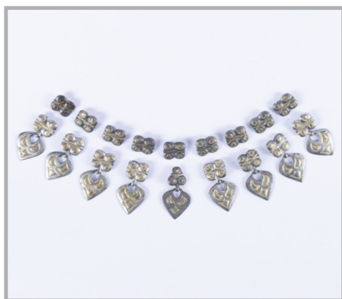
68. kép Ingnyakveretek Bánkútról

egyik verettípusának, 5 míg a bánkúti darabok pontos párhuzamai például a Szentes-Libahalmon/Jámborhalmon 1902-ben szórványként előkerült daraboknak. A korszak viseletének jellemző elemei továbbá a bronz fülesgombok, melyeket gyűjteményünkben Bánkútról egy tömör darab képvisel [69. kép, Kat. 58]. A leírások alapján az ószentiváni nő szintén rendelkezett enyhén lapított gömb alakú fülesgombokkal, ezek hollétéről azonban nincs adatunk. 6