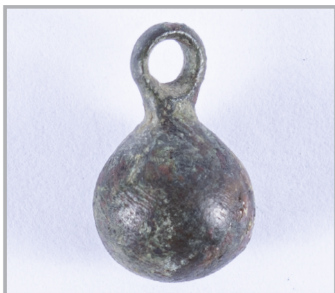
69. kép Tömör fülesgomb Bánkútról

Habár országos összevetésben sem az ószentiváni, sem a bánkúti sír nem számít különösebben előkelőnek, leletanyaguk révén mégis kiemelkednek közvetlen környezetükből. 11 E tárgyak a tompai leletekkel együtt képezik gyűjteményünk értékes, 10. századra korhatározható anyagát.