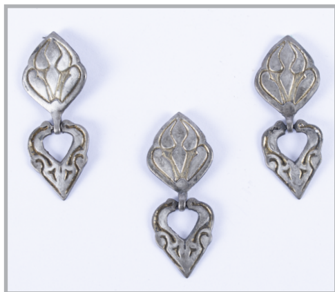
66. kép Csüngőtagos kaftánveretek Ószentivánról