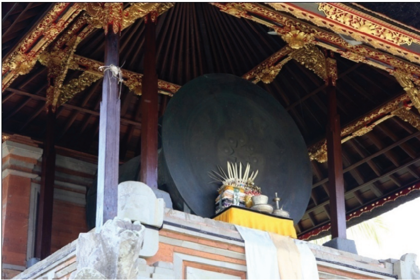
Gb. 2.1 Nekara “Bulan Pejeng”: Dokumentasi Made Setiawan, 2015.

sebagai tonggak awal peradaban tinggi dimiliki masyarakat Bali, selain diberi persaksian oleh tinggalan nekara “Bulan Pejeng” juga tinggalan budaya yang diwariskan dari zaman Bali Kuna yang berada di sepanjang DAS Pakerisan dan Petanu, serta warisan di Desa Pejeng dan Bedulu. Tinggalan budaya yang diwariskan jumlahnya sangat banyak, tidak hanya bernilai sejarah, agama, budaya, dan ilmu pengetahuan, tetapi juga dapat menggambarkan perjalanan sejarah Bali dari zaman Pra Hindu dan awal masuknya Hindu sampai dengan runtuhnya Bali ke tangan Majapahit (778M-1343M). Nekara “Bulan Pejeng” sebagai representasi dari zaman Pra-Hindu.