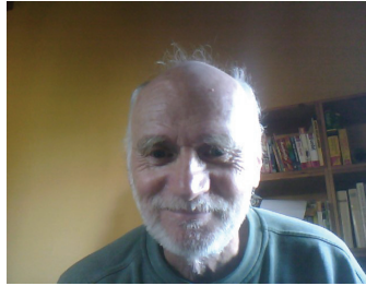
Michael Kuhn/ World SSHNet

R electing about the social world through the concept of culture is a challenge and deserves substantial and critical attention: