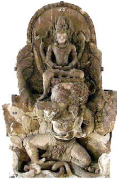
Gambar Airlangga sebagai Wisnu naik Garuda dari Candi Belahan, Jawa Timur

“Rajarsi: nyineb kaprabon, madeg pandita”