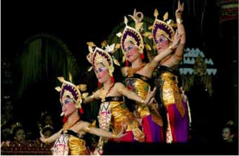
Gb. Tari Cilinaya, Karya I Wayan Dibia 1986