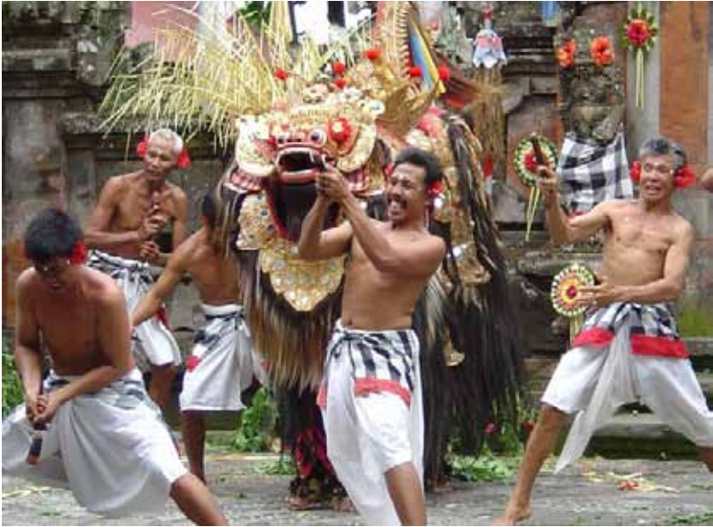
Gb. Tari Barong dan Keris

Tarian ini adalah tontonan wisata menggunakan barong duplikat dan dipagelarkan pada sebuah stage di Batubulan-Sukawati-Gianyar