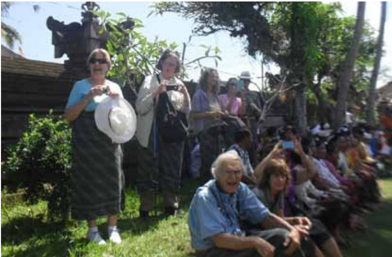
Gb. Para Wisatawan Asing Membaur dengan Masyarakat Ketika Upacara Keagamaan “ Pujawali ” Yang Dilaksanakan Setiap Tahun Sekali di Pura Penataran Sasih Pejeng