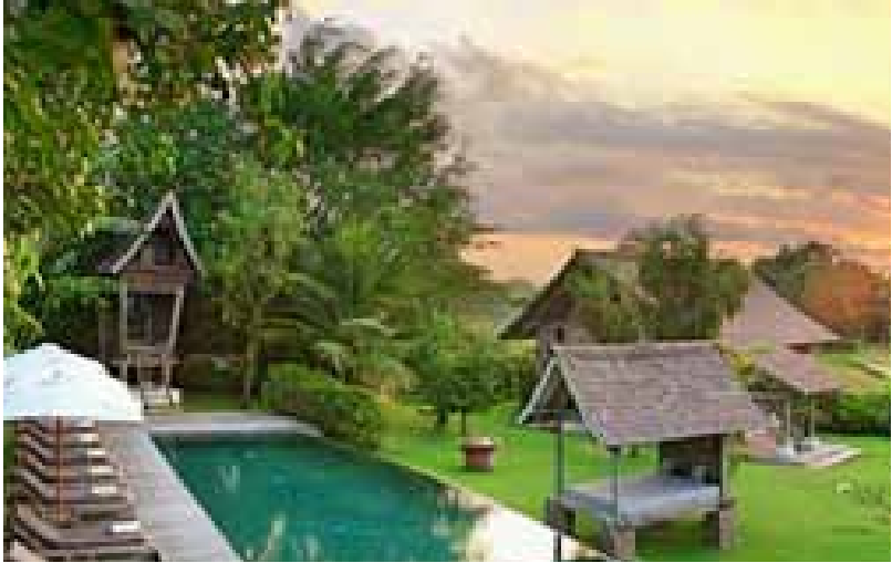
Gb. Villa yang dibangun di tengah-tengah sawah

petani, merasa kehilangan lapangan pekerjaan yang telah diketukuni bertahun-tahun. Gambar berikut adalah tanah produktif yang dialihfungsikan menjadi villa .