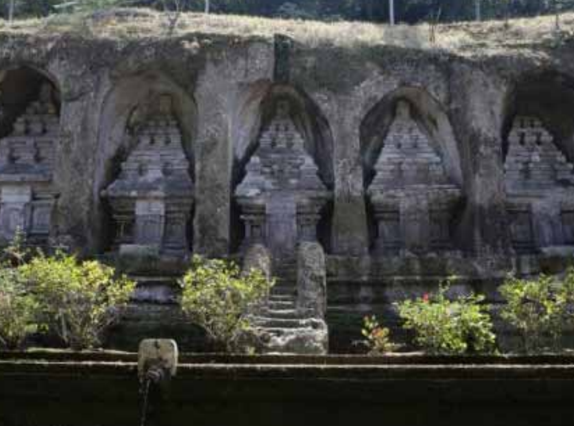
Gb. Warisan Arsitektur Candi Tebing Gunung Kawi, Tampaksiring, Gianyar “Warisan Budaya Dunia”

Dua desa yang berada di antara DAS Pekerisan dan Petanu (Pejeng dan Bedulu) yang dikenal kaya dengan warisan budaya, dan sebelumnya telah ditetapkan sebagai zona konservasi budaya oleh Pemerintah Kabupaten Gianyar. Sebagaimana diketahui, bahwa Desa Pejeng dan Bedulu adalah merupakan pusat kerajaan di Jaman Bali Kuna, dan Pura Penataran Sasih berstatus sebagai pura penataran kerajaan (Raka, 2016). Untuk memperjelas dan meyakinkan bahwa Pejeng Pusat kerajaan zaman Bali Kuna bahkan sebagai tonggak awal peradaban Bali. Sebagai pusat kerajaan di zaman Bali Kuna, selain diberi persaksian oleh barisan candi tebing di sepanjang DAS Pekerisan, tetapi juga tinggalan budaya yang diwariskan dari zaman Bali Kuna di kedua desa tersebut, baik dalam bentuk