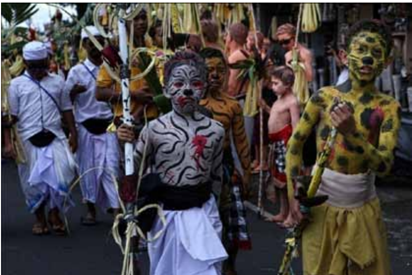
Gb. Tradisi Ngeregeb Bumi , di Tegallalang, Gianyar

Saat ini tradisi mapeed ada di seluruh Bali. Tradisi mapeed biasa dipagelarkan setiap pawai Pesta Kesenian Bali (PKB) yang dilaksanakan setiap tahun sekali dan diikuti oleh seluruh kabupaten/kota di Bali