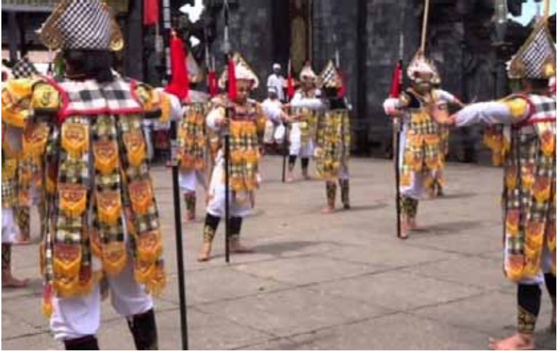
Gb. Tari Baris Gede (Baris Tombak) dipagelarkan ketika upacara dewa yadnya "piodalan" di kahyangan jagat, kahyangan tiga, dan bentuk upacara dewa yadnya lainnya