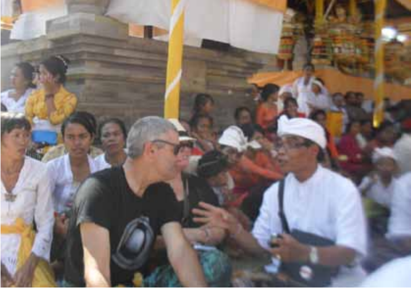
Gb. Dialog Peneliti dengan Wisatawan Australia Ketika Upacara Keagamaan “Pujawali” di Pura Penataran Sasih Pejeng