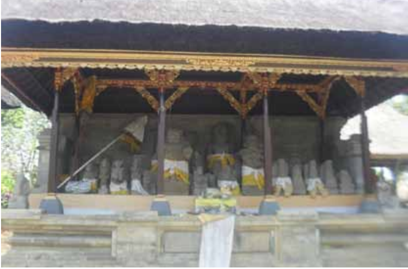
Gb. Warisan Budaya “Seni Arca” Di Pura Penataran Sasih Pejeng Disakralkan dan Dipuja Oleh Warga Masyarakat Hindu di Bali

Selain warisan budaya seni rupa (seni arsitektur dan seni arca) yang berada di DAS Pakerisan dan Petanu dan di desa-desa yang berada di antara kedua aliran sungai sebagaimana terurai di depan, masih banyak hasil karya seni rupa (arsitektur) yang memiliki nilai sejarah, ilmu pengetahuan, budaya, dan keagamaan yang posisinya menyebar di kabupaten/kota di Bali. Di Kabupaten Gianyar, misalnya: Candi Canggih, Candi Wasan, dan Candi Hyang Tiba, Sakah (Sukawati); Pura Desa-Puseh Batuan (Sukawati); Pura Payogan Agung, Ketewel (Sukawati); Candi Tebing Jukut Paku, Singakerta (Ubud); Pura Payogan, Kedewatan (Ubud); Pura Gunung Lebah (Ubud); Pura Gunung Raung, Taro (Tegallalang); Pura Gunung Kawi, Sebatu (Tegallalang); dan Pura Hyang Api (Payangan), dan yang lainnya. Selanjutnya di Kota Denpasar, yaitu Pura Segara dan Pura Jumeneng (Sanur); Prasasti Blanjong (Sanur); Pura Sakenan (Serangan); Kabupaten Badung, yaitu Pura Sada (Kapal); Pura Taman Ayun (Mengwi); Pura Puncak Mangu