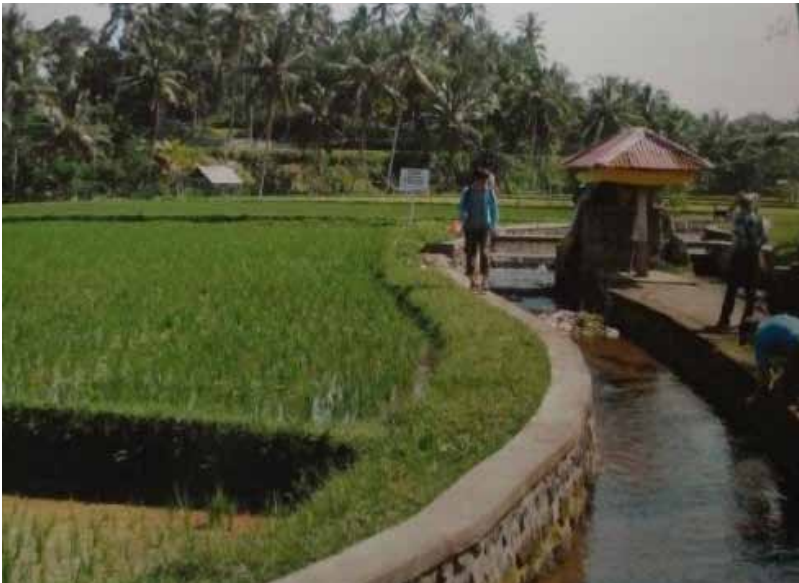
Gb. Hampan Sawah Subak Pulagan, Balai Timbangan, dan Petani Sedang Memperbaiki Saluran Air. Saat ini Subak Pulagan Telah Ditetapkan Sebagai Warisan Dunia