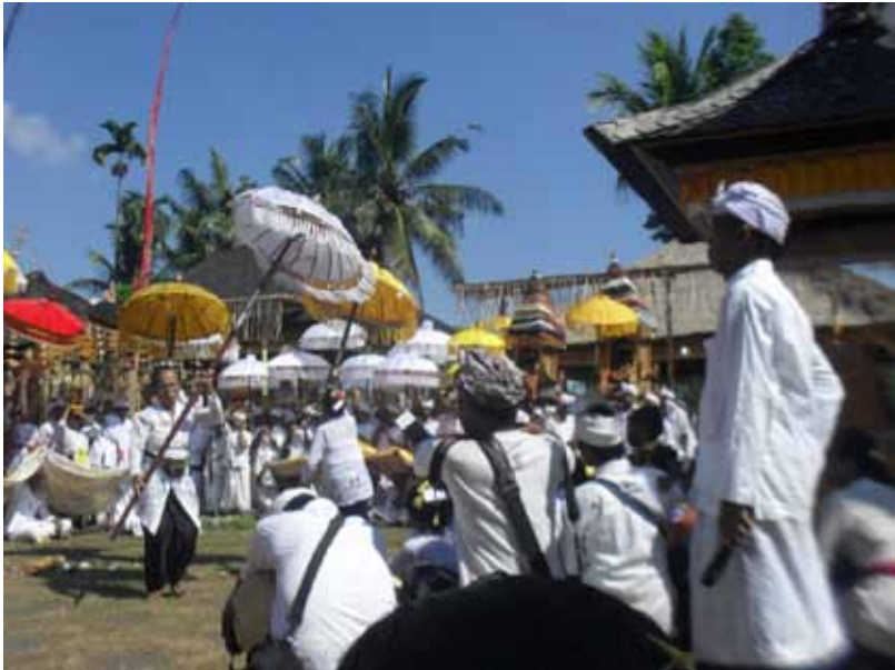
Gb. Upacara keagamaan didukung tradisi maplengkungan dan tari siat pajeng di areal suci Pura Penataran Sasih, Pejeng, Gianyar.

kekayaan Bali, dipilih beberapa desa yang ada di seluruh kabupaten/kota yang berpotensi sebagai sentra-sentra unggulan di bidang seni-budaya, adat-istiadat dan tradisi, serta upacara keagamaan sebagai sajian mewarnai isi buku ini. Sebagaimana diketahui, bahwa karena keberagaman dari ketiga aspek dimaksud dan didukung oleh keindahan panorama alamnya, dapat membuat keberadaan Bali berbeda dibanding pulau-pulau lain di Nusantara. Artinya, keberagaman Bali tidak hanya dapat dipandang dari aspek kehidupan seni-budaya, adat-istiadat dan kebiasaan, serta upacara keagamaan, tetapi juga dari aspek alam dan lingkungan.