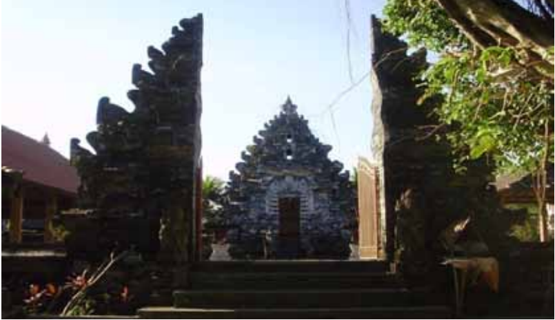
GB. Pura Masceti, Medahan-Kramas, Blahbatuh, Gianyar

Selain sebagai tempat persembahyang seluruh masyarakat Hindu di Bali, selanjutnya dengan dibangunnya Museum Subak, Masceti dipromosikan sebagai daya tarik wisata bahari (pantai), spiritual, dan museum dengan berbagai informasi tentang tatacara upacara keagamaan, sistem pola tanam, dan berbagai peralatan para petani, seperti: tenggala, singkal, pengigi, lampit, kaun lampit, pemelasaan, uga, sambet, camok, pecut, caluk, penampad , dan lain-lain.