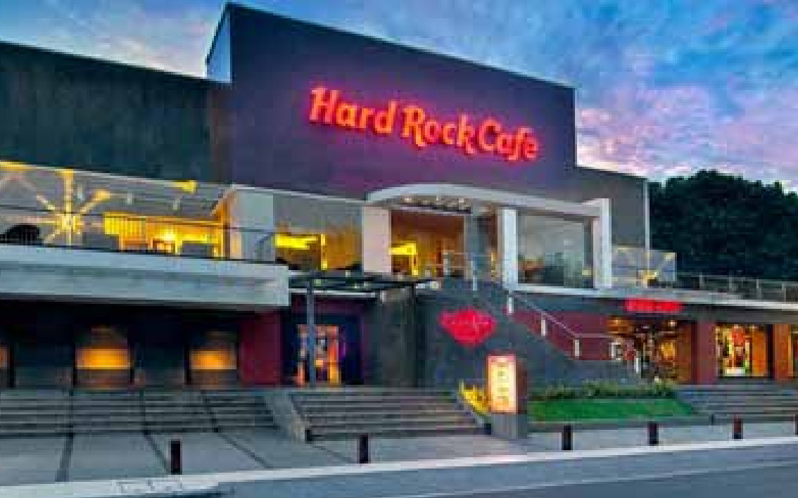
Hard Rock Cafee Bali

Aplikasi terhadap identitas arsitektur tradisional Bali khususnya di daerah Kuta tidak hanya bisa dilihat pada bangunan hotel besar. Akomodasi wisata yang lain juga masih banyak yang tetap berusaha menggunakan ciri arsitektur lokal Bali, dengan menambahkan unsur-unsur penting dalam rumah tradisional Bali, seperti penggunaan angku-angkul. Bangunan angkul-angkul merupakan salah satu identitas yang pertama kali terlihat, karena umumnya terletak di bagian depan rumah. Berbagai jenis atau tipe angkul-angkul yang ada di pemukiman tradisional Bali diadaptasi dengan bangunan-bangunan villa yang ada di kawasan Kuta. Seperti model angkul-angkul pemukiman rumah tradisional Bali di Penglipuran yang menjadi ikon Bali hingga ke mancanegara, misalnya.