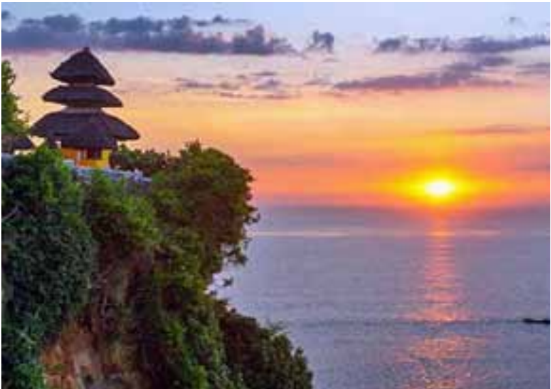
Gb. Pura Uluwatu, Pecatu-Badung Selain wisata kera juga yang lebih menarik adalah sunset