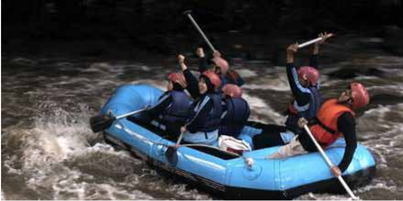
Gb. Arung Jeram/Rafting di Sungai Ayung, Perbatasan Badung dan Gianyar. Banyak menarik wisatawan Arung Jeram/Rafting