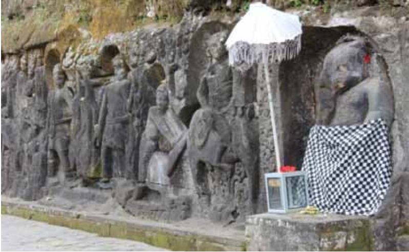
Gb. Relief Yeh Pulu, Bedulu, Blahbatuh. Sebuah Karya “Seni Media Rekam.” Mengisahkan tentang kehidupan sosial, ekonomi, budaya, dan keagamaan masyarakat abad 14 Masehi