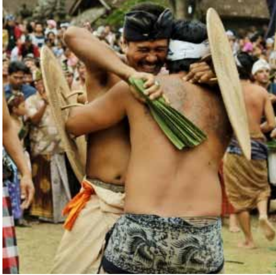
Gb. Tradisi Geret Pandan , di Tenganan-Karangasem Tradisi ini hanya ada di Desa Tenganan Pagringsingan dan dilaksanakan setiap tahun sekali sekitar bulan Juni