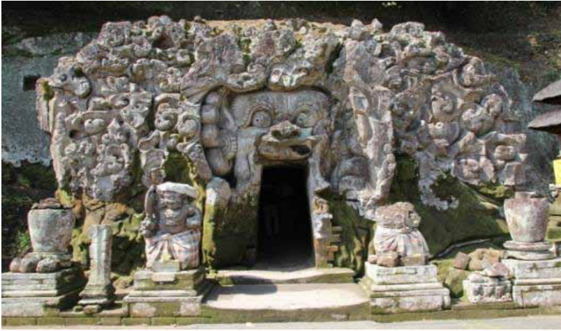
Gb. Goa Gajah-Bedulu, Sebuah Karya “Seni Media Rekam” Abad 11 Masehi Cerita yang diangkat sauna kehidupan di hutan, ada binatang dan ada pemburu yang mengintai.

yang rupanya sedang mendobrak gumpalan padas dengan tangannya untuk keluar (Kempers, 1956: 42).