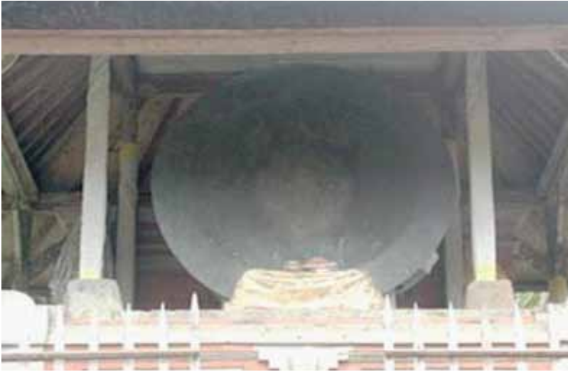
Gb. Nekara “Bulan Pejeng” Di Pura Penataran Sasih Pejeng salah satu Warisan Budaya Dari Zaman Perunggu

keberadaan alat cetak yang saat ini tersimpan di Manuaba, Tegallalang, menguatkan bahwa benda tersebut dibuat di Pejeng.