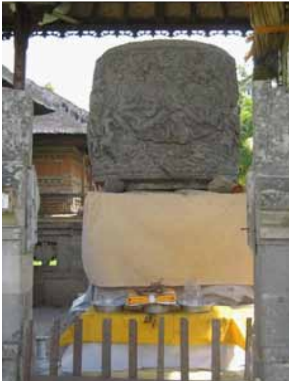
Gb. Sangku Sudamala “Mandara Giri” Di Pura Pusering Jagat, Desa Pejeng, Gianyar

harus tunduk kepada kekuasaan Majapahit (1343 M). Salah satu warisan budaya penting termasuk masa pemerintahan Raja Astarura berupa Bejana, yang oleh masyarakat setempat disebut Sangku Sudamala. Cerita yang diangkat dalam relief tersebut adalah “Mandara Giri” yang dipakai mengaduk lautan susu (Pemutaran Gunung Madara di Ksirarnawa). Warisan budaya tersebut saat ini tersimpan di Pura Pusering Jagat, Desa Pejeng.