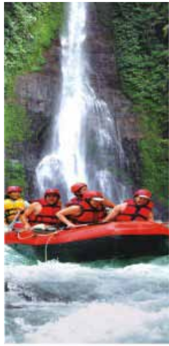
Gb. Arung jeram/Rafting di air terjun Tegenungan dan Sungai Ayung