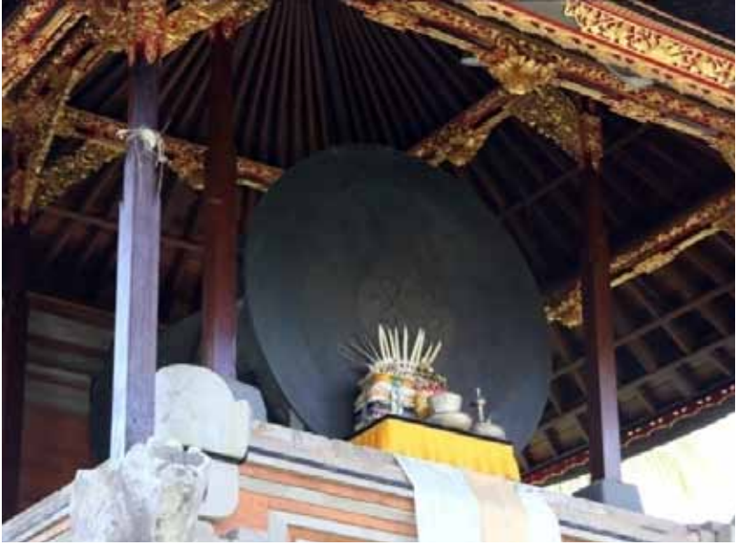
Gb. Warisan Budaya Nekara “Bulan Pejeng” Dari Zaman Prasejarah Disakralkan dan Dipuja Oleh Warga Masyarakat Hindu di Bali