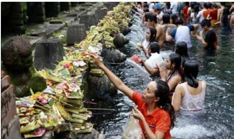
Gb. Ritual Keagamaan yang dapat dilakukan setiap hari (setiap waktu). “Melukat”(penyucian diri) di Pura Tirta Empul, Tampaksiring

Berbagai sebutan diberikan kepada pulau Bali, dan salah satu di antaranya adalah “Bali pulau yadnya ” (Bali pulau kurban). Disebut pulau yadnya (kurban), karena dalam kehidupan kesehariannya masyarakat di Bali tidak pernah terlepas dari kegiatan beriyadnya . Selain kegiatan yadnya (kurban) sehari-hari ( nitya karma ) masyarakat Bali juga melaksanakan kegiatan upacara keagamaan ( yadnya ) pada waktu-waktu tertentu ( naimitika karma ). Untuk kegiatan yadnya pada waktu-waktu tertentu ada dilaksanakan berdasarkan sasih ( puhnama dan tilem ), dan ada pula yang berdasarkan wuku . Setiap tempat suci (pura) yang ribuan jumlahnya masing-masing memiliki hari upacara keagamaan ( piodalan/pujawali ), ada yang jatuhnya bersamaan di antara satu tempat suci dan tempat suci lainnya, dan ada pula yang berbeda. Karena banyaknya pura di Bali, sehingga dalam bentangan waktu setahun (365/366 hari) tiada hari tanpa kegiatan upacara keagamaan. Pada bagian di bawah ini disajikan bentuk-bentuk upacara keagamaan, baik yang dilaksanakan setiap hari maupun pada waktu (hari) tertentu.