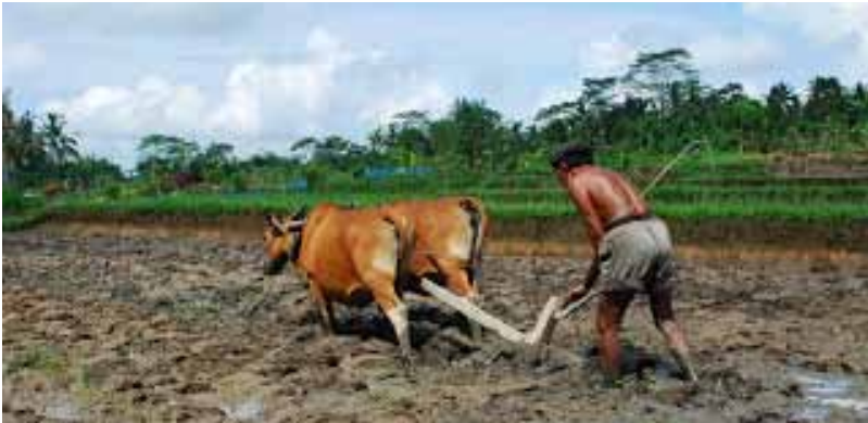
Gb. Petani sedang membajak sawah menggunakan alat bajak tradisional “tengala” ditarik dua ekor sapi