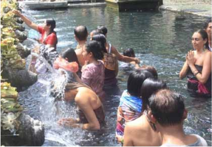
GB. Wisatawan Membaur “ Melukat ” (Membersihkan Diri) di Kolam Suci, Pura Tirta Empul Tampaksiring, Gianyar