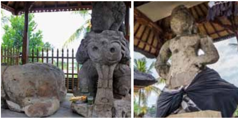
Gb. Arca Siwa Bhairawa di Pura Kebo Edan, Desa Pejeng Gianyar

Sebagaimana disebutkandidepanbahwaada13raja yang mengendalikan pemerintahan di Bali setelah Udayana. Dua orang tokoh raja yang mengukir kenangan sejarah penting yang ditinggalkan kepada kita, khususnya masyarakat Bali adalah “Raja Parameswara” dan “Sri Astasura Ratna Bhumi Banten”. Ketika kendali pemerintahan berada di tangan Parameswara, Bali ditundukkan oleh Kertanegara (Singasari), Parameswara ditawan (1284 M) dan Bali dipimpin oleh Kebo Parud (Singosari). Salah satu warisan terpenting dari masa pengaruh Singosari (Kertanegara) adalah Arca Siwa Bhairawa (Siwa Tantra) di Pura Kebo Edan, di Desa Pejeng, Gianyar.