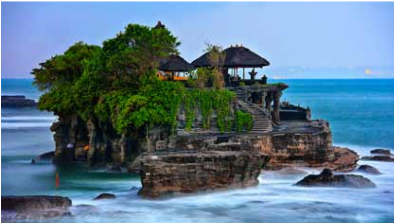
Gb. Pura Tanah Lot berposisi di tengah laut Merupakan salah satu warisan Saugana "Cultural Landscape" yang sangat indah dan menarik dan paling banyak dikunjungi wisatawan, baik lokal, nusantara, maupun mancanegara

Berbicara tentang pariwisata Bali tentu tidak dapat terlepas dari perkembangan pariwisata dunia. Pertumbuhan dan perkembangan pariwisata dunia sejalan dengan perkembangan ilmu pengetahuan dan teknologi Barat. Kemajuan ilmu pengetahuan dan teknologi dewasa