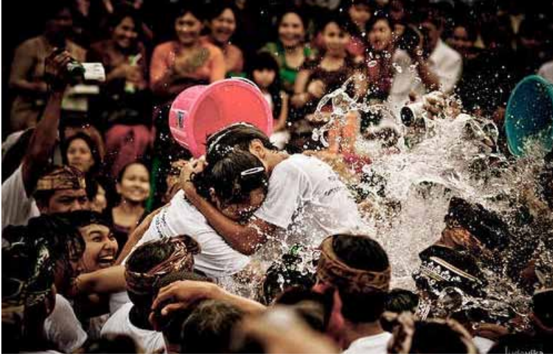
Gb. Tradisi Omed-omedan , di Sesetan. Denpasar Tradisi ini hanya dilaksanakan di Desa Sesetan, dan tidak ada di desa lainnya di Bali dan dilaksanakan setiap tahun sekali, tepatnya pada hari “Ngembak Geni” sehari setelah hari raya “Nyepi”