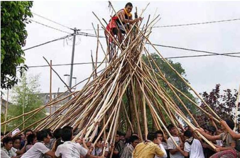
Gb. Tradisi Makotek , Hari Raya Kuningan, di Munggu-Badung Tradisi ini hanya ada di Desa Munggu- Badung dan tidak dimiliki desa lainnya di Bali. Dirayakan dalam rangka pembatalan serangan “Blambangan” terhadap “Mengwi” Kemudian raja Mengwi “Cokorda Nym Sakti” mengajak para prajurit bersenang-senang dengan melaksanakan upacara “Makotek” dan sampai saat sekarang masih ditradisikan Setiap Hari Raya Kuningan di Munggu-Badung