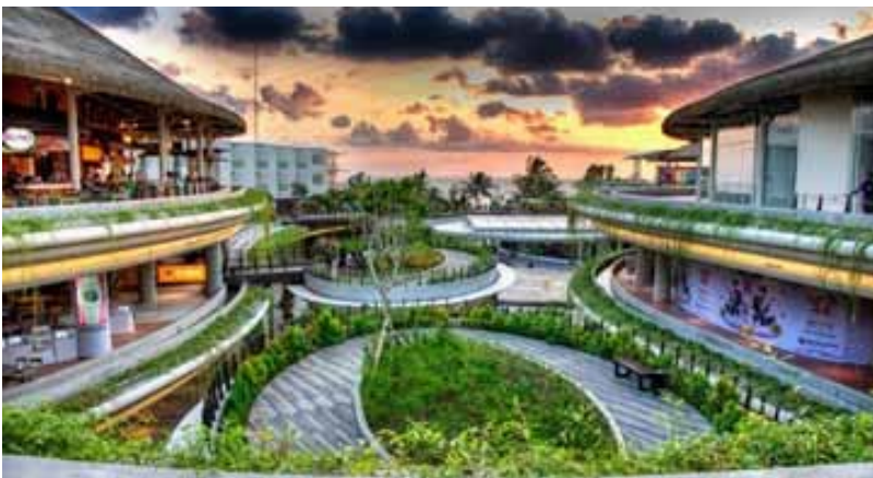
Beach Walk Shopping Mall Kuta