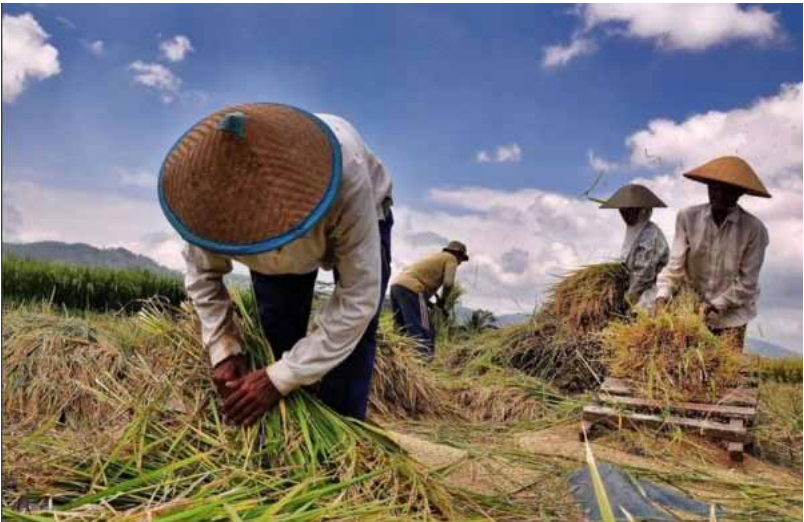
Gb. Kegiatan para petani memotong padi di sawah

Sebagai organisasi sosial keagamaan, subak memiliki otonomi untuk mengelola sawah dan ladang, sistem pola tanam, sistem irigasi, parhyangan , dan lain-lain tanpa