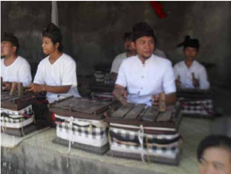
Gb. Para penabuh sedang memainkan Gambelan Sloding yang disakralkan masyarakat Bali