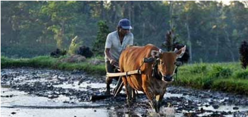
Gb. Petani sedang meratakan sawah menggunakan alat bajak tradisional “lampit” ditarik seekor sapi