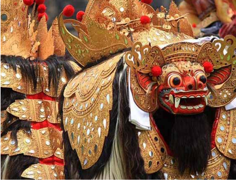
Gb. Tari Ngelawang Barong Ket disakralkan ada di seluruh kabupaten/kota di Bali

Selain bentuk-bentuk seni-budaya sakral seperti tersebut di atas ada juga bentuk-bentuk budaya tradisi yang unik yang masih hidup di Bali sebagai warisan masa lalu. Pewarisan tradisi sangat penting artinya dalam upaya menjaga kesinambungan tradisi tersebut. Tradisi berfungsi sebagai media untuk memelihara dan melestarikan unsur-unsur budaya lainnya. Seperti tradisi omed-omedan , Desa Sesetan, Kota Denpasar, misalnya. Sampai dengan saat sekarang tradisi ini masih tetap disakralkan. Dengan demikian pemanfaatannya diikat oleh ruang dan waktu. Artinya, omed-omedan hanya digelar setiap tahun sekali (waktu), tepatnya pada upacara ngembak geni , bertempat di Desa Sesetan (ruang). Tradisi ini khas (unik), karena hanya dilaksanakan di Desa Sesetan dan tidak di tempat lain. Sebagai tradisi warisan masa lalu patut dilestarikan karena