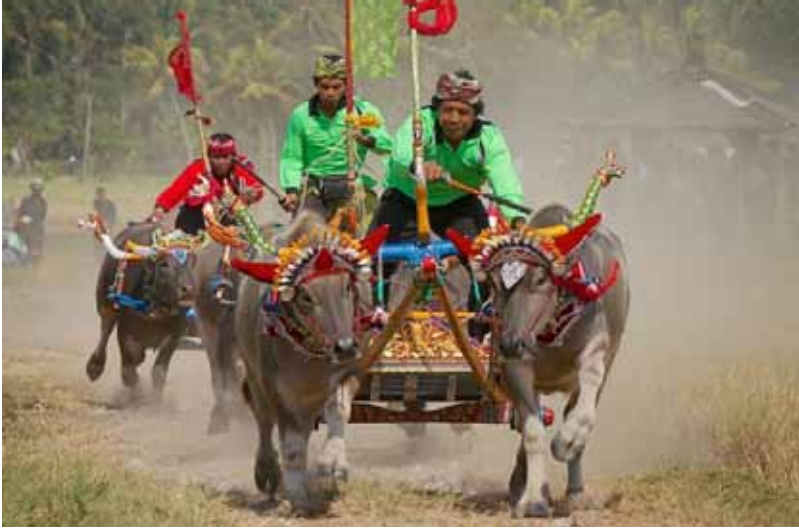
Gb. Tradisi Makepung , di Jembrana Merupakan khas adat dan tradisi di Jembrana kabupaten di ujung barat Pulau Bali