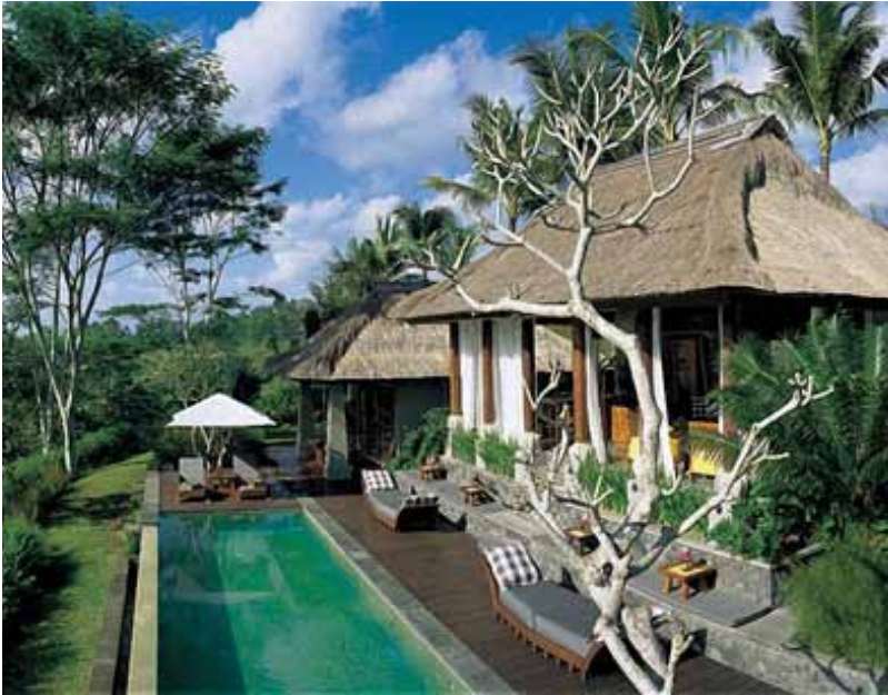
Maya Resort, Ubud

Ubud membuktikan bahwa ketertarikan para wisatawan asing terhadap nilai-nilai tradisional khususnya di bidang arsitektur lokal masih ada dan cukup banyak. Mereka berkunjung ke daerah Ubud untuk mencari suasana lokal yang masih terjaga kuat dengan didukung fasilitas-fasilitas lain sebagai penunjangnya. Keinginan untuk merasakan bagaimana tinggal atau menginap di pekarangan asli orang Bali, menjadikan homestay makin banyak peminatnya dan tidak kalah dibandingkan dengan resort , villa , dan hotel di sekitarnya. Oleh sebab itu, kebanyakan resort , hotel, dan villa di Ubud, lebih banyak mengadaptasi unsur-unsur lokal tradisional Bali dalam perwujudan arsitekturnya.