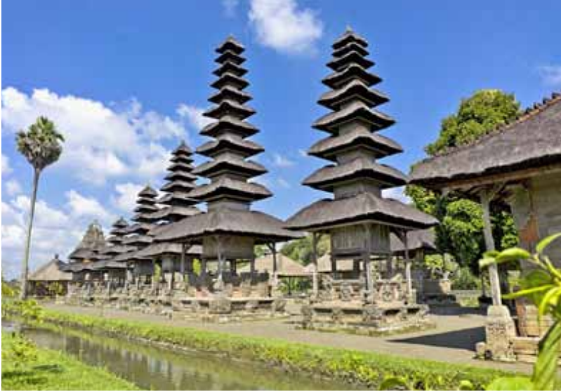
Gb. Pura Taman Ayun, Mengwi-Badung

Yang menarik, selain bangunan meru (atap tumpang) juga karena pura dibangun di tengah-tengah kolam yang luas dan indah dikomodifikasi sebagai daya tarik wisata dan ramai dikunjungi wisatawan “Sejak 29 Juni 2012 ditetapkan sebagai warisan budaya dunia oleh UNESCO”