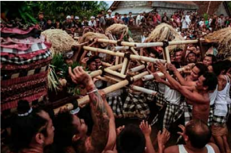
Gb. Tradisi Dewa Mesraman , Klungkung Tradisi Dewa Masraman, Pura Panti Timbrah, Desa Paksewali ketika upacara piodalan yang dilaksanakan pada Hari Raya Kuningan Tradisi ini mengingatkan adanya hubungan Ida Bhatara/Bhatari antara Desa Timbrah, Karangasem dengah Paksewali, Klungkung