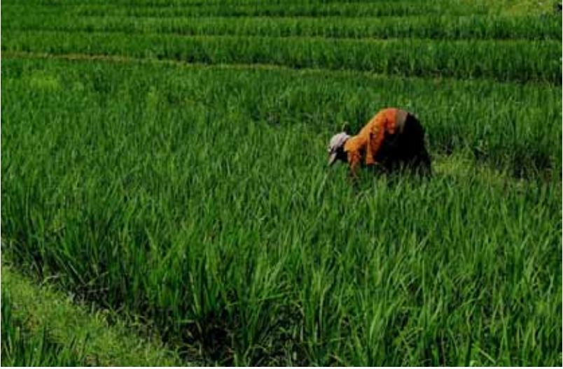
Gb. Petani sedang membersihkan rumput, biyah-biyah , sumanggi dll yang merusak tanaman padi Ini adalah kegiatan terakhir, selanjutnya petani menunggu padinya menguning dan siap untuk dipanen