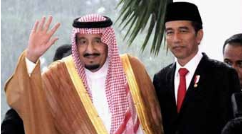
Gb. Raja Salman Arab Saudi berpose Bersama Jokowi Presiden RI, Maret 2017