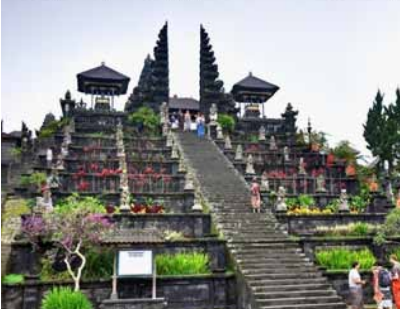
Gb. Pura Penataran Agung Besakih, Karangasem

Karena sesuatu dan lain hal, Dewa Agung Jambe (putra Dalem Di Made) memindahkan pusat kerajaan dari Gelgel ke Klungkung. Beliau merupakan raja pertama dari kerajaan Klungkung. Salah satu warisan terpenting dari masa kekuasaan Dewa Agung Jambe adalah bangunan Kertagosa. Di bawah ini adalah gambar salah satu bangunan di komplek Kerta Gosa, yaitu "Taman Gili", sebuah bangunan di dalam kolam yang melambangkan pemutaran Gunung Mandara di Ksirarnawa dalam upaya mencari amerta (air suci kehidupan).