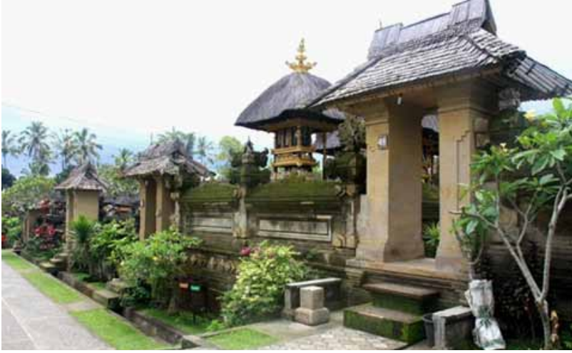
Model Angkul-Angkul di Desa Penglipuran, Bangli