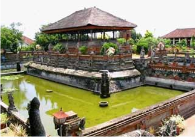
Gb. Taman Gili, Kerta Gosa, Warisan Dewa Agung Jambe, Raja Klungkung