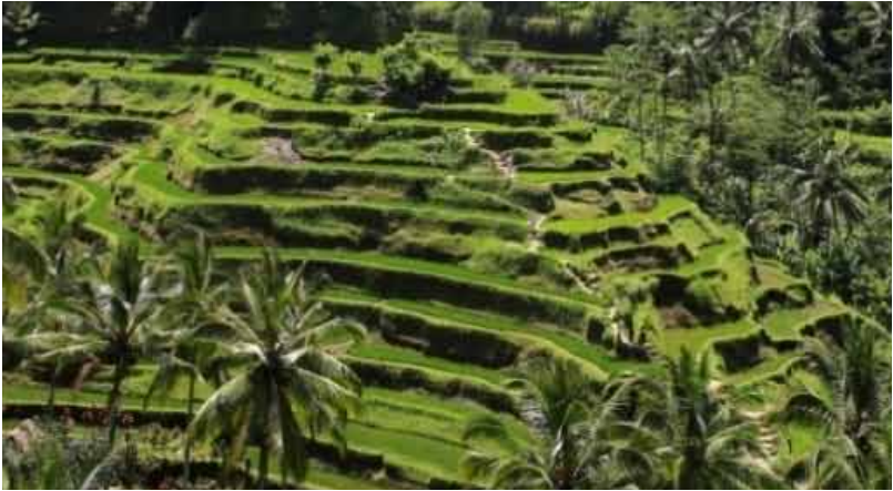
GB. Teras Ceking, Tegallang Gianyar Saat ini sedang dikembangkan dan dipromosikan sebagai daya tarik wisata

(Gianyar), Teras Ceking (Tegallalang-Gianyar), Tukad Ayung (Payangan-Gianyar); Tirta Taman Mumbul (Sangeh-Badung); Desa Wisata (Pinge-Tabanan); dan masih ada lagi yang lainnya. Berikut beberapa gambar daya tarik wisata yang masih dalam pengembangan.