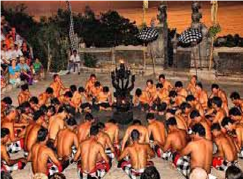
Gb. Tari Cak di Stage Uluwatu Sebuah Kesenian Klasik, Saat ini biasa dipagelarkan untuk wisatawan di stage-stage, seperti : di Batubulan, Ubud, Uluwatu, hotel berbitang di Nusa Dua' dan di beberapa tempat lainnya