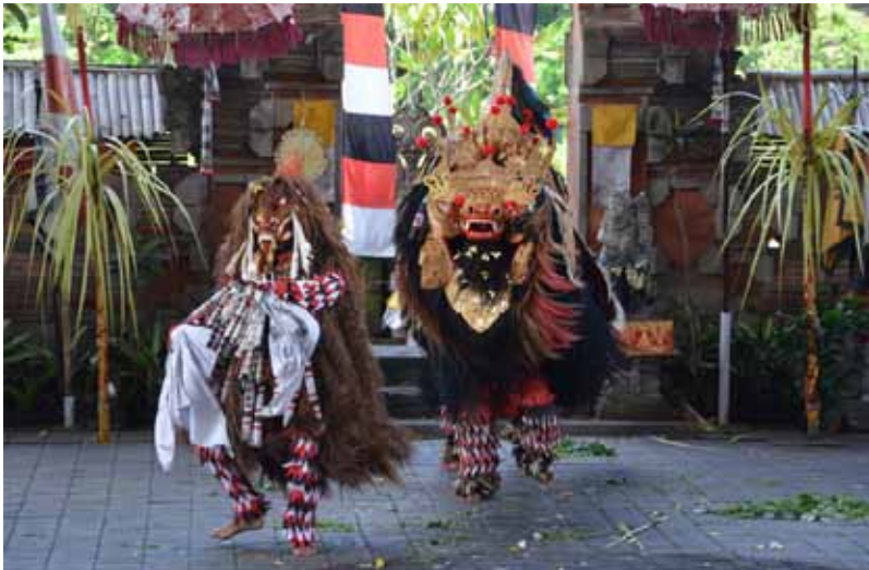
Gb. Pertunjukan Barong dan Rangda di sebuah stage di Batubulan-Sukawati-Gianyar

Seni pertunjukan hanya dapat disaksikan ketika divisualisasikan (dipagelarkan). Persebaran seni pertunjukan (tari dan tabuh) merata di seluruh kabupaten/ kota di Bali dengan beragam bentuk, jenis, dan fungsinya. Pesta Kesenian Bali (PKB) merupakan salah satu parameter yang paling tepat untuk mengukur keberadaan berbagai macam bentuk, jenis, dan fungsi kesenian Bali. PKB yang digelar setiap tahun dan saat ini (2017) telah memasuki usia yang ke-39. Berbagai kegiatan seni budaya dipagelarkan dan jumlahnya tidak kurang dari 24 tangkai (cabang) seni yang berasal dari Sembilan (9) kabupaten/kota di Bali. Karya seni dipagelarkan dibatasi pada jenis-jenis kesenian yang bersifat profan (hiburan) berupa kesenian tradisi, kesenian kreasi, dan seni kolaborasi. Secara kuantitatif, bahwa lebih dari 250 jenis kesenian yang ditampilkan selama sebulan (Juni/ Juli) baik dalam bentuk pawai, lomba, parade, maupun pagelaran (Raka, 2016).