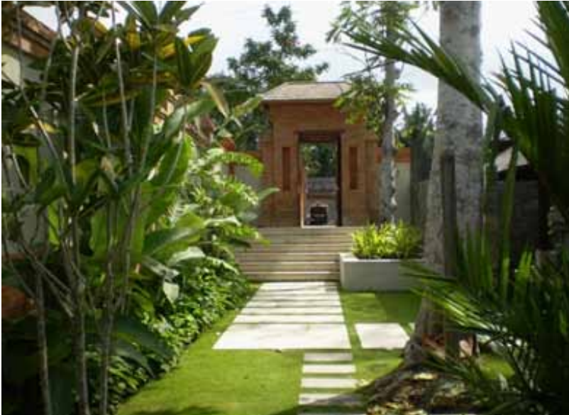
Angkul-angkul Bali Villa Cangu

Selain angkul-angkul aplikasi penerapan konsep atap juga digunakan para arsitek untuk mengangkat ciri khas arsitektur Bali, seperti atap jineng . Bangunan jineng yang