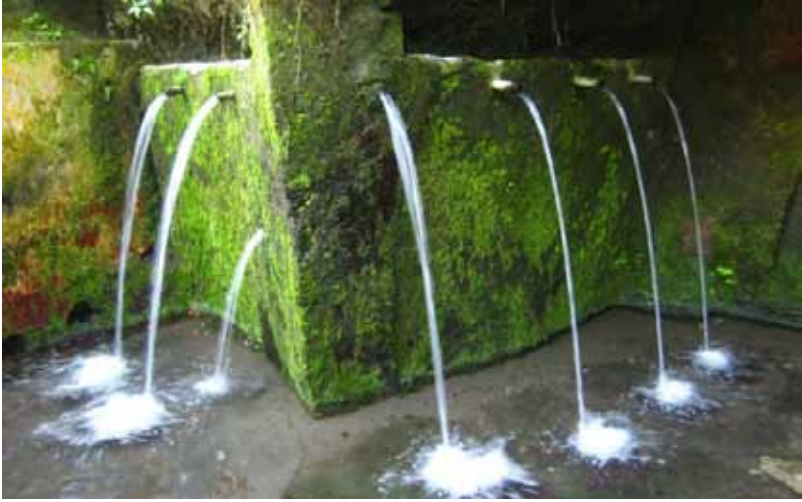
Gb. Pacuran dekat air terjun Tegenungan, Kemenuh, Gianyar