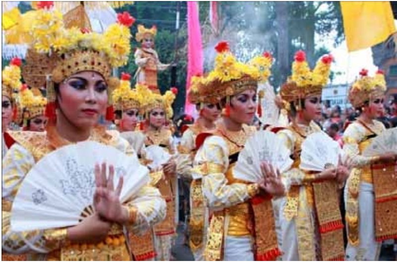
Gb. Tarian Sakral “Sanghyang Dedari”