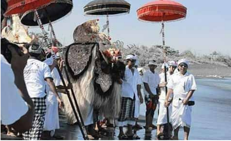
Gb. Prosesi Upacara Keagamaan “ Melis ” di Segara (Pinggir Pantai) Untuk penyucian pratima (manifestasi Tuhan dalam wujud Barong Ket)