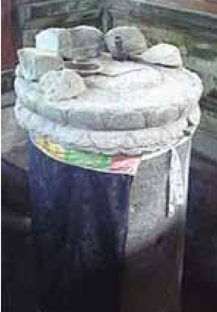
Gb. Prasasti Blanjong Sanur, bukti Bali memasuki zaman sejarahnya