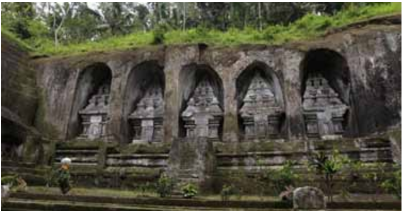
Gb. Candi Tebing Gunung Kawi, Warisan Budaya Arsitektur Zaman Anak Wungsu. Sejak 29 Juni 2012 ditetapkan sebagai warisan budaya dunia oleh UNESCO di Saint Petersburg, Rusia.