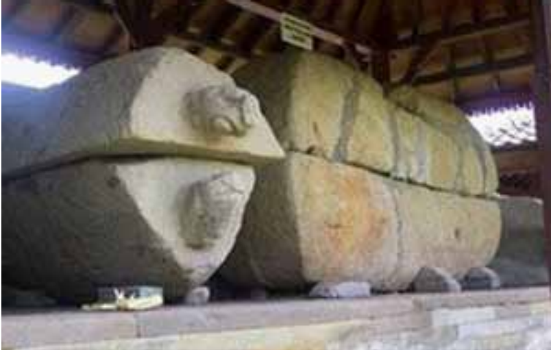
Gb. Sarkofagus Warisan “Zaman Megalitik”

Selanjutnya warisan dari zaman logam (perunggu) yang terunik adalah nekara “Bulan Pejeng”, yang kini dijadikan ikon daya tarik wisata. Dari periode pembuatannya, nekara “Bulan Pejeng” adalah hasil karya budaya dari jaman perunggu atau disebut juga jaman perundagian. Disebut masa perundagian karena pada saat itu telah tampil para undagi atau mereka yang memiliki kemahiran khusus sebagai undagi pembuatan berbagai benda-benda dari perunggu yang teristimewa adalah nekara. Sebagai salah satu produk budaya unggulan yang dijadikan primadona daya tarik wisata memiliki keunikan-keunikan, yaitu; memiliki ukuran besar, termasuk salah satu nekara terbesar di Asia Tenggara (Kempers, 1960: 64); tipe lokal (tipe Pejeng) yaitu tipe yang tidak dimiliki oleh nekara- nekara lainnya di nusantara (Bintarti, 1985: 86). Dari segi bentuknya, nekara Pejeng memiliki tinggi 1,98 m lebih besar jika dibandingkan dengan lebarnya. Bidang pukul yang bergaris tengah 1.60 menjorong 25 cm ke luar dari bagian bahu lurus ke bawah dan melengkung ke dalam di bagian