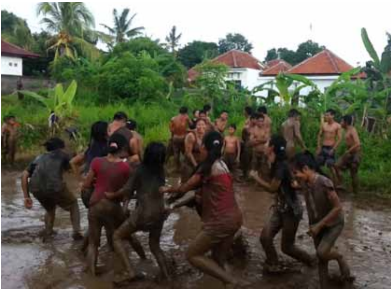
Gb. Tradisi megoak-goakan , di Buleleng Tradisi ini hanya ada di Buleleng, terkait dengan kepemimpinan raja “Panji Sakti”