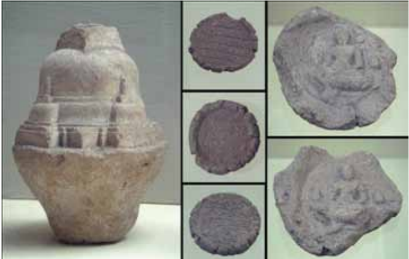
Gb. Stupika-Stupika Tanah Liat, Yang Ditemukan Di Desa Pejeng Bukti awal masuknya pengaruh Agama Budha di Bali

pengaruh budaya dan agama Hindu dari India, baik secara langsung maupun tidak langsung.