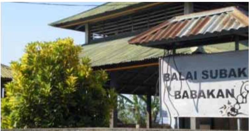
Gb. Balai Subak yang dimanfaatkan oleh warga subak untuk berapat dan berkumpul membicarakan berbagai hal terkait tugas, kewajiban, dan hak mereka sebagai warga subak

Selain sebagai tempat persembahyang seluruh masyarakat Hindu di Bali, selanjutnya dengan dibangunnya Museum Subak, Masceti dipromosikan sebagai daya tarik wisata bahari (pantai), spiritual, dan museum dengan berbagai informasi tentang tatacara upacara keagamaan, sistem pola tanam, dan berbagai peralatan para petani, seperti: tenggala, singkal, pengigi, lampit, kaun lampit, pemelasaan, uga, sambet, camok, pecut, caluk, penampad , dan lain-lain.