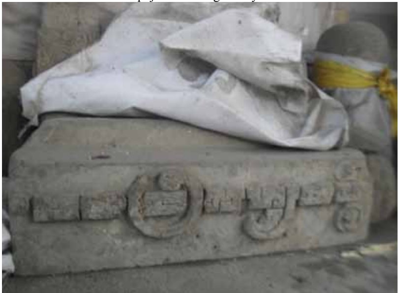
Gb. Prasasti Dengan Huruf Kediri Kwadrat “Parad Sang Hyang Warana” di Pura Penataran Sasih Pejeng Abad 11/12 Masehi