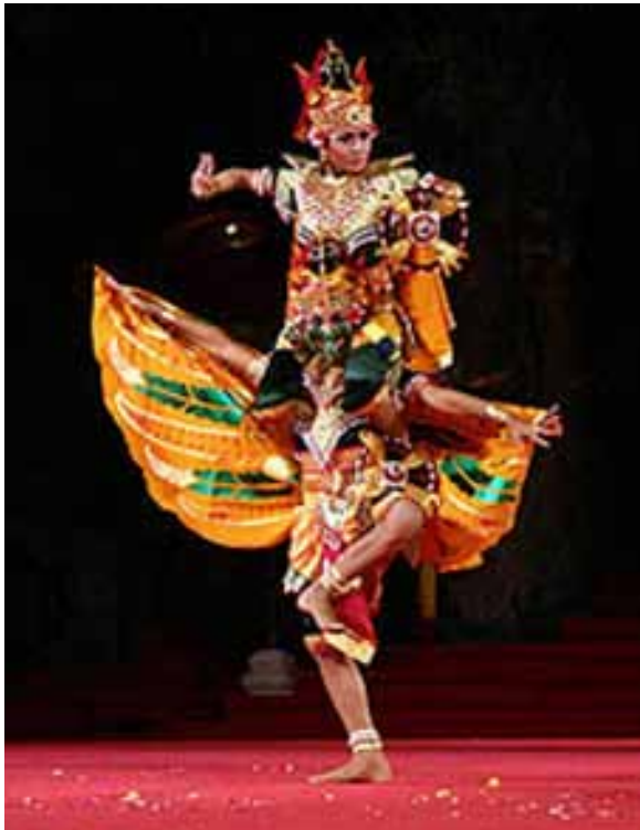
Gb. Tari Garuda Wisnu, Karya I Nyoman Cerita, Tahun 1997