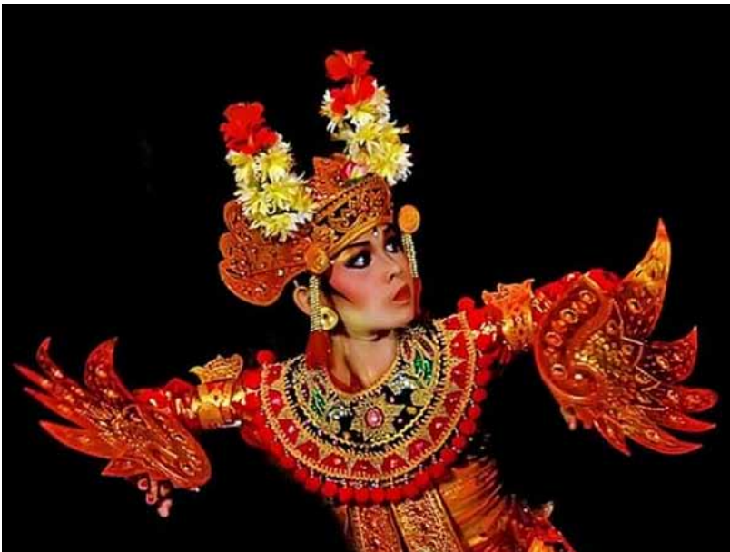
Gb. Tri Legong Keraton

Tari Topeng ini biasanya dipentaskan di tempat suci (pura) ketika upacara dewa yadnya atau yadnya lainnya ( manusa yadnya , Pitra yadnya , resi yadnya , dan buta yadnya ) pada bagian awal Topeng Wali “Dalem Sidha Karya.” “Saat ini Tari Topeng Tua sering dipagelarkan sebagai hiburan untuk wisatawan”