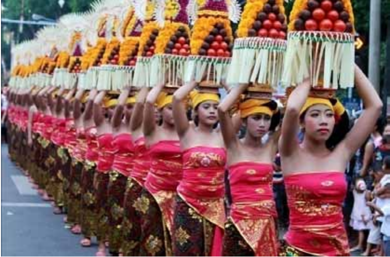
Gb. Tradisi Mapeed di Kabupaten Gianyar

satu pihak setiap kabupaten/kota memiliki unsur-unsur tradisi yang berbeda, tetapi di lain pihak ada pula kesamaan unsur tradisi untuk seluruh kabupaten/kota di Bali.