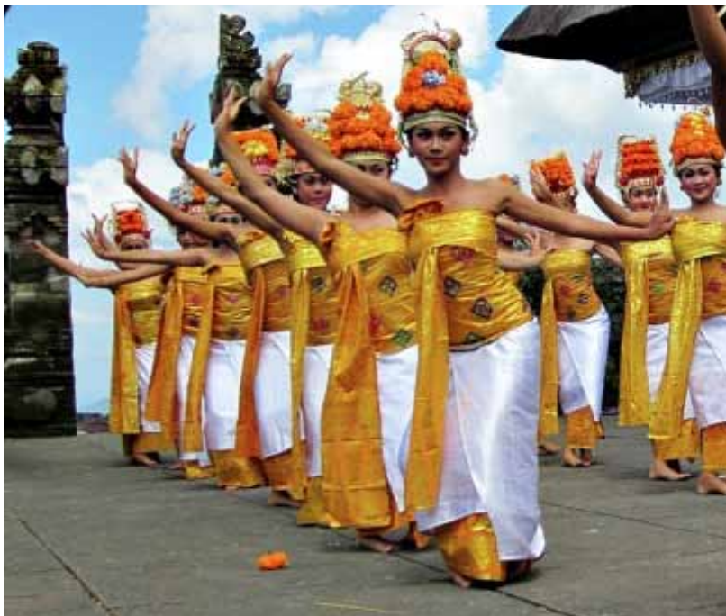
Gb. Tari Rejang Dewa, dipagelarkan ketika upacara dewa yadnya “ piodalan ” di kahyangan jagat , kahyangan tiga , dan upacara dewa yadnya lainnya