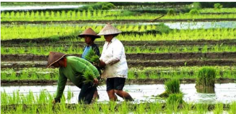
Gb. Para Petani sedang menanam benih padi “bulih”