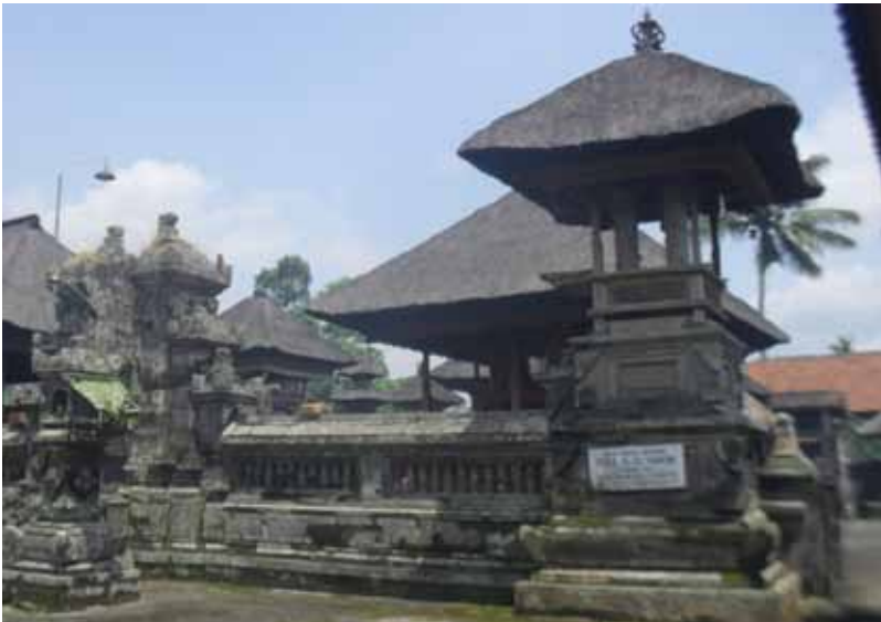
Gb. Pura Ulun Suwi, Desa Pejeng Kawan, Tampaksiring, Gianyar

bergantung pada desa adat/ pakraman . Artinya, subak tidak berada di bawah pengawasan dan tanggung jawab desa adat/ pakraman . Bila dilihat dari aspek tri hita karana (THK), subak memiliki palemahan , pawongan , dan parhyangannya sendiri. Palemahan adalah areal persawahan dan ladang; pawongan adalah warga subak; dan parhyangan adalah tempat suci (pura), seperti: Pura Bedugul, Pura Melanting, Pura Ulun Suwi, Pura Masceti, dan lain-lain yang berhubungan dengan subak, seperti: Pura Ulun Danu Batur dan Pura Sakenan. Secara organisasi, subak tidak memiliki kahyangan tiga (Pura Desa, Pura Puseh, dan Pura Dalem), dan secara individu tentu setiap warga subak memiliki kahyangan tiga di desa adat/ pakraman mereka masing-masing. Dikatakan demikian, karena asal desa adat/ pakraman dari anggota subak antara satu dengan yang lainnya belum tentu sama. Tidak tertutup kemungkinan bahwa dalam satu organisasi subak keanggotaannya berasal dari dua atau lebih warga desa adat/ pakraman dan masih dalam lingkungan satu kecamatan, bahkan berbeda kecamatan.