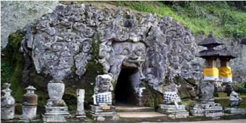
Gb. Goa Gajah, Warisan Budaya Arsitektur Zaman Udayana Warmadewa Di Bali.

lahir termuda dan saat ini sebagai universitas terbesar di Bali, yaitu “Universitas Warmadewa”, menggunakan nama dinasti yang menurunkan raja-raja mulia dan masyur yang memimpin Bali selama 4 abad (X-XIV Masehi). Setelah Udayana ada tiga belas raja-raja yang memimpin Bali, yaitu: Marakatta, Anak Wungsu, Walaprabu, Sakalendu Kirana, Suradipa, Jaya Sakti, Ragajaya, Jayapangus, Ekajaya Lancana, Batara Guru 1, Parameswara, Batara Guru 2, dan terakhir Astasura Ratna Bhumi Banten.