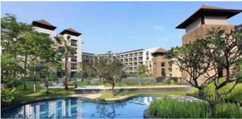
Pullman Hotel di Kuta

Di sepanjang jalur pantai Kuta, tampak bangunan-bangunan dengan gaya arsitektur yang tidak sepenuhnya mengungkap arsitektur lokal. Sebagai solusinya, mereka berupaya menambahkan beberapa tampilan berupa material dan ornament yang dimodifikasi, dengan menjadikan arsitektur lokal sebagai covernya . Walaupun ada beberapa di antaranya yang tidak sepenuhnya dapat mempertahankan arsitektur lokal, tetapi pandangan selintas masih ada kecenderungan nilai kearifan lokalnya.