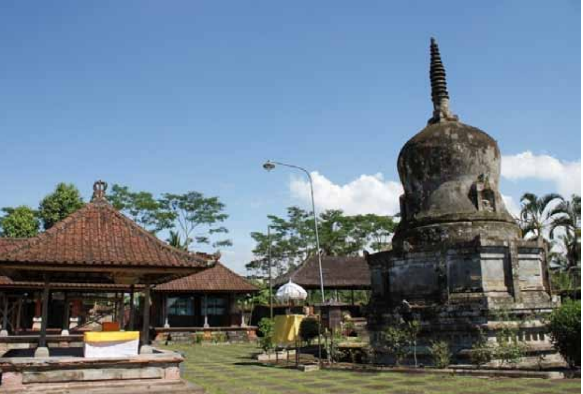
Gb. Stupa Di Pura Pegulingan, Tampaksiring Sejak 29 Juni 2012 ditetapkan sebagai warisan budaya dunia oleh UNESCO di Saint Petersburg, Rusia

Bertolak dari paparan di depan, jelaslah bahwa pengaruh Hindu (India) yang membuka lembaran sejarah Bali. Dua agama yang sudah berkembang di Bali ketika itu adalah Agama Siwa (Hindu) dan Budha. Bentuk-bentuk karya seni yang berasal dari masa tersebut adalah seni arca dan seni bangunan. Semua warisan tersebut menunjukkan bahwa DAS Pakerisan dan Petanu dan desa-desa yang berada di antara kedua aliran sungai tersebut menjadi pusat peradaban Bali. Keberadaan warisan dari dua agama yang berbeda dalam satu situs dan/atau pada situs yang berdekatan, menunjukkan bahwa kerukunan kehidupan beragama sudah dibangun saat itu. Artinya, hubungan harmonis antar umat beragama yang berbeda di Bali sudah dipraktikkan jauh sebelum Empu Tantular menulis kakawin Sutasoma, yang intinya memuat tentang ketunggalan Siwa