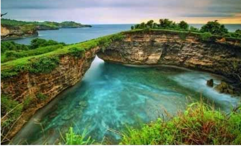
Gb. Keindahan alam Pasih Uwug "Broken Beach" di Nusa Penida Kabupaten Klungkung