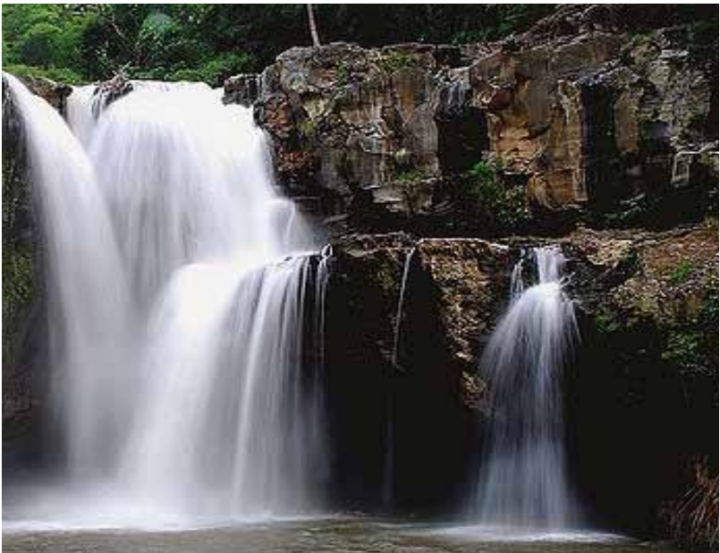
Gb. Air terjun Tegenungan, Kemenuh, Gianyar Sedang dikembangkan sebagai daya tarik wisata