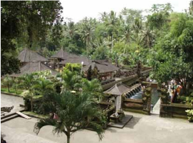
GB. Pura Tirta Empul, Tampaksiring, Gianyar Dikomodifikasi Sebagai Daya Tarik Wisata yang ramai dikunjungi wisatawan. “Sejak 29 Jni 2012 ditetapkan sebagai warisan budaya dunia oleh UNESCO”

apapun. Selanjutnya profanisasi, artinya sesuatu yang sakral (keramat) menjadi profan (biasa). Dijadikannya pura sebagai daya tarik wisata, menyebabkan pura tidak hanya sebagai tempat persembahyangan bagi para pemujanya, tetapi juga sebagai tempat kunjungan wisatawan. Hal tersebut menyebabkan keberadaan pura tidak hanya dijadikan sebagai tempat persembahyangan, tetapi juga dapat berfungsi umum (profan). Dikatakan demikian, karena para wisatawan dibolehkan masuk areal tempat suci yang seharusnya dilarang, serta hanya boleh masuk untuk tujuan sembahyang, guna melihat keunikan yang ada di dalamnya. Pura (tempat suci) yang saat ini sudah dikomodifikasi sebagai daya tarik wisata, yaitu: Pura Tirta Empul, Pura Uluwatu, Pura Taman Ayun, dan masih banyak yang lainnya, dan sudah tentu yang memiliki keunikan.