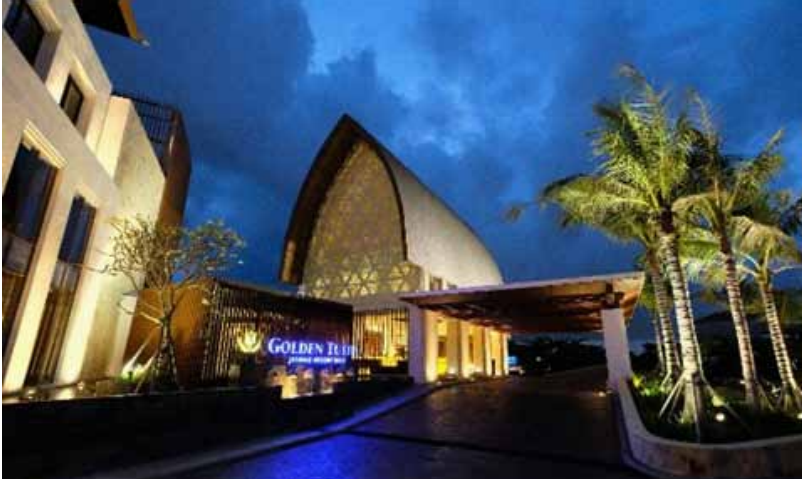
Golden Tulip Jineng Resort, Kuta

menjadi sebuah pelengkap pada rumah tradisional Bali biasanya digunakan sebagai lumbung penyimpanan hasil pertanian padi. Aplikasi atap jineng juga banyak diterapkan pada salah satu hotel besar di Kuta, yaitu Golden Tulip Jineng Resort Kuta.