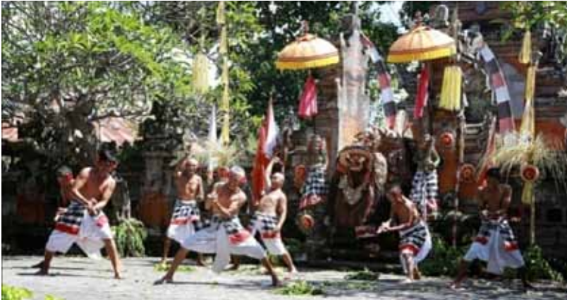
Gb. Seni Pertunjukan Barong dan Keris di Batubulan, Gianyar