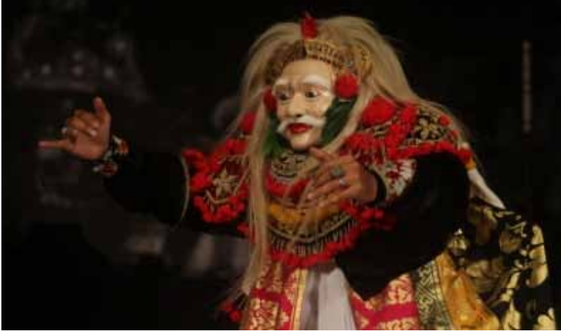
Gb. Tari Topeng Tua

Tari Topeng ini biasanya dipentaskan di tempat suci (pura) ketika upacara dewa yadnya atau yadnya lainnya ( manusa yadnya , Pitra yadnya , resi yadnya , dan buta yadnya ) pada bagian awal Topeng Wali “Dalem Sidha Karya.” “Saat ini Tari Topeng Tua sering dipagelarkan sebagai hiburan untuk wisatawan”