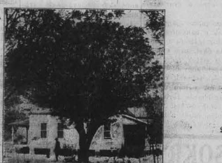
Itt látható az általunk kínált farmok egyike

HETVENŐT FARMUNK VAN, ezek egy részén van lakóház is, nyarhelyek, aludtatók, ha mindet elvagy szeretné megvásárolni, egyenként biztosított. Kétségtelen, hogy mindezen farmok nagyon rövid idő alatt el lesznek adva s így az előbb jelentkezők lesznek abban a szerencsés helyzetben, hogy több földet vásárolhatnak. Kérje ismerető magyar farmerokat, melyben minden szükséges felvilágosítást megtalál és melyet készséggel küldünk meg Önnek.