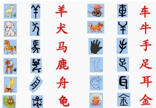
图 2. 主要象形字示例