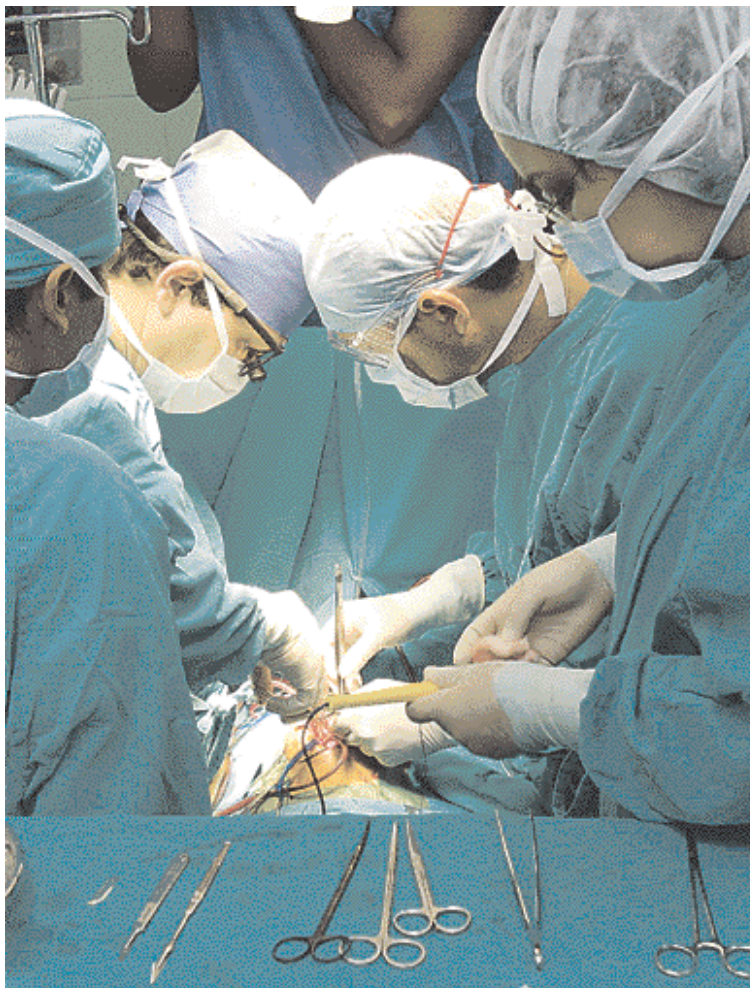
• Acto médico en operación del corazón.