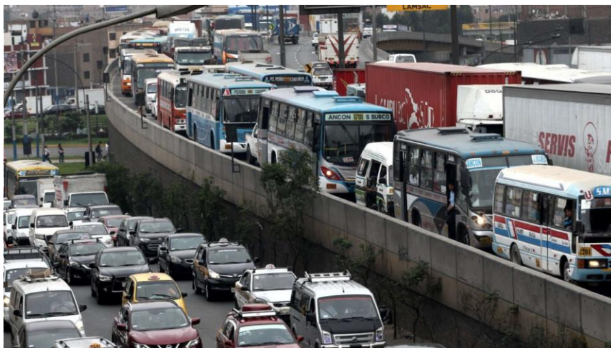
Tráfico en Lima.

El agravamiento de la congestión vehicular es fruto del continuo crecimiento del parque automotor de la capital, de la falta de inversión en proyectos de infraestructura vial y de transporte masivo de personas. Según la información de la Superintendencia Nacional de los Registros Públicos, se puede observar que la carga vehicular de Lima y Callao se ha incrementado con el paso del tiempo, principalmente entre los años 2016 y 2017. Como se puede observar en el gráfico presentado a continuación, el incremento fue del 35 %.