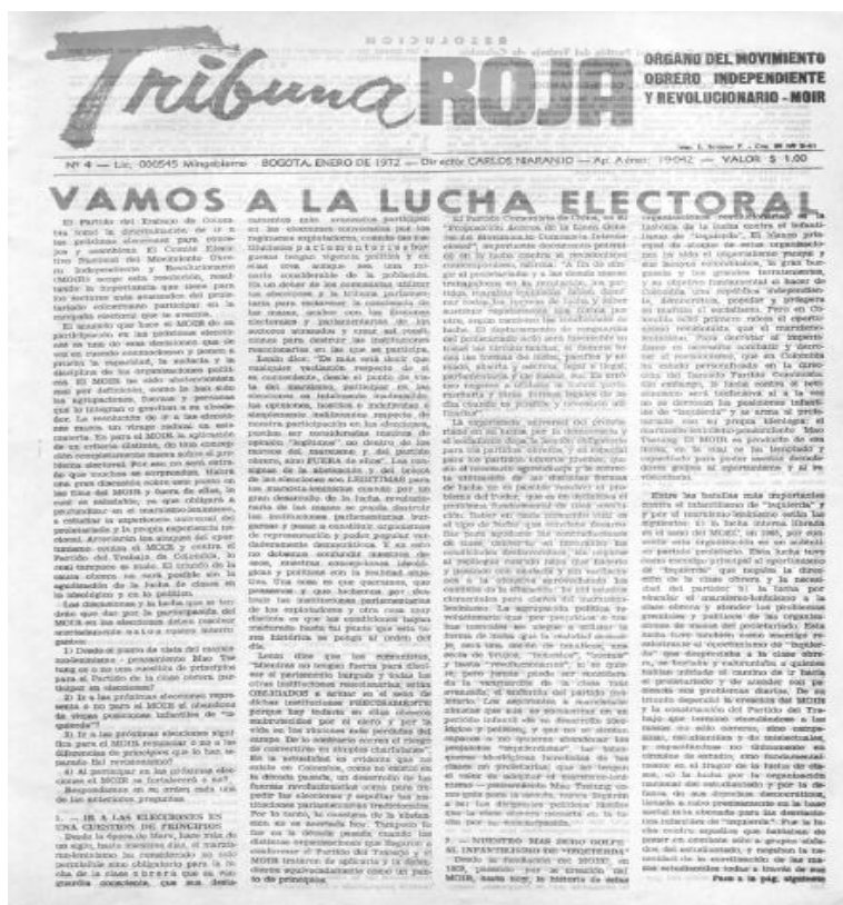
Imagen N° 4: ejemplar del periódico del MOIR, Tribuna Roja , con propósito de la primera campaña electoral.

La participación electoral de la UNO marcó un profundo cambio en la Izquierda colombiana iniciando un proceso de autocrítica sobre la lucha armada y el abstencionismo. La construcción de la plataforma antiimperialista representó un acuerdo claro que se enfocó en organizar un frente amplio de lucha por la liberación nacional y la conquista de la plena democracia. La UNO se convirtió en un importante proceso de unidad revolucionaria en el país por presentar una candidatura unificada a la presidencia de diferentes sectores de la izquierda, un hecho histórico que permite desentrañar elementos de análisis de la izquierda en Colombia.