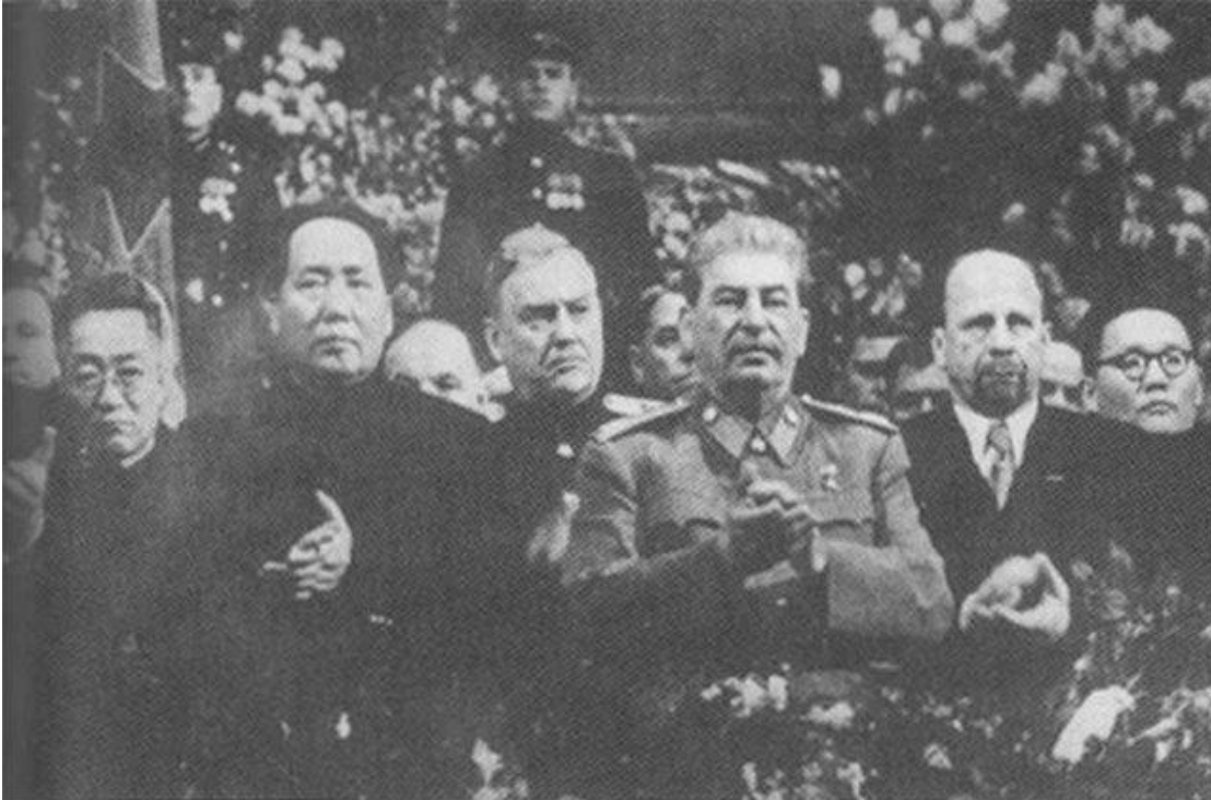
Ilustración N° 2: Mao Tse Tung en el cumpleaños número 70 de Stalin, celebración en Moscú, diciembre de 1949.