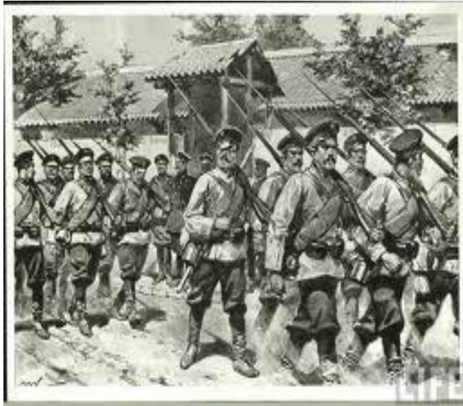
Ilustración N° 1: Guerra ruso-japonesa de 1904-1905.