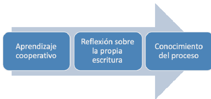
Fig. 2. Técnicas y estrategias para favorecer la escritura en ELE

Para concluir ofrecemos una propuesta didáctica para realizar en el aula de ELE, en concreto en el nivel B2. Basada en un enfoque de escritura procesual toma como punto de partida un posible centro de interés compartido y un espacio de encuentro intercultural como son los deportes. Asimismo, se sustenta en el conocimiento y creación de un tipo textual específico: la crónica deportiva. Por último, aprovecha las técnicas y estrategias para favorecer la escritura en ELE que especificábamos en el apartado anterior. Esto es: