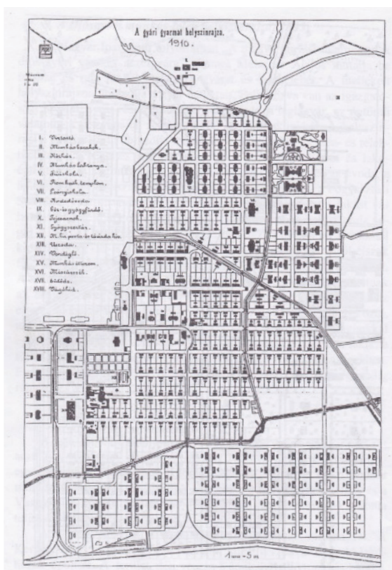
2. ábra: A gyári gyarmat helyszínrajza, 1910. (Forrás: Olajos, 1998. 36.)

1770-ben Mária Terézia vasgyár létrehozását rendelte el az akkor még fennálló diósgyőri koronauradalom területén. 4 Bő egy évszázaddal később, a fellendülő vasúti építkezések nagyobb kapacitású és modernebb üzemet igényeltek. Mivel 1858-ban jelentős szénkészletet tártak fel a területen, Lónyay Menyhért pénzügyminiszter 1867-ben megbízást adott az észak-erdélyi Terebesfejérpatakon működő vasgyár igazgatójának, Glanzer Miksának, hogy egy új, korábbi állomáshelyéhez hasonló létesítmény tervezetét dolgozza ki. Az építkezések nem korlátozódtak az ipari komplexum kialakítására, kezdettől fogva szerepelt a tervek között a hivatalnokok, felügyelők és munkások részére lakóépületek felépítése is. A hetvenes években utóbbi társadalmi csoport nem élvezett prioritást, mondván Diósgyőr és Miskolc településeken találnak maguknak lakást, ám rövid idő elteltével munkáslakások százai kerültek felépítésre a gyár közvetlen közelében, hiszen a fokozatos kapacitásbővítés miatt egyre több embert tudott alkalmazni a vállalat.