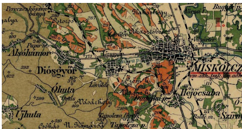
1. ábra: Diósgyőr nagyközség és környéke, 1906.