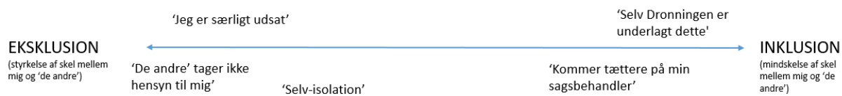
Figur 3: Følelsen af eksklusion versus inklusion.