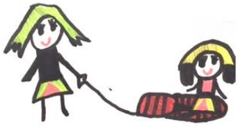
Kuva 3. Lapsen tuottama piirros ystävistä unelmakoulussa.

Ulkotilojen yhteydessä puhuttujen luonnoneläinten lisäksi lapset toivoivat unelmakoulusta löytyvän myös lemmikkieläimiä. Lasten puheenvuoroista oli kuultavissa, että eläimet olisivat koulun toiminnassa vahvasti mukana, mutta myös omat lemmikkieläimet mainittiin. Koirat, kissat sekä puput haluttiin mukaan oppitunneille. Tämä oli selkeästi aihe, joka sai lapset osallistumaan yhteiseen keskusteluun.