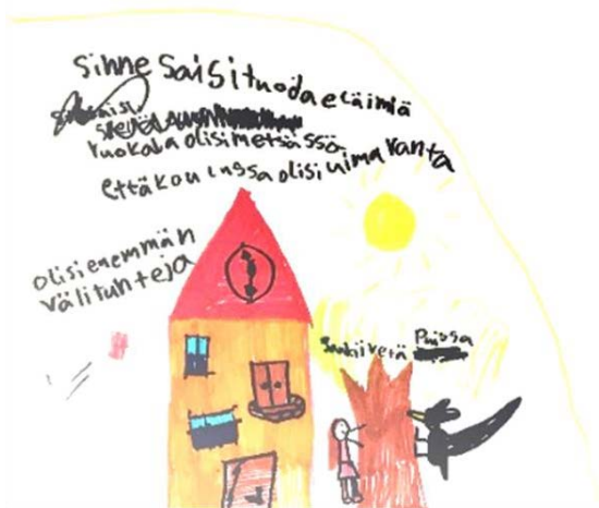
Kuva 2. Lapsen tuottama piirros unelmakoulusta.

Ulkotiloja kuvailtaessa luonnonläheisyys ja luonnon merkitys olivat lasten tuottamissa piirroksissa (ks. kuva 2) sekä haastatteluissa vahvasti läsnä, sillä lapset nostivat esiin toiveita erilaisista kiipeilypuista ja niihin liittyvistä seikkailuradoista, uimarannoista, metsästä sekä luonnon eläimistä. Tutkimukset, jotka koskevat lasten luontosuhdetta, nostavat lähes aina esiin puut yhtenä luonnon elementtinä, mutta niitä ei ole nostettu erityisemmin esiin tutkimuksen kohteena (Laaksoharju & Rappe, 2017, s. 150). Laaksoharju ja Rappe (2017, s. 154–156) nostivat tutkimuksessaan puut erityisen tarkastelun alle ja tutkivat 7–12 -vuotiaiden lasten suhdetta erityisesti puihin. Tutkimuksessa lasten suhde puihin nähtiin merkityksellisenä sekä materian että tilan näkökulmasta.