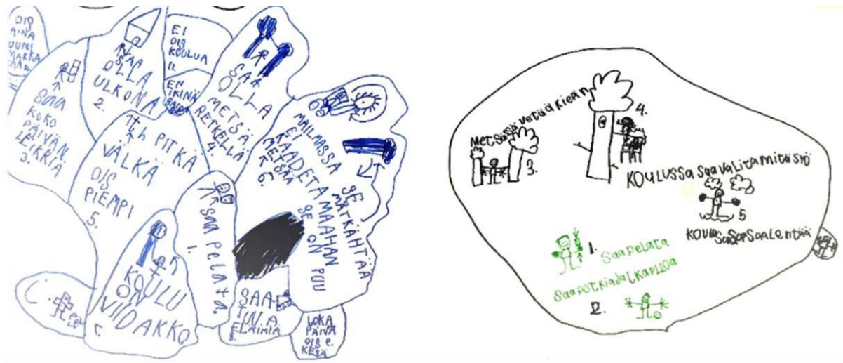
Kuva 4. Lasten tuottamia piirroksia unelmakoulusta.

Koulun sääntöihin ja järjestyksiin liittyvät kuvaukset nousivat vahvasti esiin myös Kiviojan ja Puroilan (2017, s. 47–48) tutkimuksessa. Oppilaiden kouluarki näyttäytyi rakentuvan hyvin pitkälti sääntöjen ja sovittujen toimintatapojen muodostamista raameista käsin, ja sitä rytmittävät siirtymiset oppituntien ja välituntien välillä. Tutkimuksessa opettajia ja muita koulun aikuisia kuvattiin auktoriteetteina, joiden osalta vuorovaikutus on lyhytsanaista ja käskävä sävy on puheelle ominaista. Koulun säännöt eivät myöskään yllä koskemaan opettajia ja muita aikuisia. Tässä tutkimuksessa sääntöihin pohjautuvat kertomukset olivat luonteeltaan kriittisiä, eikä koulun sääntöjä kuvattu juurikaan positiivisessa valossa.