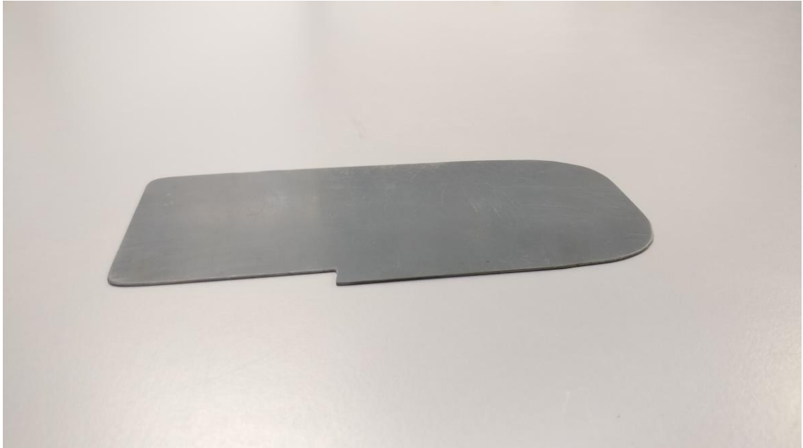
Kuva 2. Alkuperäinen kaavin.