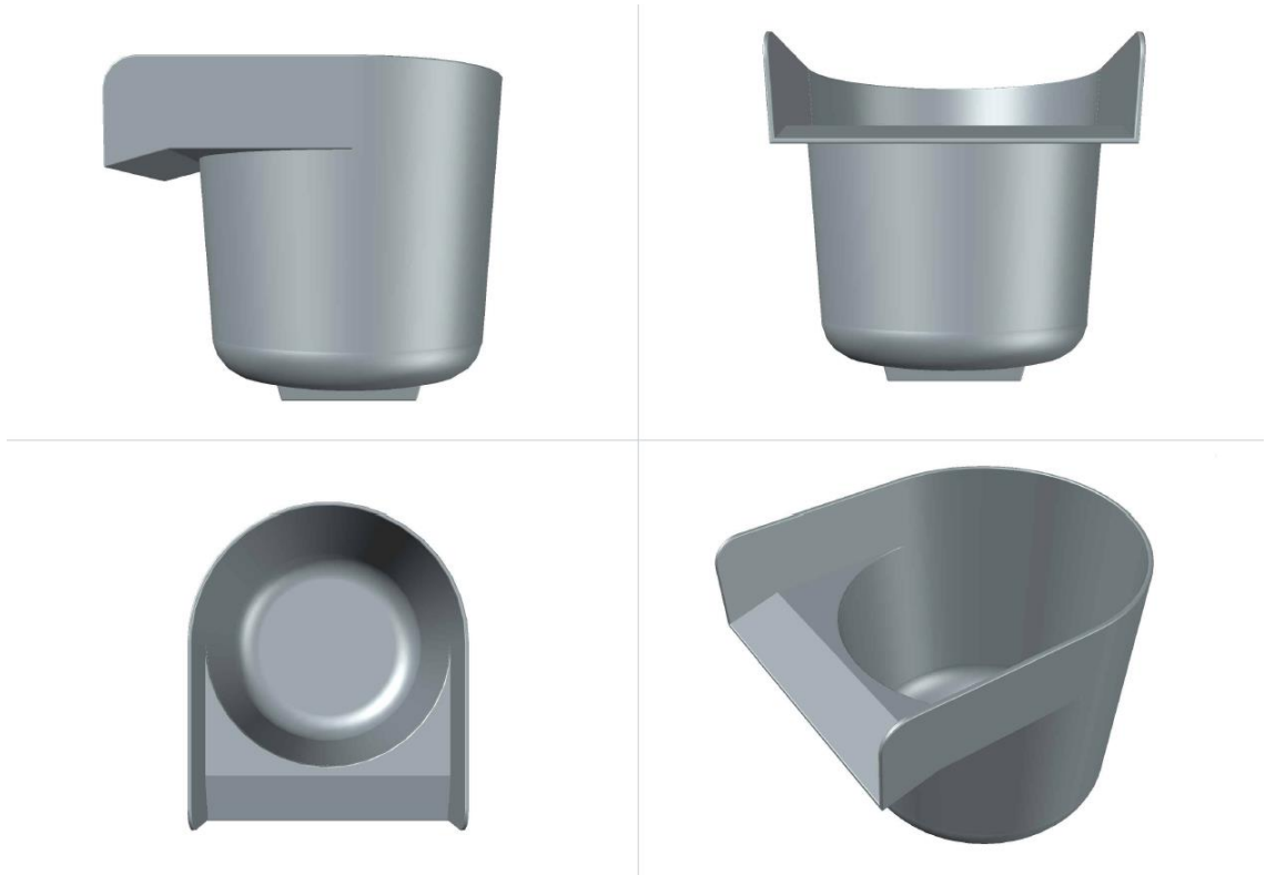
Kuva 3. CAD:llä piirretty malli uudesta vaahdotusastiasta.

pois. Astia ja nokka on yhdistetty toisiinsa ja pienen nurkkien pyöristämisen jälkeen malli on valmis. Kappaleessa 3.1 mainitut muutokset on tehty uuteen astiaan (Kuva 3).