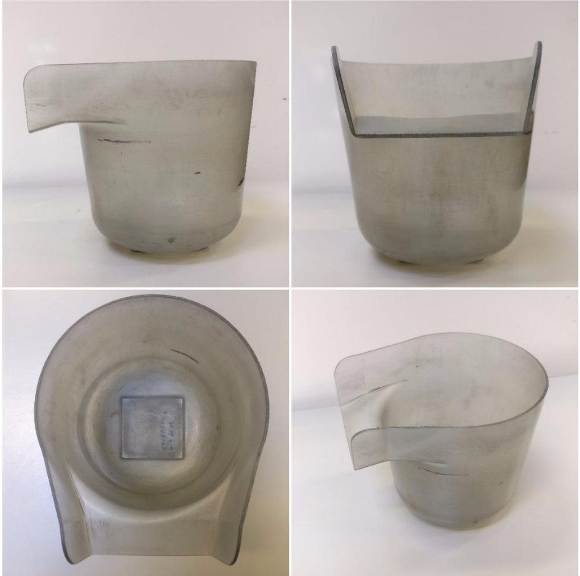
Kuva 1. Alkuperäinen astia.