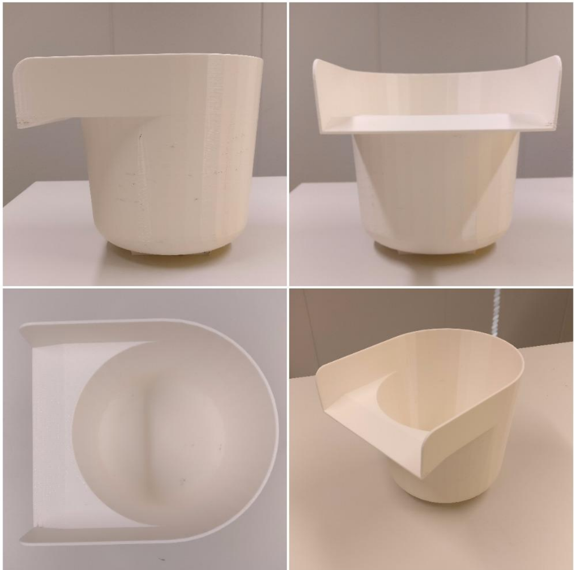
Kuva 5. Uusi 3D-tulostettu vaahdotusastia

Valmis tulostettu vaahdotusastia näkyy kuvassa 5. Tulostimen tekemä jälki oli tarpeeksi hyvä. Pieniä epätarkkuuksia laadussa oli useissa kohdissa astian pinnoilla, mutta epätarkkuudet olivat niin pieniä, etteivät ne tule haittaamaan käytössä. Jos epätarkkuudessa sisäpuolella haittaavat, ne voi tulevaisuudessa hioa pois. Vaahdotusastian lisäksi kaapimen tulostus onnistui halutulla tavalla. Tulostetuilla kappaleille ei tarvinnut suorittaa suunniteltua asetonikäsittelyä pinnan laadun parantamiseksi.