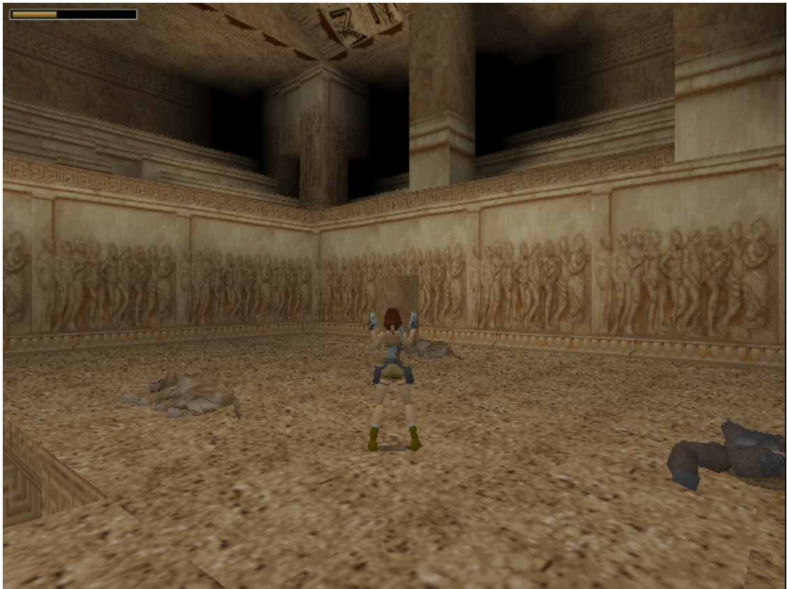
Kuva 3. Tomb Raiderissa (1996) pelaajan tappamien vihollisten ruumiit jäävät näkyviin niille paikoille, joihin ne ovat kuolleet. Tämä helpottaa navigointia joskus hyvinkin sokkeloisissa kentissä, kun pelaaja tunnistaa heti ruumiit nähdessään käyneensä tässä paikassa aiemminkin.

Pelattavuuden kannalta toisin kuin Tomb Raider (1996), Anniversary rikkoo myös periaatetta siitä, että pelaajaa ei tulisi rangaista toistamiseen samasta virheestä (heuristiikka I: A2). Anniversaryssä tärkeä taisteluliike on useamman näppäinyhdistelmän liike adrenaline dodge , jonka pelaaja voi suorittaa ainoastaan tietyssä kohdassa taistelua pienen aikaikkunan aikana, jolloin vihollisen erillinen raivomittari on huipussaan. Liikettä on vaikea harjoitella, koska sen voi suorittaa vain erikoistilanteissa, jolloin pelaaja päätyy toisinaan onnistumaan ja toisinaan epäonnistumaan. Välillä voi kulua pitkiäkin aikoja, jolloin pelaaja ei kohtaa sopivia vihollisia, joiden parissa harjoitella liikettä. Pelin alkupäässä liike näyttäytyy vapaaehtoisena, jolloin pelaajan rangaistuksi kokemisen tunne liikkeen epäonnistumisesta ei tunnu vielä tärkeältä. Mitä pidemmälle peli etenee, sen kriittisemmäksi kyseinen liike kuitenkin muodostuu eikä pelaaja pysty enää voittamaan päävastustajia hallitsematta liikettä. Tämä voi pahimmillaan estää pelaajan etenemisen ja pelaaja voi kokea tulevansa toistuvasti rangaistuksi siitä, ettei hän hallitse monimutkaista liikettä.