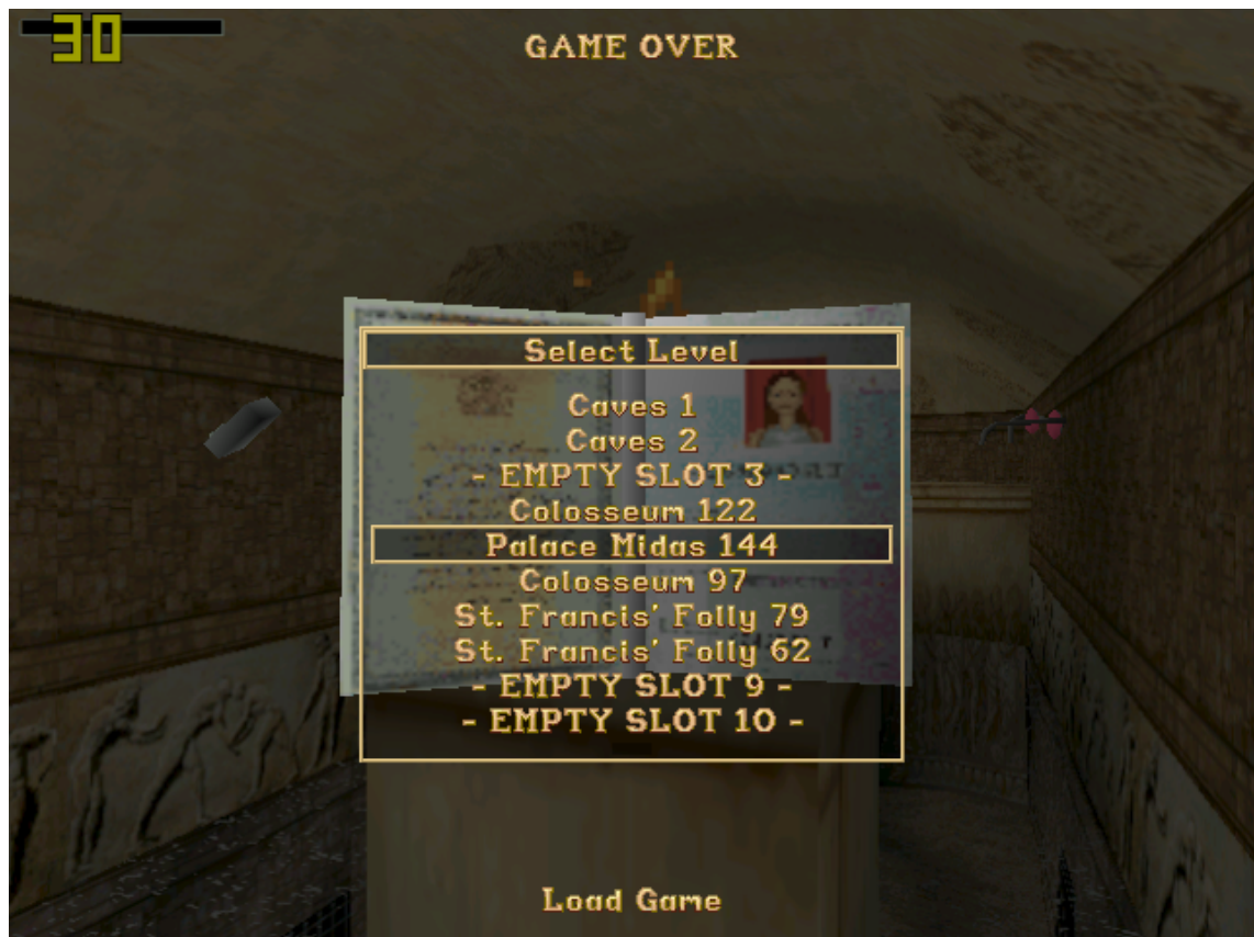
Kuva 2. Kun pelaaja kuolee Tomb Raider (1996) -pelissä, ilmestyy Game Over -näkymä. Pelin voi ladata vain, mikäli pelaaja on tallentanut pelinsä manuaalisesti. Pelitallennuksen pilaamisen välttämiseksi on suositeltavaa, että pelaaja muistaa tallentaa pelinsä usein ja eri tallennuspaikkoihin. Tämä ei ole käytettävyyden kannalta toimiva ratkaisu, sillä se kuormittaa pelaajan muistia eikä peli pyri välttämään pelaajan virheitä. (Vasemmassa yläreunassa oleva 30-numero ei kuulu pelin käyttöliittymään, vaan johtuu pelin ulkopuolisesta kuvakaappausohjelmasta, jolla näkymä on tallennettu.)