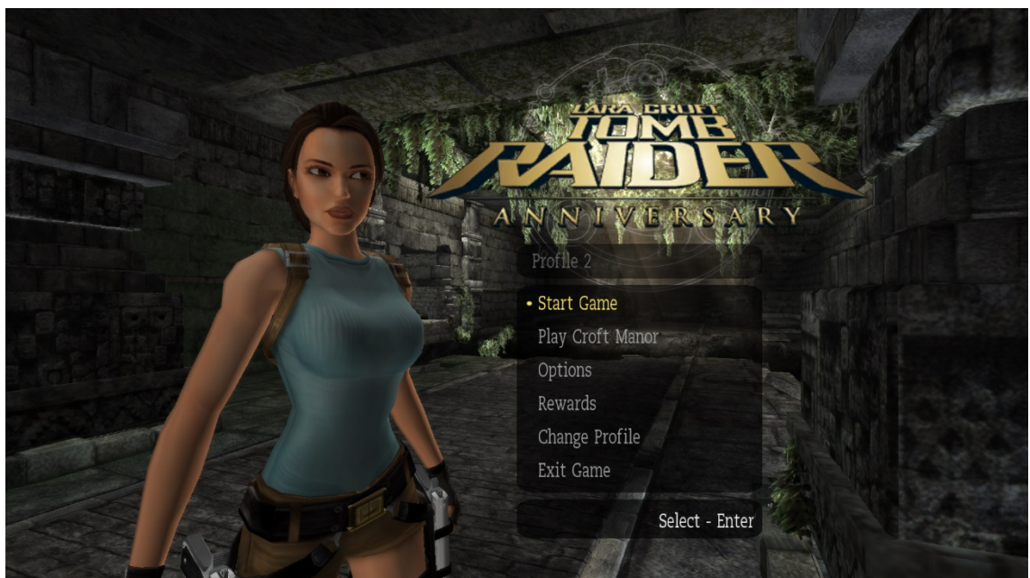
Kuva 5. Tomb Raider Anniversary (2007) -pelin aloitusvalikko. Valikkoa selataan ylhäältä alas nuolinäppäimillä. Mielenkiintoisena yksityiskohtana taustan ympäristö vaihtuu sen mukaan, missä pelin maailmankolkassa pelaaja on viimeksi tallentaessaan ollut (tässä tapauksessa tausta on Perun rauniokentistä).