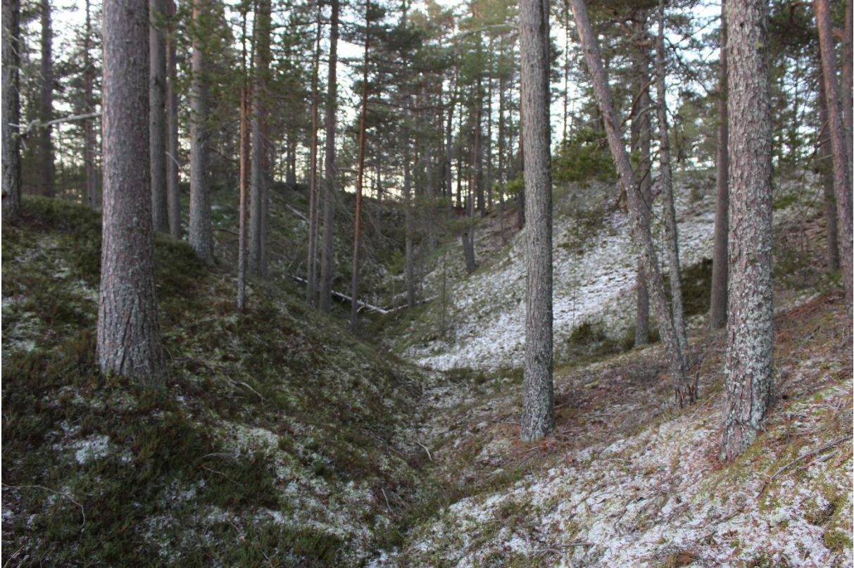
Kuva 2. Pakopirtinrotko on luonnonmuodostuma Hyypännäellä. Perimätiedon mukaan rotkossa on sijainnut isovihan aikana suomalaisten pakolaisten piilopirtti.