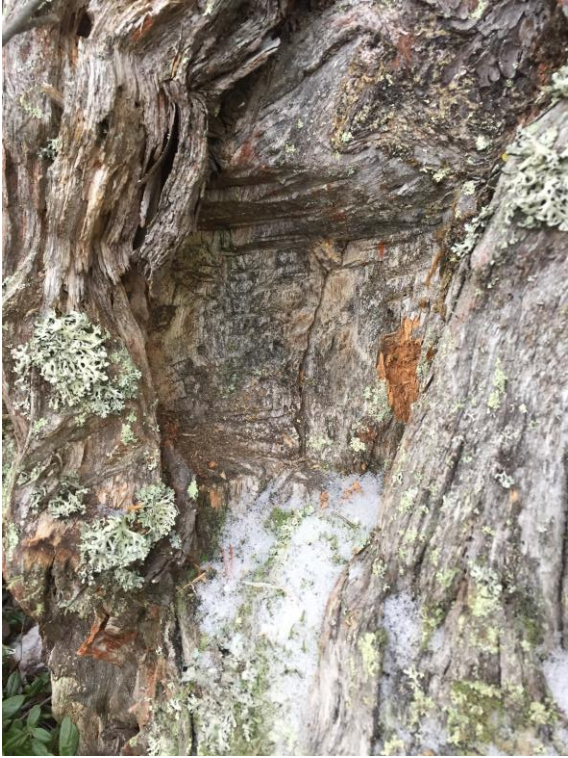
Kuva 6. Kummassakin sotamännysssä voi huomata teräaseella tehtyjä reikiä. Tarinoiden mukaan muun muassa Askelin sotamännystä on myöhemmin kaivettu tykinkuulia irti. Kuvassa Kestin sotamänty.