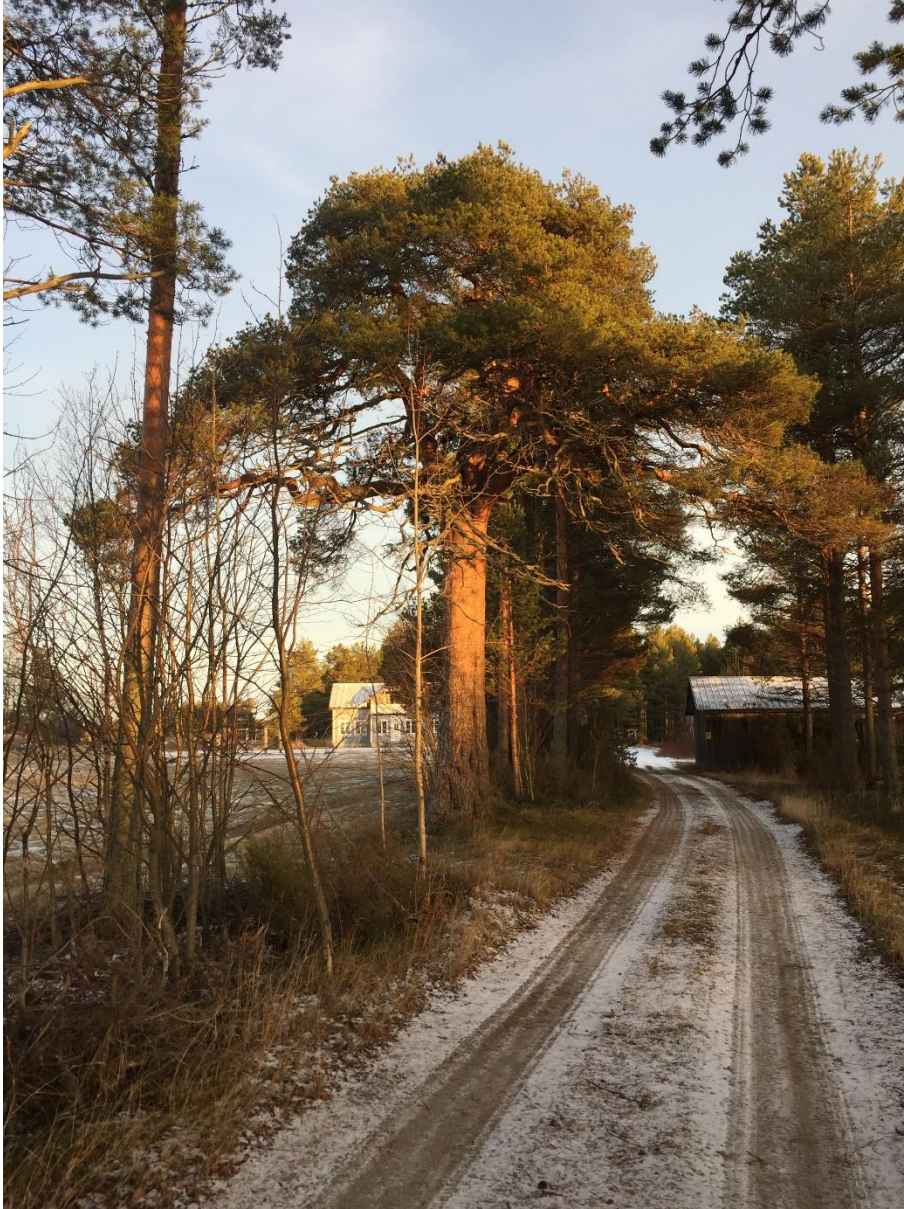
Kuva 4. Askelin sotamänty erottuu kokonsa ansiosta, vaikka ympäristö onkin metsittynyt huomattavasti viimeisen vuosisadan aikana. Mäntyä pidetään yleisimmin Suomen sodan aikaisena taistelupaikkana, mutta monissa kertomuksissa Askelin sotamänty liitetään myös pikkuvihan kahakkaan.