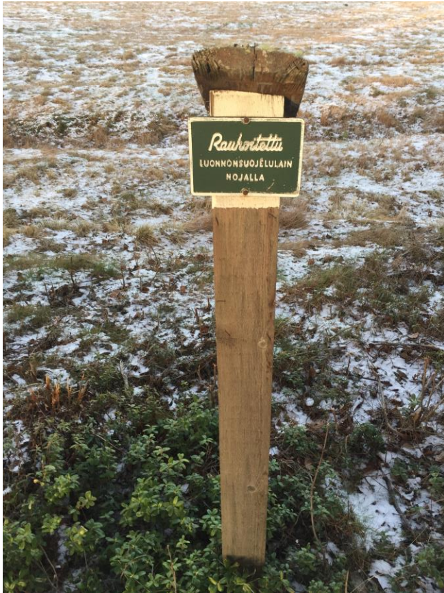
Kuva 5. Askelin sotamänty on rauhoitettu luonnonsuojelulain nojalla.