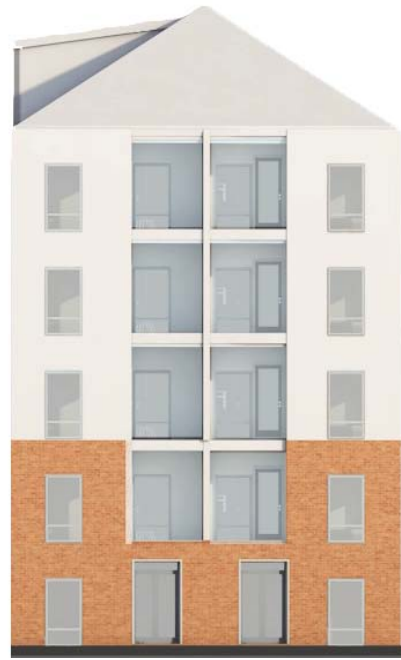
Julkisivu länteen mosaiikkitorilta, pihan toiminnot, leikkaus ja julkisivu etelään.