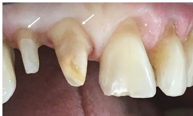
5. ábra | Paragingivalis vállal előkészített csontok fix pótláshoz

A MRONJ kialakulásának veszélye osteometabolicus indikáció esetén kisebb, mint onkológiai esetén [14], továbbá kevésbé súlyos a MRONJ manifesztációja, és a terápiára is jobban reagál, mint az onkológiai indikációval kezelt betegeknél [50]. Az elektív dentoalveolaris sebészeti beavatkozás ebben a csoportban nem ellenjavallt [22].