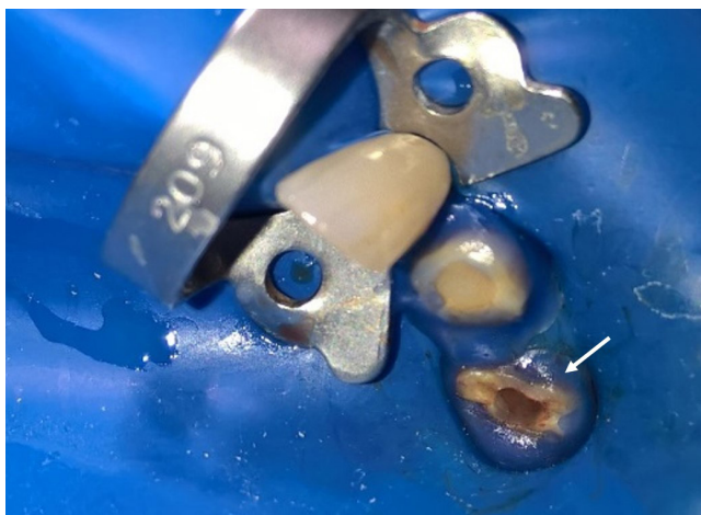
4. ábra | Preventív szemléletű, atraumatikus izolálás 24 fog (FDI jelölés szerint) endodontiai beavatkozása során

hogy a gingivát ne traumatizáljuk, ne helyezük rá a kapcsot (4. ábra). A traumatikus kapocsfelhelyezés a biológiai szélesség sérülését okozza, amely triggerre lehet a MRONJ kialakulásának [47]. A biszfoszfonátterápiában részesülők protetikai ellátásakor a következőket kell figyelembe venni: rögzített fogpótláshoz a fogakat supragingivalis vállal készítse elő a fogorvos, hogy a korona széle jól kontrollálható és tisztítható legyen (5. ábra). Kivehető fogpótlások esetében rendszeres ellenőrzéssel, szükség esetén korrekcióval kerülhető el a decubitus [22]. Manifeszt MRONJ-os páciensnél a mucosa terhelését csökkenthetjük kiegyensúlyozott okklúziós viszonyok kialakításával és az okklúzió és az artikuláció 3–4 havonkénti kontrolljával [48], valamint lehetőség szerint dentalis megtámasztású fogpótlással [49].