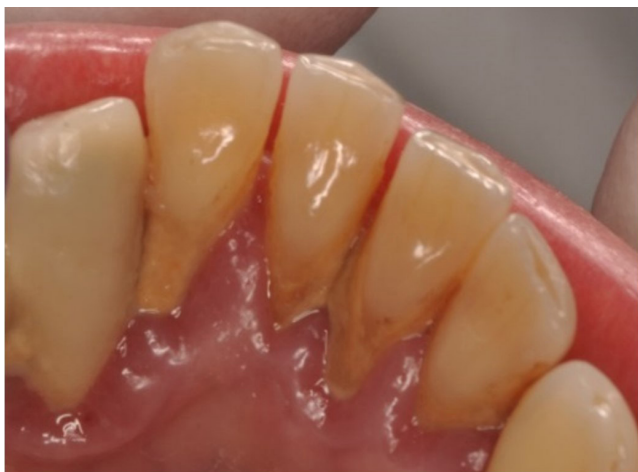
2. ábra | Magas rizikójú onkológiai beteg. A fogkés és a marginális parodontitis jelenléte növeli a MRONJ kialakulásának veszélyét MRONJ = gyógyszer által indukált állcsontnecrosis

sal összefüggésbe nem hozható (non-surgery related) MRONJ-esetek 2%-ában a kiváltó ok súlyos parodontitis volt. Számos esetbemutató és retrospektív vizsgálat valószínűsíti egy kezdődő endodontális eredetű gyulladás lehetséges szerepét [22, 30, 31]. Vescovi retrospektív vizsgálata szerint a 'non-surgery related' esetek 87,8%-ában nincs ismert kiváltó tényező [9], míg Marx és mtsai már 2005-ben leírták az endodontális gyulladások szerepét a MRONJ kialakulásában. A betegek 10,9%-ában periapicalis krónikus gyulladást diagnosztizáltak az osteonecrosist megelőzően [29].