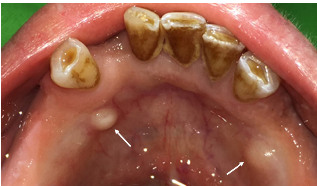
3. ábra | Kivehető fogpótlással rendelkezőknél lokális rizikófaktor az alsó állcsonton található torus mandibulae

A MRONJ kialakulásának szempontjából jelentőséggel bírnak bizonyos anatómiai képletek azoknál a pácienseknél, akik kivehető fogpótlással rendelkeznek: torus mandibulae, exostosis palati és torus palatinus [9, 11] (3. ábra). Prediszponáló tényező a processus alveolarison található kifejezett csonttarajok jelenléte. Ilyen anatómiai viszonyok mellett kivehető lemezes fogpótlás készítésekor fokozott gondossággal kell eljárni, hogy a későbbiekben a mechanikus irritációt ezekben az esetekben is elkerüljük [32]. A páciensek korábban készített,