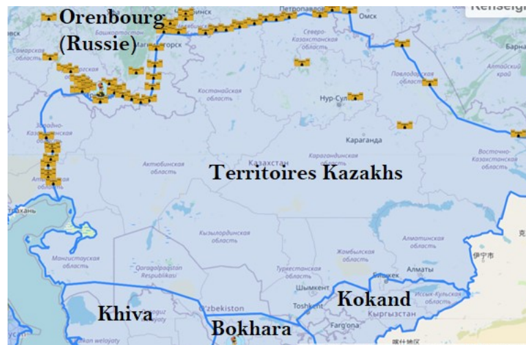
Figure 7 : Limites de l'Empire russe

et réussit à initier des pourparlers afin d'accroître l'influence russe. Cette manière de faire était cependant contradictoire à la diplomatie traditionnelle, en plus de confronter directement l'agent britannique Alexander Burnes 207 . Ce faisant, le ministre des Affaires Étrangères russe Nesselrode décida de le rappeler. En 1839, une expédition fut lancée contre Khiva afin de contrecarrer l'avancée britannique en Afghanistan la même année.