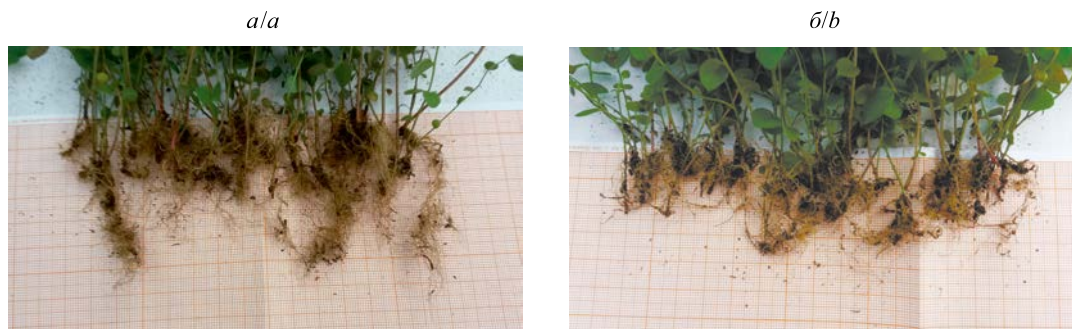
Рис. 3. Корневая система растений голубики высокой сорта Блюкроп после 65 дней культивирования ex vitro при светодиодном (а) и люминесцентном (б) освещении

и дальнем красном диапазонах, активируют сигнальные молекулы, влияющие на рост и развитие корней. Хорошо развитая корневая система является важной составляющей при доращивании растений сортовой голубики высокой после адаптации ex vitro , а также на следующем этапе – при пересадке в мультитраты или небольшие отдельные горшочки. Можно отметить, что за 65 дней культивирования ex vitro растения достигли той стадии развития и размеров, которые позволяют осуществить их пересадку в мультитраты, что и было сделано.