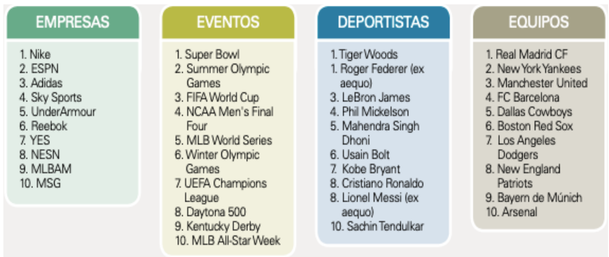
Figura 2. Las marcas deportivas más valiosas en 2013

Como se puede ver, el mercadeo deportivo es un campo amplio que abarca diferentes elementos, factores y fenómenos, entre ellos: las empresas, los eventos, los deportistas, los medios de comunicación y los equipos deportivos, etc., que hacen parte del universo de posibilidades que tienen las marcas para plantear estrategias de posicionamiento y generar, de esta forma, valor para las organizaciones. Por su parte, en la figura 2 se aprecia la clasificación de organizaciones que estaban vinculadas con el deporte en el año 2013.