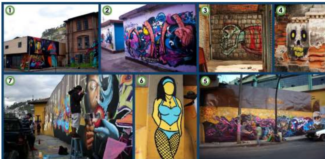
Figura 4. Intervenciones gráficas que fueron eliminadas poco después de haber terminado el festival: 1) murales de postgraffiti ubicados en la Escuela de Artes y Oficios; 2) graffitis ubicados en el frente nororiental del edificio central en la red de plataformas; 3) character de graffiti en la zona posterior de la mueblería; 4) character de graffiti en la zona posterior de la mueblería; 5) graffitis en la entrada norte; 6) pieza de postgraffiti ubicada en la entrada norte; 7) graffitis ubicadas en el cerramiento de la mueblería. Elaboración propia.

Auz (2019, entrevista personal), refiriéndose a la eliminación de este mural colaborativo, señala que: “La gente no estaba muy de acuerdo con el graffiti . Nosotros desde un inicio sabíamos que algo así iba a pasar, por eso destinamos las letras al frente del Mercado, junto al muro de Tenaz”. La concepción alrededor de ciertas gráficas como ‘aportes a la ciudad’ o ‘agentes de revitalización urbana’ se justifica desde la oposición: regenerativo-degenerativo. Es decir, la valoración a la funcionalidad de ciertas gráficas está atravesada por la posibilidad del entendimiento de su contenido. Bajo la premisa de que el postgraffiti y las versiones más artísticas del graffiti son fenómenos gráficos dinámicos que reinventan los espacios en los que se desarrollan y que, por lo tanto, son capaces de producir la regeneración del paisaje urbano, se establece una oposición que halla en las gráficas que no buscan el entendimiento colectivo o que se producen al margen de la autorización de rigor, acciones degenerativas y desencadenantes de males mayores.