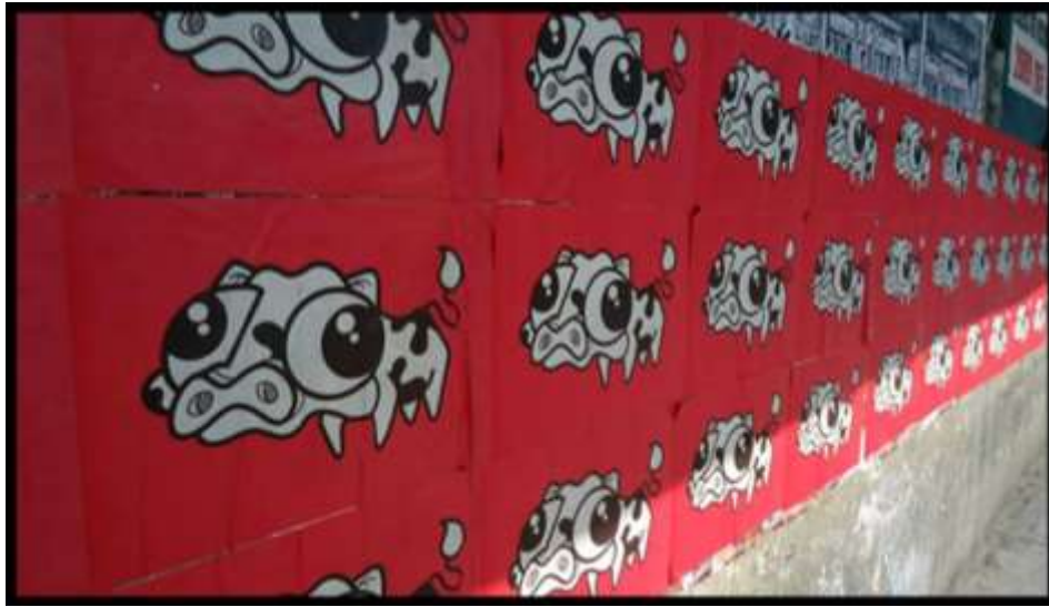
Posters y fotografías de Eme Ese Vaca.