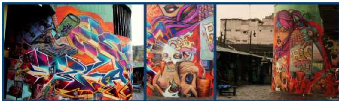
Figura 3. Producción colectiva de graffiti y postgraffiti eliminada del interior del Mercado. Elaboración propia.

La misma suerte corrió la producción 109 en la que se asociaron Toofly, Artkasmio, Coxmorama y Ralex al interior del Mercado (ver figura 3). El collage resultante no gustó a los usuarios cotidianos del tramo en el que se emplazaron las gráficas; no se sintieron representados, vinculados o beneficiados de alguna manera con la producción gráfica desarrollada en su zona, especialmente con las piezas de graffiti , por lo que optaron por su eliminación pocos días después de terminado el festival. En los dos casos el descontento entre los comerciantes se debió en gran medida, aunque no fue la única razón, a la imposibilidad de entender el dédalo colorido (ver figura 4).