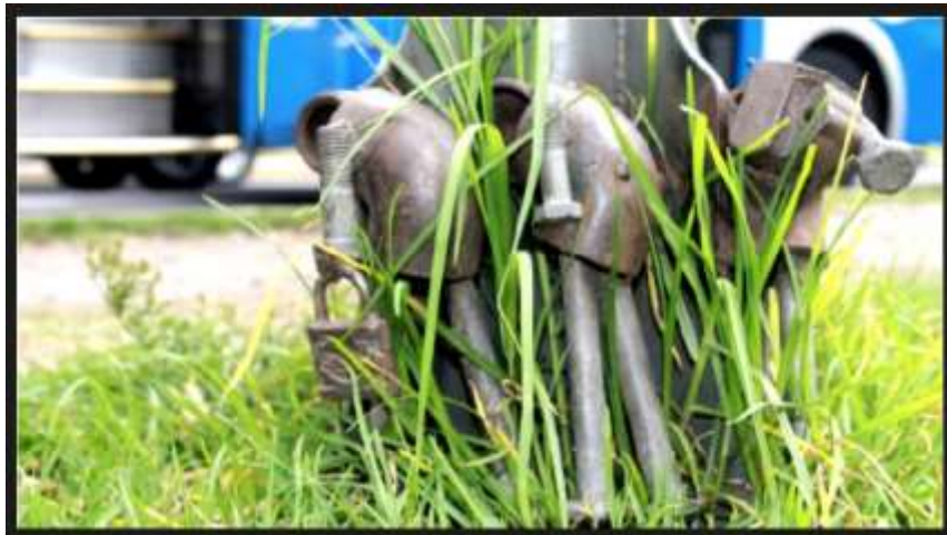
Instalación de autor desconocido.