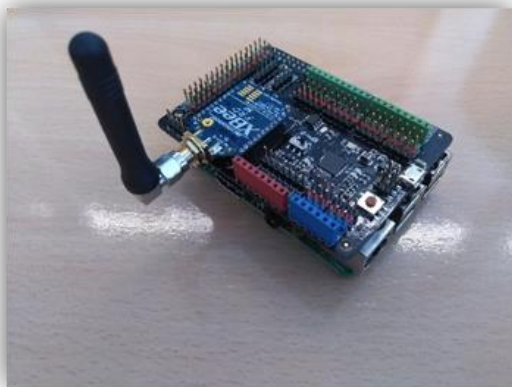
Figura 1: Nodo del sistema fuera del encapsulado.