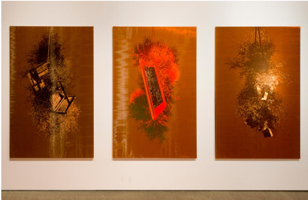
Figura 3. Javier Garcerá, "Hogueras". 200 x 130 cm., técnica mixta sobre seda, 2017/18