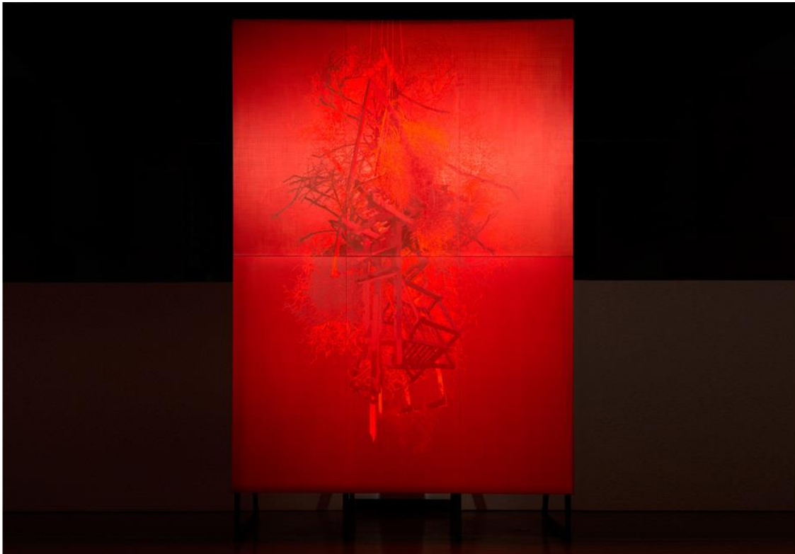
Figura 2. Javier Garcerá, "Que no cabe en la cabeza". 500 x 360 cm., técnica mixta sobre seda, 2017