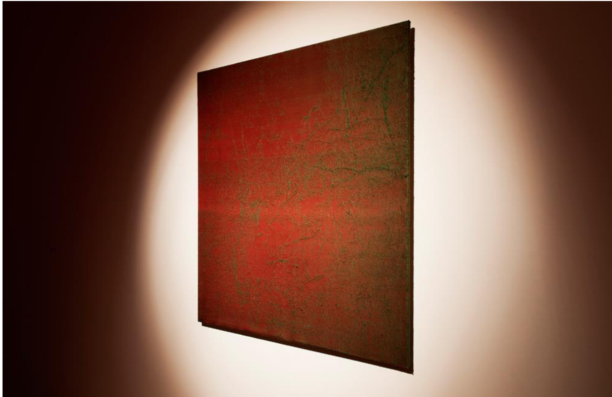
Figura 6. Javier Garcerá, “La menor distancia”. 110 x 110 cm., seda erosionada, 2017

Para que ese tipo de experiencia que acabamos de señalar se produzca, es necesaria una mirada contemplativa que no es más que el ejercicio de dejar que las cosas se acerquen y muevan hacia nosotros. Si anteriormente hemos señalado que la imagen mediática digital carece de toda distancia, en este caso las piezas que componen el proyecto expositivo “Ni decir” ofrecen esa distancia necesaria para la experiencia del ver . Una distancia que nos permite reconocer lo que vemos al tiempo que nos asegura que jamás tendremos acceso a un conocimiento absoluto de lo que acontece entre la obra y el sujeto. Porque la obra es un umbral interminable, un umbral absoluto ante el cual uno debe suspender todo su ser y aceptarse en una entrega que se desvanece en cada instante para volver a reaparecer si nuestra actitud sigue siendo de escucha.