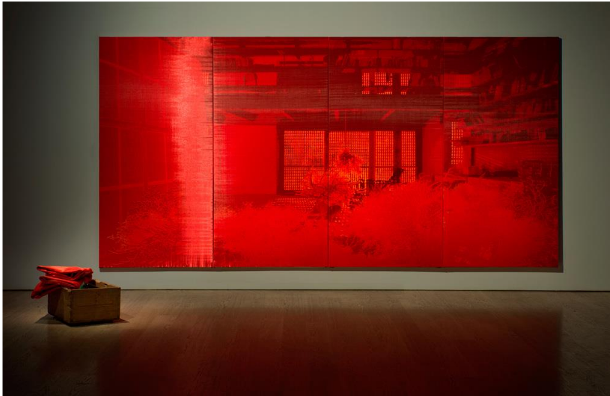
Figura 4. Javier Garcerá, "Ni decir". 200 x 400 cm., técnica mixta sobre seda, 2018