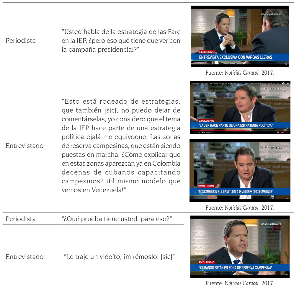
Tabla 3. Notas y transcripción del visionado