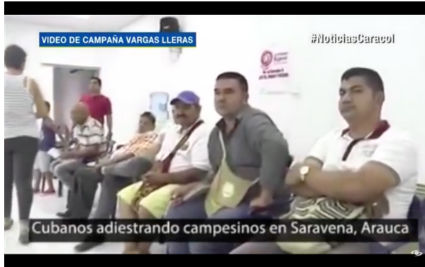
Tabla 4. Notas y transcripción del visionado