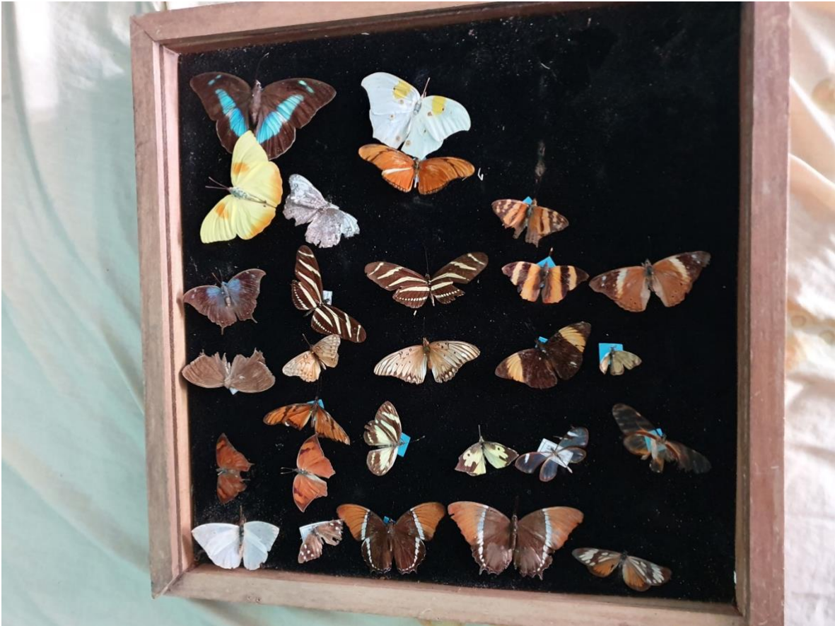
Elaboración del instrumento caja Entomológica