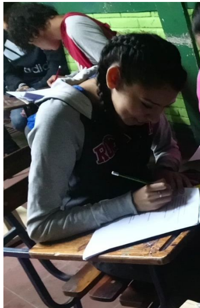
Estudiante respondiendo entrevista