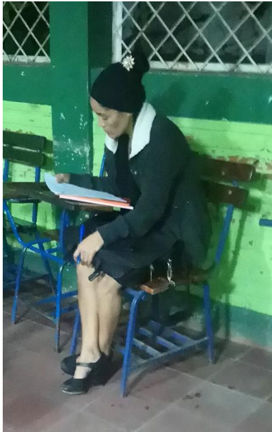
Docente respondiendo entrevista