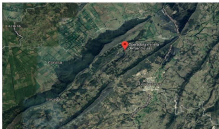
Google earth pro 2010; Languazaque, Cundinamarca.

En cuanto a la magnitud de los impactos sociales, uno de los más relevantes es en la economía local (impacto positivo), durante las operaciones, debido a que ésta se dinamiza por la alta demanda de bienes y servicios donde se benefician madres cabezas de hogar y muchos habitantes más. (Villamil Hernandez, 2014).