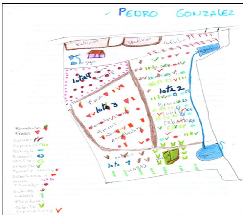
Figura 2. Mapa de finca. Huerta del señor Pedro González

Teniendo en cuenta que las huertas que hacen parte de los integrantes de la ARAC son pequeñas, menos de una hectárea de tierra, la distribución de los cultivos se hace de forma mixta, donde se puedan combinar las plantas y los diferentes tipos de aromas que éstas producen, lo que evita la proliferación de insectos y plagas que puedan afectar los cultivos. Por tanto, no existe una distribución estipulada para cada productor, se hace según lo que cultiven y el tamaño de los terrenos, como se muestra en las figuras 2, 3 y 4.