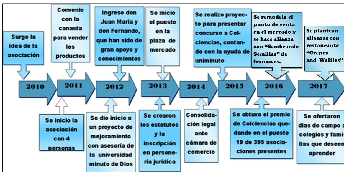
Figura 1. Línea de tiempo del proceso de la ARAC