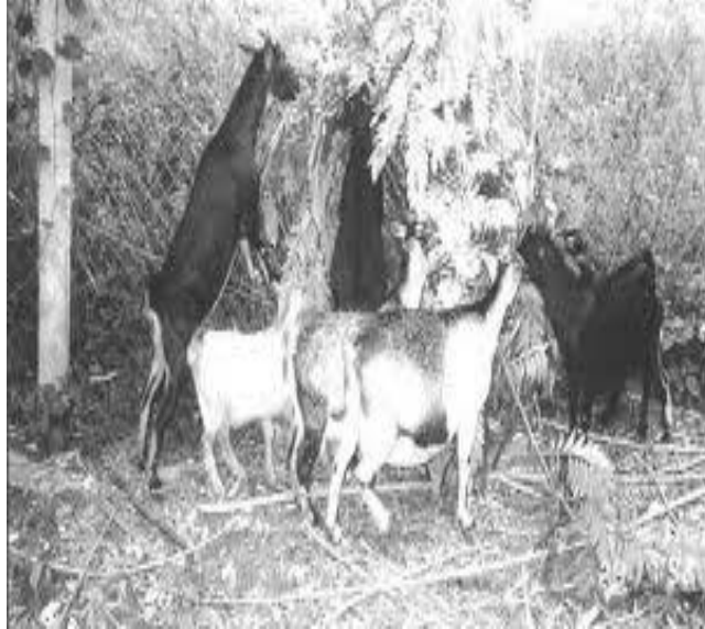
Figura 8. Cabras ramoneando Gliricidia sepium .

Debido a la importancia de la dieta sobre la producción y composición de la leche y la necesidad de buscar alternativas alimentarias para caprinos, se ha realizado un trabajo de investigación en el departamento agropecuario de Bananeiras Brasil sobre la utilización del heno de leguminosas arbóreas como fuente proteica en la alimentación de cabras en lactación, la producción y la composición de la leche, así como la viabilidad económica de su utilización, (Vásquez et al., 2002).