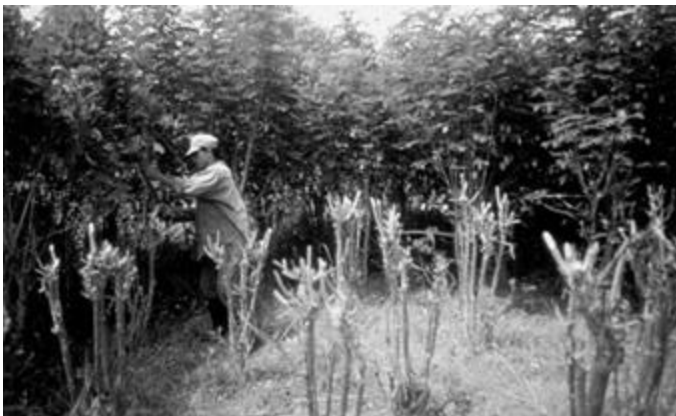
Figura 5. Cosecha de Gliricidia sepium en banco de proteína de 12 años de cultivo, en la reserva natural «El Hatico», El Cerrito, Valle del Cauca.

Por otra parte Escobar et al. (1996); Chacón (1996); Francisco et al. (1998) estudiaron otro factor que incide en la producción de biomasa como es la frecuencia de corte, dicha frecuencia debe estar entre 70-90 días, dependiendo de la disponibilidad de agua.