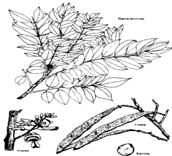
Figura 1. Características botánicas más sobresalientes de Gliricidia sepium .

Figura 1. Características botánicas de la Gliricidia sepium .