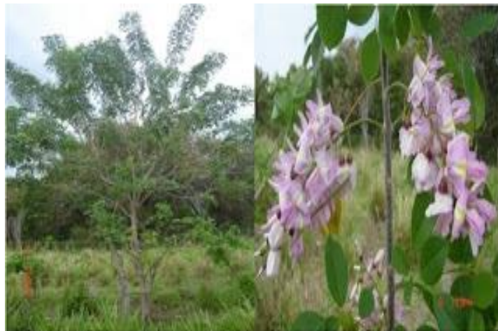
Figura 2. Arbusto y flores de la Gliricidia sepium . Fuente: Centro Agropecuario la Angostura SENA, (Huila, 2009)

Los frutos son vainas dehiscentes aplanadas que poseen tres a ocho semillas lenticulares de color café claro delgadas y planas. Las flores son amariposadas de color entre rosa y púrpura claro (Figura 2), de una longitud aproximada de 2 cm y agrupadas en racimos (Eusse, 2003)