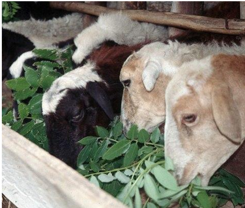
Figura 7. Ovejas suplementadas con hojas frescas de Gliricidia sepium .

En un trabajo de investigación, realizado por González et al. (1997), en la Universidad Nacional Experimental Simón Rodríguez en el estado de Carabobo Venezuela, que tuvo como objetivo determinar el consumo de forraje complementario, así como la ganancia diaria de peso vivo, en ovinos pastoreando restringidamente en una plantación de naranja ( Citrus cinensis ) suplementados con matarratón ( Gliricidia sepium ).