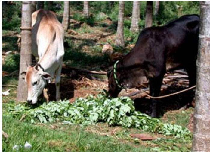
Figura 6. Mautas suplementadas con hojas de Gliricidia sepium . Fuente: data base sitio Maram (2006)

La Gliricidia sepium en bovinos, se ha venido utilizando como alternativa alimenticia en las producciones doble propósito. El efecto de esta sobre el crecimiento y la aparición de la pubertad en la suplementación de mautas mestizas, han sido estudiadas por diferentes autores.