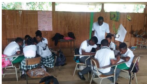
Ilustración 5 Aplicación planes de aula