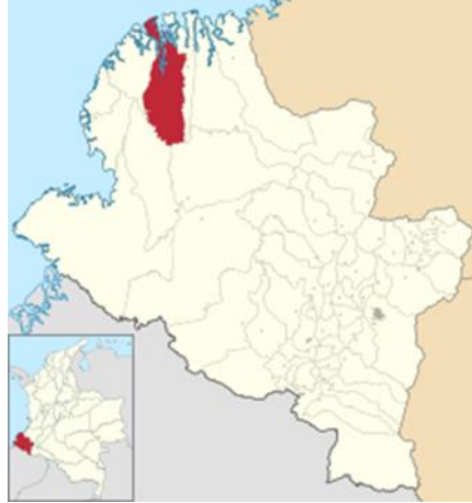
Ilustración 1 Ubicación del municipio de Olaya Herrera