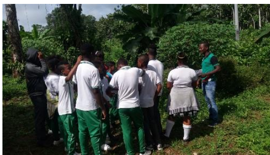
Ilustración 7 Reconocimiento de la planta medicinal