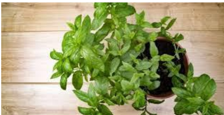
Ilustración 4 Planta medicinal la menta

A continuación, se presenta los cuatro planes de aula que integran la estrategia pedagógica