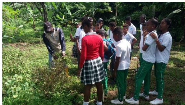
Ilustración 6 Salida de campo