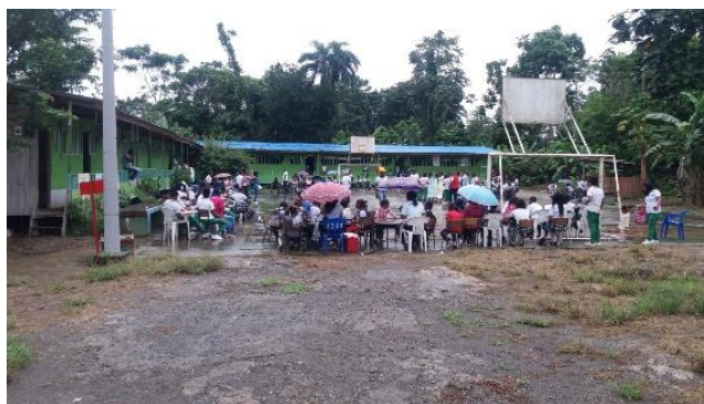
Ilustración 3 IE Agropecuario del Río Sanquianga

La Institución Educativa Agropecuario Río Sanquianga, es una entidad de carácter público y está ubicada en la vereda La Herradura, margen derecho del río Sanquianga (Patía). Las instalaciones constan de dos construcciones en madera. La primera consta de cuatro espacios distribuidos de la siguiente manera: Cocina – restaurante escolar, aula de clases para el grado primero, oficina para secretaría y coordinación, donde se atiende al grado preescolar y un aula para el grado segundo. La segunda construcción consta de dos naves donde se atiende a los estudiantes en su orden: grado décimo, grado cuarto, grado quinto, grado undécimo y grado noveno, luego hay un espacio para biblioteca y otro espacio adecuado para sala de docentes; grado octavo, grado séptimo y grado sexto. Y en la parte de atrás una batería sanitaria de tres baños. Hay además una cancha polideportiva y un área para las prácticas agrícolas.