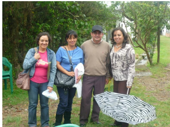
Padre Director y Docentes.