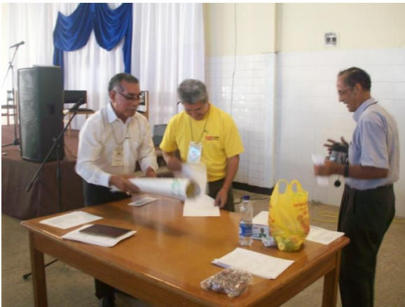
Participantes Escuela de Padres.