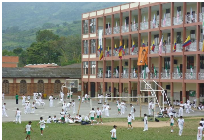
UNIDAD EDUCATIVA MUNICIPAL ITA VALSALICE.