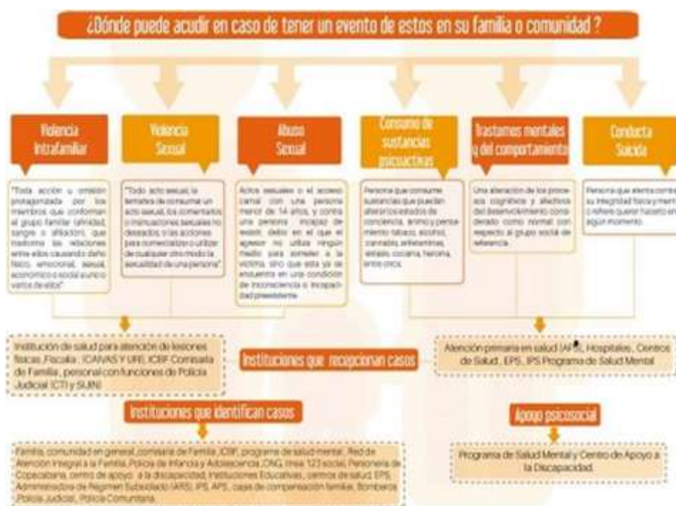
Figura 4 Ruta de salud mental (copacabana, 2016)