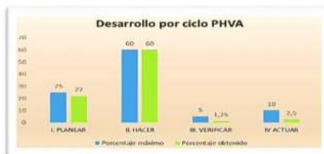
Anexo 3. Desarrollo por ciclo PHVA