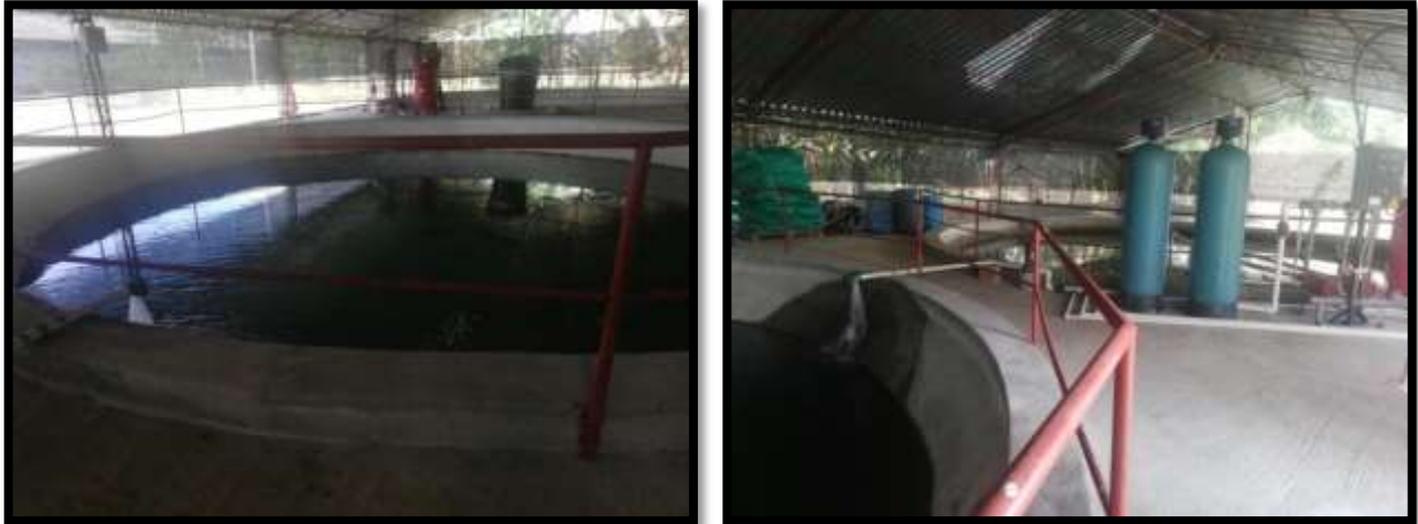
Imagen 5. Sistema de potabilización del agua utilizada dentro de la granja avícola Córcega.

suministrados en su gran mayoría por la empresa GASQUIN. En el área rural donde está ubicada la granja avícola Córcega no existe una red de alcantarillado, las aguas residuales resultantes de las actividades domésticas son vertidas a un sistema de pozo séptico, las aguas de las coberturas (techos) y el fluidos producto del lavado de los galpones son conducidos por medio de un sistema de canales de concreto hasta un zona de pastos para su infiltración.