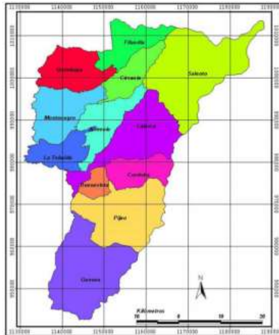
Imagen 1. Mapa del departamento Quindío donde se puede observar la ubicación geográfica del municipio de Quimbaya

La Granja Avícola Córcega se encuentra ubicado al Nor occidente del departamento del Quindío en el municipio de Quimbaya, municipio limitado al costado norte y al occidente con el departamento del Valle del Cauca, con el río La Vieja que forma el límite occidental. Al costado sur, el río Roble forma el límite con el municipio de Montenegro. En el flanco oriental limita con los municipios de Filandia y Circasia. Quimbaya Quindío presenta una altura promedio sobre el nivel del mar de 1.425 msnm, el rango de precipitaciones anuales se encuentra entre 2000 y 2500 mm, estableciendo una precipitación promedio de 1770,6 mm y una media de humedad relativa de 71,9% cualificando al municipio dentro de un Clima Templado Húmedo acorde al anuario cafetero meteorológico (CRQ, 2010). El municipio de Quimbaya Quindío tienen una extensión de 126,69 KM 2 , una población de 32928 personas y su cabecera municipal se encuentra aproximadamente a una distancia de 22.4 km de la ciudad de Armenia capital del departamento.