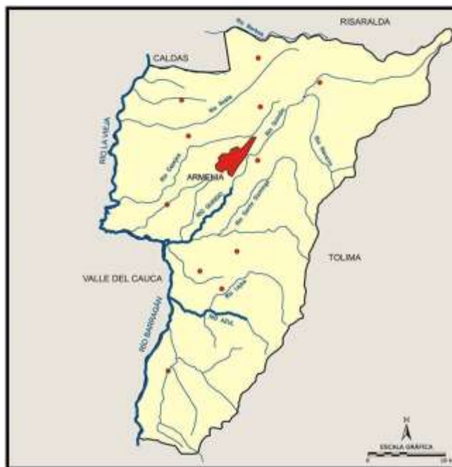
Imagen 3. Mapa hidrológico del departamento del Quindío (IGAC, 2013)

El departamento del Quindío posee una gran red hidrográfica de gran importancia para la región, esta red está constituida por el río la vieja, el cual a su vez cuenta con los siguientes afluentes: el río Barbas, el río Roble, el río Espejo, el río Quindío, el río Cristales, el río Santo Domingo, el río Navarco, el río Barragán, el río Gris, el río San Juan, Rojo, el río Lejos, el río Boquerón y el río Verde (IGAC, 2013). Además de poseer una gran cantidad de quebradas y drenajes naturales simples conectados a este sistema.