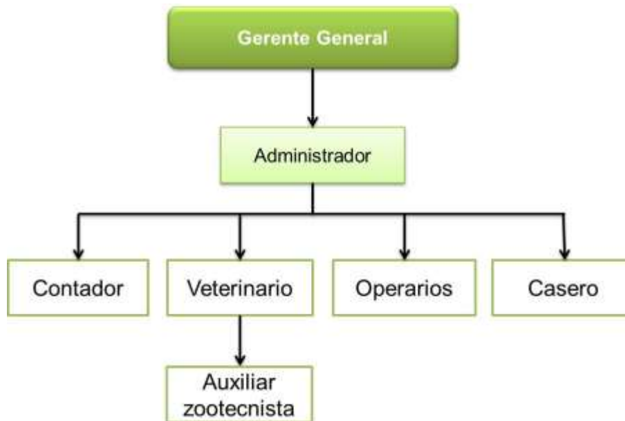
Grafico 2. Estructura administrativa de la Granja Avícola Córcega.