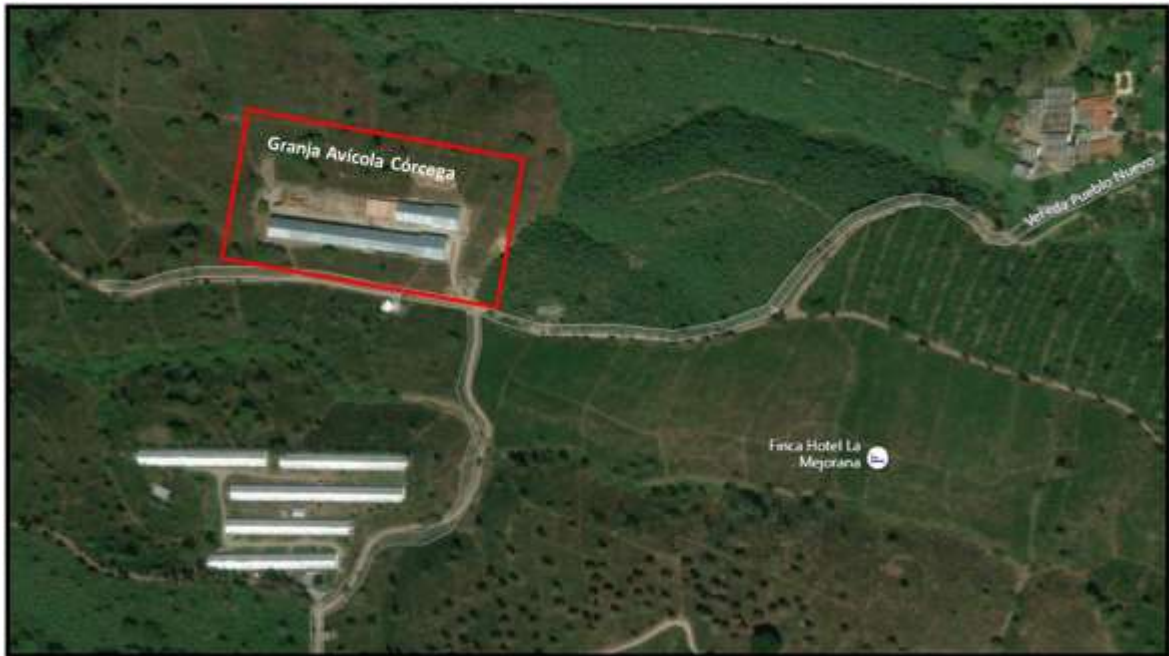
Imagen 2. Plano de la ubicación geográfica de la Granja Avícola Córcega.

Limita al oriente con la finca hotel santa cruz de las Palmas, al occidente con la finca La mejorana, al sur con el predio El tizón y al norte con la finca el Guadual. La granja se encuentra ubicada a 2, 5 km del casco urbano del municipio de Quimbaya, su principal vía de acceso es la variante Alcalá - Quimbaya (29Q) - Kilómetro 1, entrada número 3, vereda pueblo nuevo Quimbaya, Vía terciaria con carretera sin pavimento a 5 minutos de la variante principal. Acorde a las matrículas inmobiliaria del conjunto de predios que rodean la Granja Córcega estos presentan actividades comerciales ganaderas, agroforestales, forestales, pecuarios y complementarios como alojamiento rural, usos industriales, agroindustriales y de servicios. Entre los complejos ecosistémicos circundantes a la Granja Avícola Córcega se destacan áreas de importancia ambiental establecidas acorde al plan básico de ordenamiento territorial del municipio de Quimbaya, drenajes simples, guaduales y agro ecosistemas principalmente cafeteros.