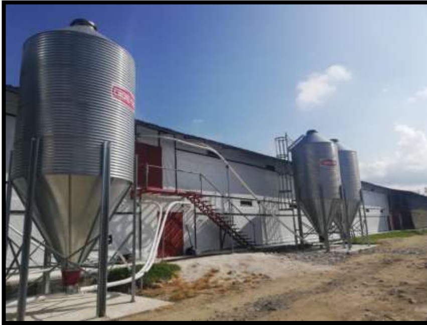
Imagen 4. Fotografía de las instalaciones externas de los galpones de la Granja Avícola Córcega.

Cafeteros y no cuenta con las características necesarias para el consumo de las aves.