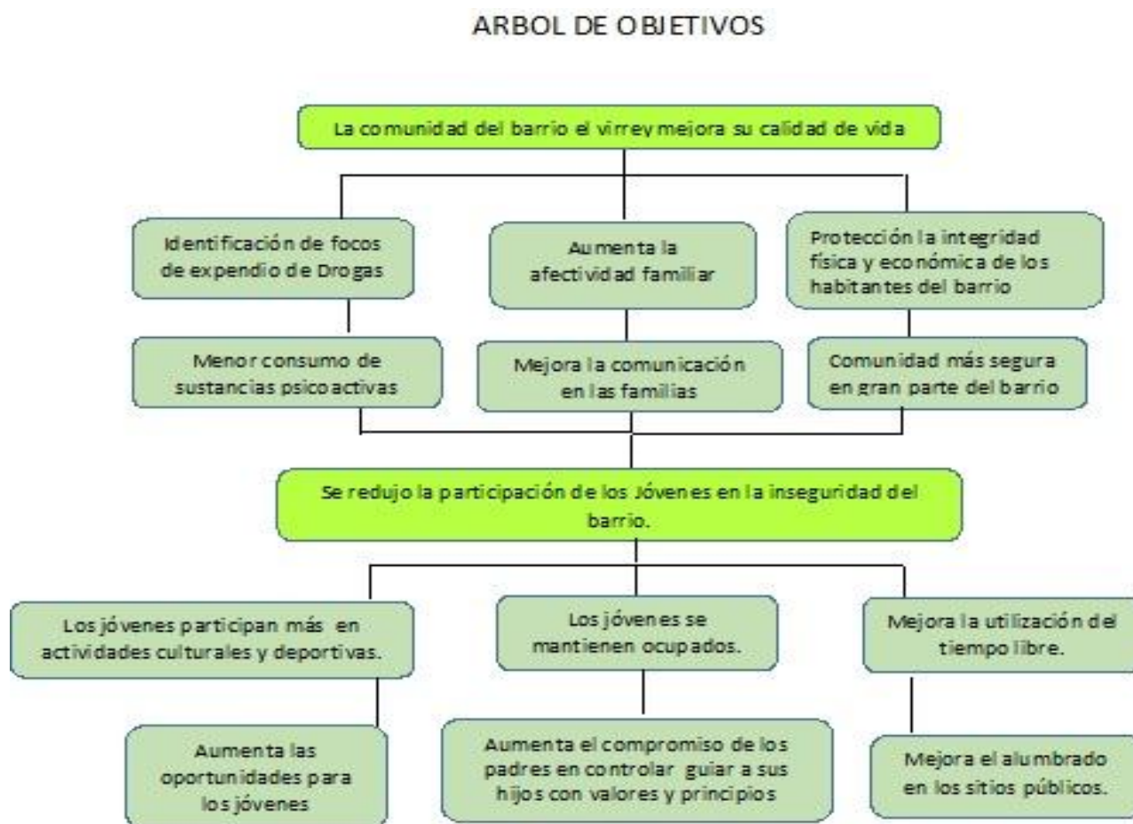
Figura 2. Árbol de objetivos. ( Anexo 5)