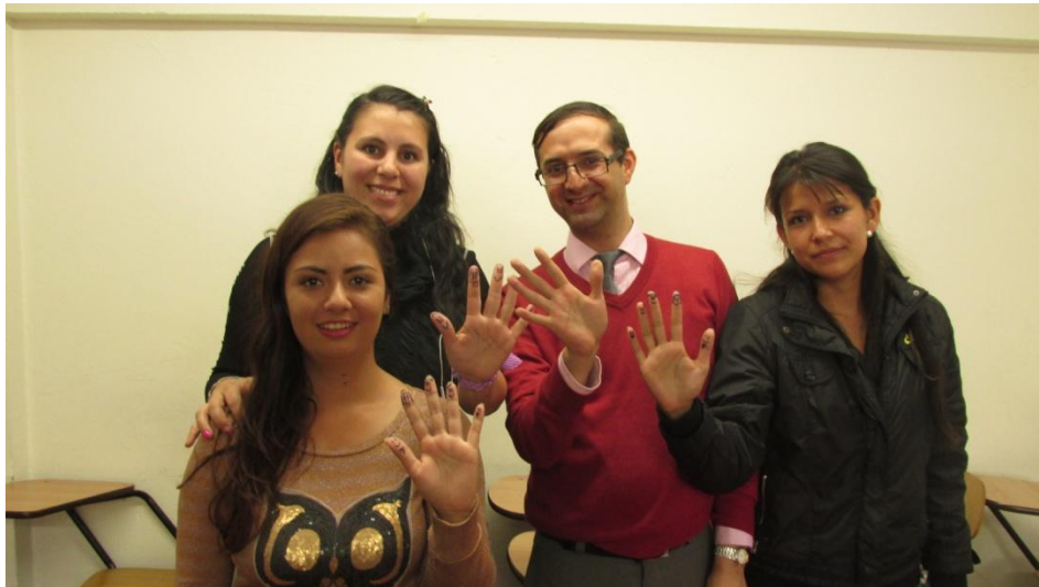
Figura 2: La actividad académica es construcción de tejido social

La contribución a la construcción del tejido social es una de las finalidades de la labor de un licenciado en lengua extranjera. Muchas veces, dicho propósito se descubre cuando el docente se encuentra ya en el aula misma más que en el momento en el que se estudia. Al contemplar el rostro de los estudiantes, al escuchar acerca de sus victorias y triunfos, al conocer sus fortalezas y dificultades en el proceso de aprendizaje, se pueden apreciar las necesidades individuales y grupales, y por consiguiente nace un vivo deseo de adelantar los procesos educativos. Aunque estos logros parezcan insignificantes en primera instancia, estas interacciones conducen a la formación de profesionales competentes que construyen comunidad. Cada estudiante también pertenece a una familia, a quien finalmente coopera en su construcción.