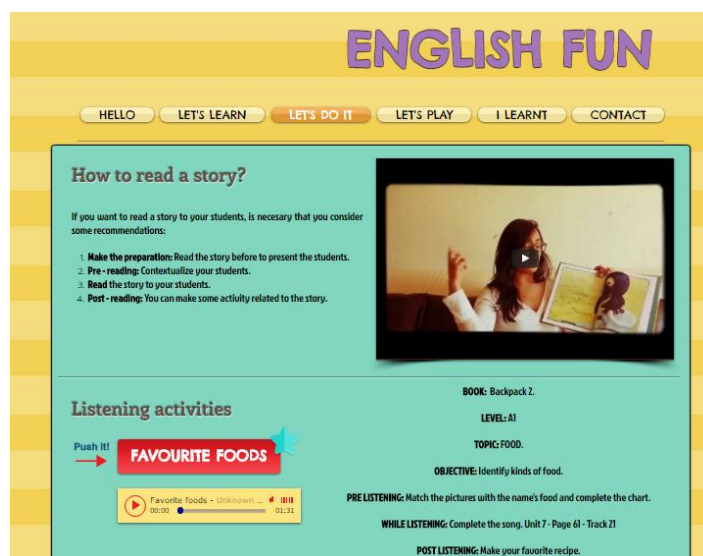
Figura 4: Ejemplo de portafolio virtual

Teniendo en cuenta cómo debe entenderse el rol del observador, ahora podrá establecerse como se llevará a cabo la observación. La investigación contó con dos fuentes de información en la etapa de observación: Primeramente, se crearon portafolios virtuales por medio de la página www.wix.com en el que los estudiantes de la asignatura English Teaching I lograron presentarse como docentes demostrando los alcances de sus capacidades profesionales. Además el diseño de ésta web puede evidenciar el avance de los estudiantes durante el estudio de la licenciatura English Teaching I. (Anexo 1: Ejemplos de Observaciones del Portafolio Virtual p.66)