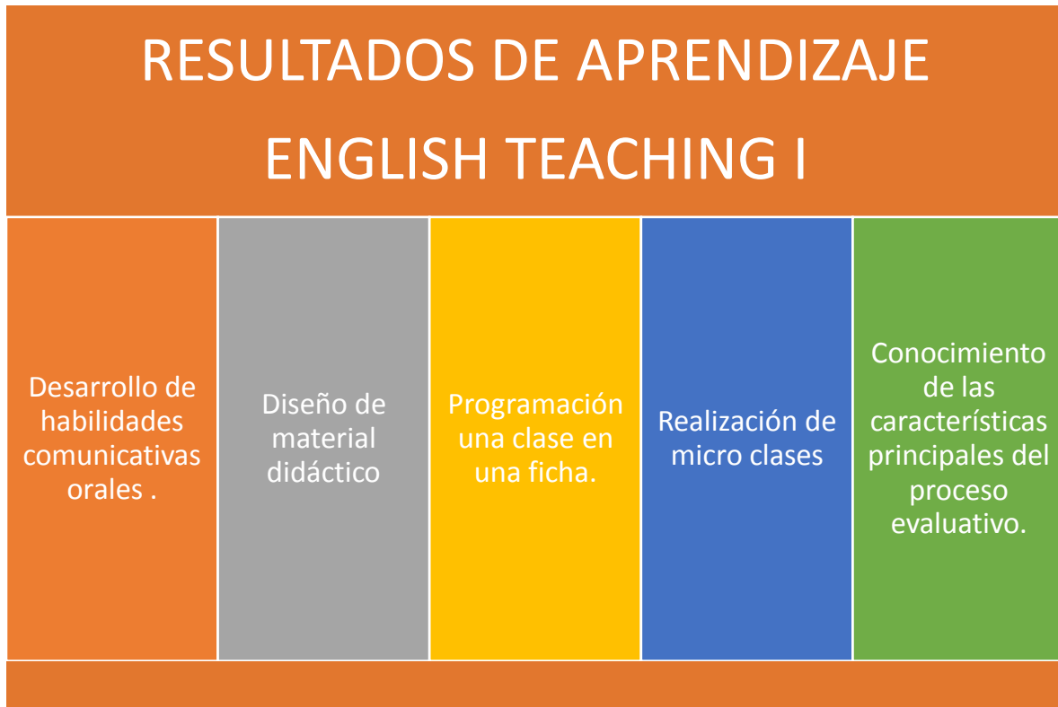
Figura1: Resultados de aprendizaje. English Teaching I

asignatura, tanto en temas como en evaluación se encuentran orientados al logro de dichos resultados.