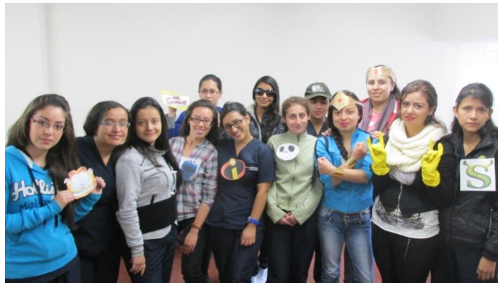
Figura 3: Estudiantes de la Licenciatura. I semestre 2015

Los estudiantes son de género femenino, entre 18 y 25 años. Pese a que ellos muchas veces no presentan los desarrollos deseados en aprendizaje de lengua inglesa, entran a ser parte de la asignatura de Didáctica de la lengua inglesa (English Teaching I). Algunos de ellos trabajaban, estudiaban y realizaban prácticas al mismo tiempo, por lo tanto los contenidos que se compartían en dos horas semanales de sesiones era necesario que fueran muy ricos en enseñanza y aprendizaje. Análogamente, las actividades extra clase fueron asignadas para que fueran significativas y enriquecedoras.