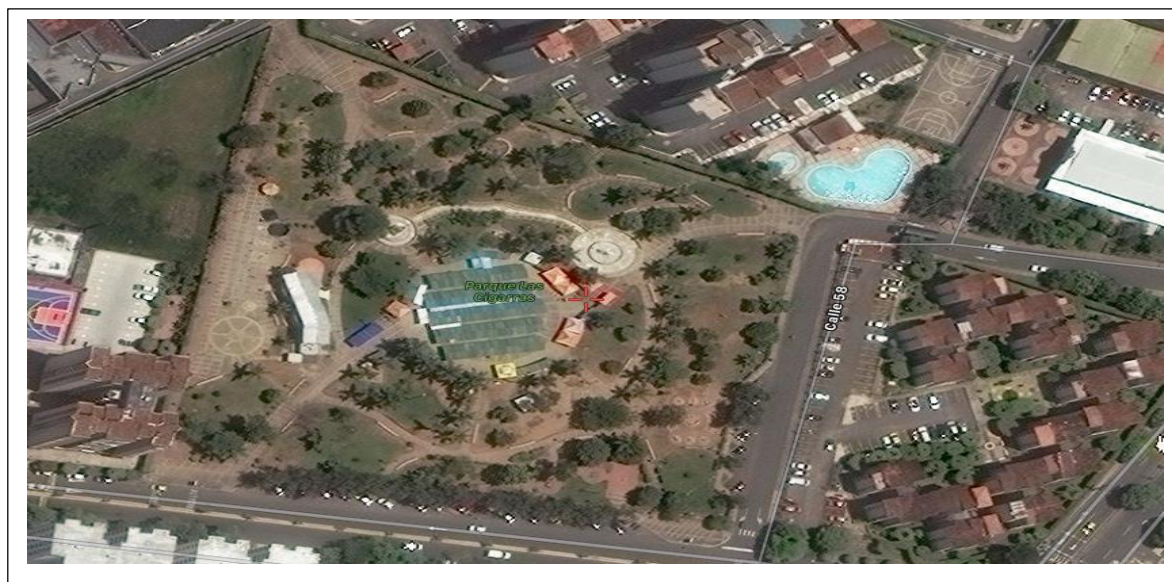
Figura # 5 Parque de las Cigarras Zona 5