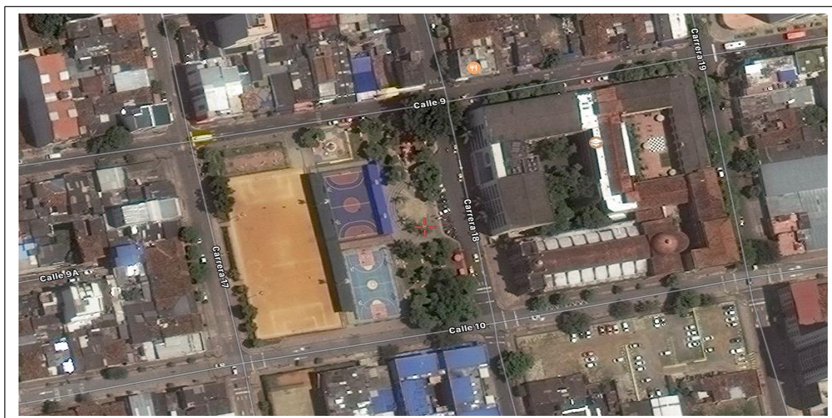
Figura # 6 Parque Cristo Rey Zona 6