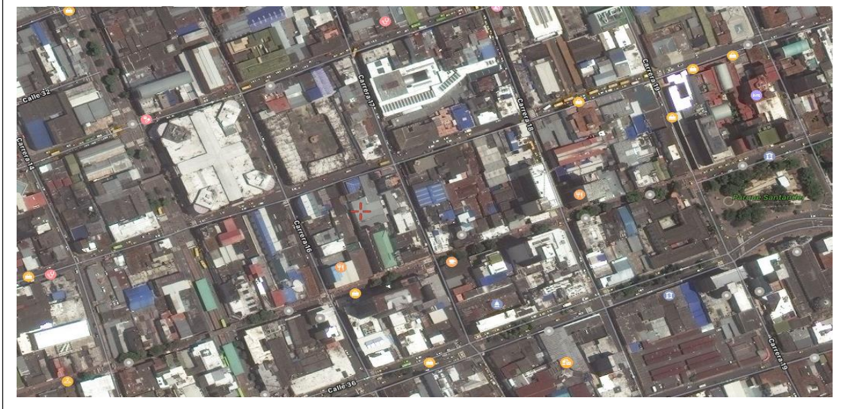
Figura # 4 Centro de Bucaramanga Zona 4