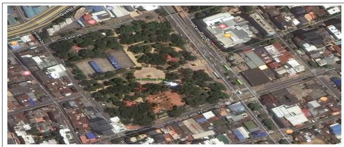
Figura # 8 Parque de los niños Zona 8