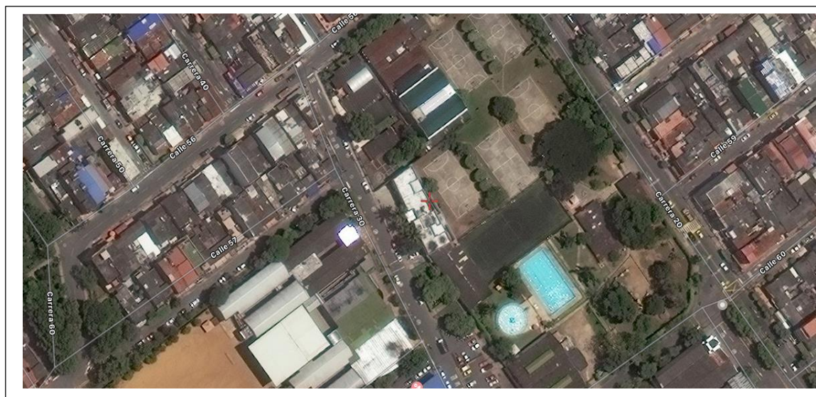
Figura # 7 Barrio Mutis Zona 7