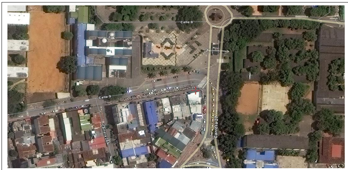
Figura # 9 Portería UIS Zona 9